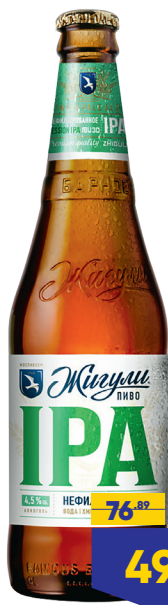
ПИВО ЖИГУЛИ IPA, светлое, 0,45 л, Россия