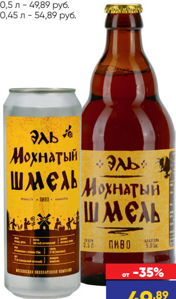
ПИВО ЭЛЬ МОХНАТЫЙ ШМЕЛЬ, светлое, Россия: - 0,5 л - 49,89 руб. - 0,45 л - 54,89 руб.