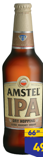
ПИВО AMSTEL IPA, светлое, 0,45 л, Россия