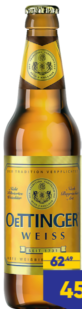
ПИВО OETTINGER WEISS, светлое, 0,45 л, Россия

Попробуйте сочетать Эль с очень острой пищей, например, с морским омуном, приготовленным на огне. Эль незаменим для барбекю и блюд мексиканской кухни, отлично подходит к пище. Кремовый или сладкий стаут лучше всего подавать к шоколаду. Попробуйте добавить эти напитки в шоколадные и фруктовые десерты - в творожный пудинг с малиновым соусом или другую выпечку с карамелью или орехами пекан.