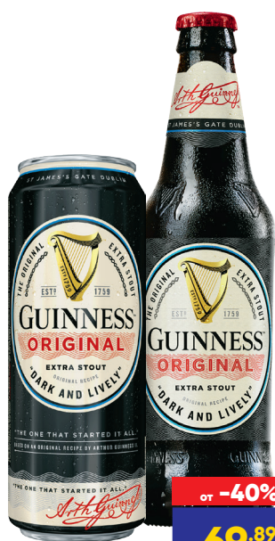
НАПИТОК ПИВНОЙ GUINNESS ORIGINAL, темный, 0,43-0,45 л, Россия