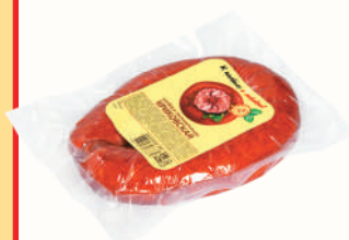
КОЛБАСА "КРИКОВСКАЯ" П/К, ИНЕЙ, 300 ГР