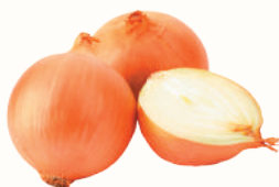
ЛУК РЕПЧАТЫЙ, 1 КГ