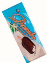
МОРОЖЕНОЕ "ДЕЖАВЮ" ВАНИЛЬНОЕ В ШОКОЛАДНОЙ ГЛАЗУРИ, 60 ГР