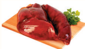
ПЕЧЕНЬ СВИНАЯ С/М, 1 КГ