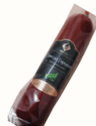
СЕРВЕЛАТ "ГОРОДСКОЙ" В/К, ОНЕГА, 1 КГ