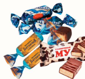
КОНФЕТЫ В АССОРТИМЕНТЕ, 1 КГ