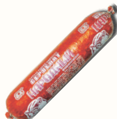
СЕРВЕЛАТ "НАРОДНЫЙ" В/К, ЕВРОКОМ, 1 КГ