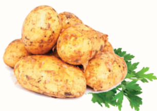
КАРТОФЕЛЬ КРУПНЫЙ, 1 КГ