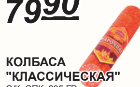
КОЛБАСА "КЛАССИЧЕСКАЯ" С/К, СПК, 235 ГР