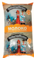
МОЛОКО ПИТЬЕВОЕ 1,5%, 930 МЛ