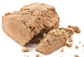
ХАЛВА ПОДСОЛНЕЧНАЯ, 1 КГ