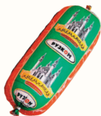
КОЛБАСА "МУСУЛЬМАНСКАЯ" ВАР., РУЗКОМ, 1 КГ