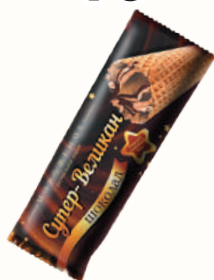
МОРОЖЕНОЕ "СУПЕР-ВЕЛИКАН" ШОКОЛАД, 100 ГР