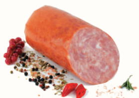
КОЛБАСА "КУПЕЧЕСКАЯ СЛОБОДА" П/К, АНКМ, 1 КГ