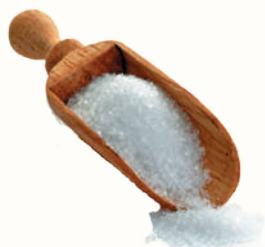
САХАРНЫЙ ПЕСОК, 1 КГ