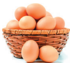
ЯЙЦО, 1 ДЕС.