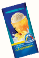
МОРОЖЕНОЕ "СЛАДКОЕЖКА" ВАНИЛЬНОЕ, 65 ГР