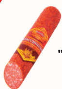
КОЛБАСА "МАРОЧНАЯ" С/К, СПК, 235 ГР