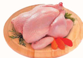
ЦЫПЛЕНОК ОХЛАЖДЕННЫЙ, 1 КГ