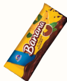
МОРОЖЕНОЕ ЭСКИМО "БАНАН В ШОКОЛАДЕ" 60 ГР