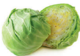
КАПУСТА, 1 КГ