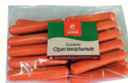
СОСИСКИ "ОРИГИНАЛЬНЫЕ" ОХЛ., ВНМД, 1 КГ