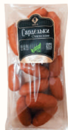
САРДЕЛЬКИ "ОНЕЖСКИЕ" ОХЛ., ОНЕГА, 1 КГ