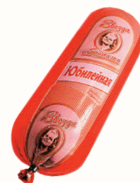
КОЛБАСА "ЮБИЛЕЙНАЯ" ВАР., ЦАРИЦЫНО, 1 КГ