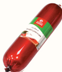
КОЛБАСА "ТРАДИЦИОННАЯ" ВАР., ВНМД, 1 КГ