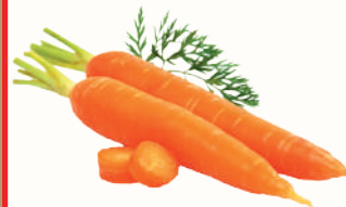
МОРКОВЬ, 1 КГ

Ждём Вас с 08:00 до 02:00 по адресам: Санкт-Петербург, м. "Ладожская", пр. Косыгина, 21, м. "Пр. Просвещения", ул. Хошимина, 14