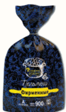
ПЕЛЬМЕНИ "ФИРМЕННЫЕ" "КУЛИНАРНЫЙ РЕШЕНИЯ", 900 ГР