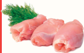
ФИЛЕ ОКОРОКА КУРИНОЕ ОХЛ., 1 КГ