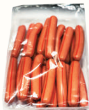
СОСИСКИ "ОСОБЕННЫЕ С ГОВЯДИНОЙ" ОХЛ., ЛАДОГА, 1 КГ