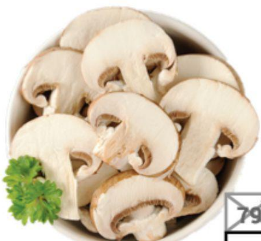
ШАМПИНЬОНЫ РЕЗАННЫЕ ВЫБОРЖЕЦ 300г