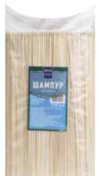
Шампуры METRO PROFESSIONAL арт. 87212,87093,87094