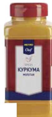
Куркума METRO CHEF МОЛОТАЯ арт. 89457