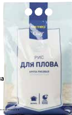
Рис для плова METRO CHEF арт. 564734

Морковь нарезать брусочками. Мясо, лук, нарезанный полукольцами, обжарить, добавить морковь и соль. Добавить воду, сахар, в центр насыпать горох. Накрыть маленькой крышкой, потушить и добавить изюм. Рис замочить в воде на 2 часа с добавлением шафрана, выложить в казан, всыпать зиру. Поставить на сильный огонь на 3-4 мин, далее уменьшить огонь и тушить 25 мин до готовности. Тыкву весом 850-950 г очистить от семян, натереть внутреннюю часть чесночным маслом и медом. Завернуть в фольгу, запечь при T 200C в течение 45 мин. Тыкву наполнить пловом, добавить обжаренный чеснок и перец, накрыть крышкой из тыквы.