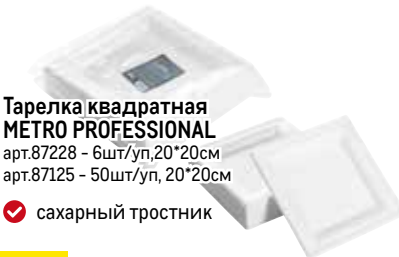
Тарелка квадратная METRO PROFESSIONAL арт.87228 - 6шт/уп, 20*20см арт.87125 - 50шт/уп, 20*20см