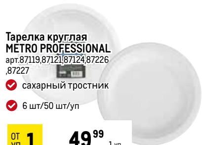
Тарелка круглая METRO PROFESSIONAL арт.87119,87121,87124,87226, 87227