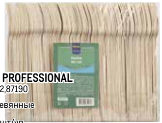
Вилка METRO PROFESSIONAL арт.87222,87190