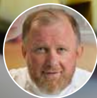
Константин Ивлев Шеф-повар, телеведущий