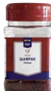
Шафран METRO CHEF арт. 94526