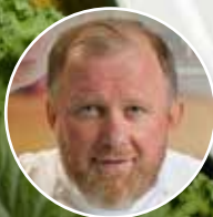
Константин Ивлев Шеф-повар, телеведущий