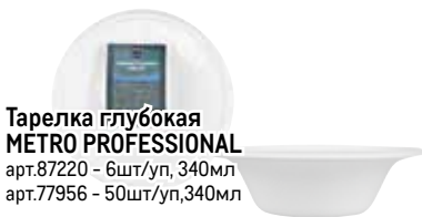
Тарелка глубокая METRO PROFESSIONAL арт.87220 - 6шт/уп, 340мл арт.77956 - 50шт/уп,340мл