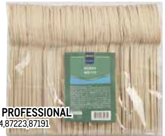
Ложка METRO PROFESSIONAL арт.87224,87223,87191