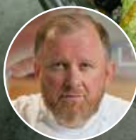
Константин Ивлев Шеф-повар, телеведущий