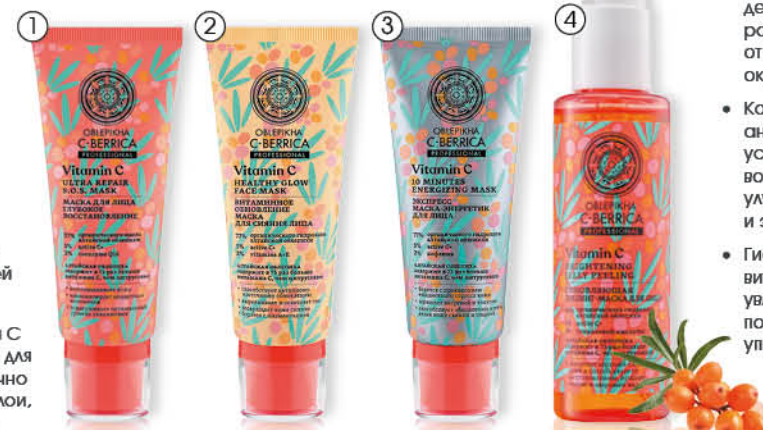
1. Natura Siberica Маска для лица, SOS-Глубокое восстановление, 100 мл