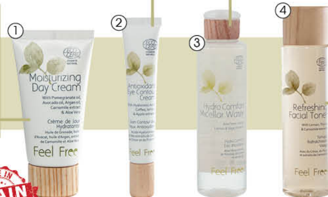
1. Feel Free Крем для лица, Moisturizing Day Cream, увлажняющий, дневной, 50 мл

4. Тоник освежающий Освежает и тонизирует кожу, поддерживает оптимальный гидробаланс. Подходит для всех типов кожи.