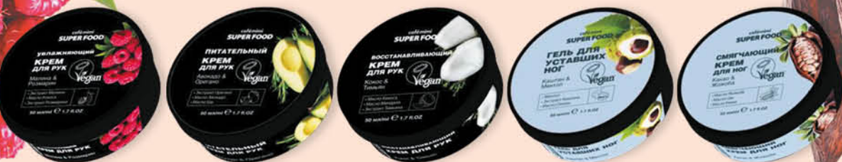
Увлажняющий крем для рук Малина & Розмарин