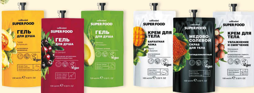
Cafe Mimi Серия Super Food, Гель для душа, 100 мл, в ассортименте

CAFE MIMI предлагает новую серию косметики по уходу за волосами, лицом и телом SUPER FOOD!