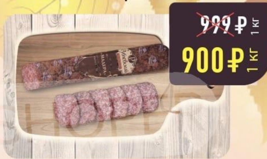
КОЛБАСА «МАДЕРА» сырокопчёная