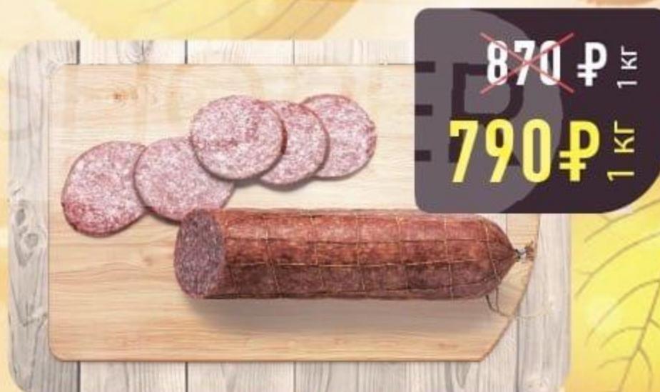
СЕРВЕЛАТ «РУБЛЁВСКИЙ ЭЛИТНЫЙ» варёно-копчённый