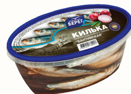
КИЛЬКА ПРЯНОГО ПОСОЛА "БАЛТИЙСКАЯ" "БАЛТИЙСКИЙ БЕРЕГ, 400 ГР