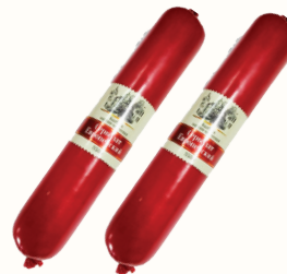
СЕРВЕЛАТ "ЕВРОПЕЙСКИЙ" В/К СОВАД, 350 ГР