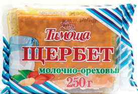
ЩЕРБЕТ "ТИМОША" МОЛОЧНО-ОРЕХОВЫЙ, 250 ГР