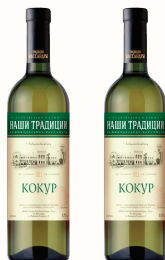
ВИНО НАШИ ТРАДИЦИИ "КОКУР" БЕЛОЕ СУХОЕ, 0,75 Л