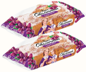
КЕКС "АЛАДУШКИН" "СТОЛИЧНЫЙ" "ДАРНИЦА", 400 ГР