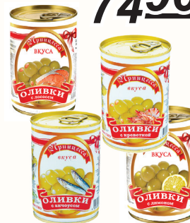
ОЛИВКИ "ПРИНЦЕССА ВКУСА" В АССОРТИМЕНТЕ, 300 МЛ