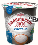
СМЕТАНА "ВОЛОГОДСКОЕ ЛЕТО" 15%, 400 ГР