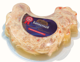
ХОЛОДЕЦ "КУРОЧКА БАНКЕТНАЯ", 1 КГ