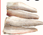
ХЕК ТУШКА С/М, 1 КГ