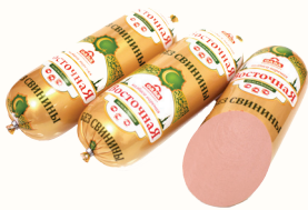
КОЛБАСА "ВОСТОЧНАЯ" ВАР., САВА, 1 КГ