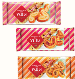
ИЗДЕЛИЕ Х/Б СДОБНОЕ "ВЛЮБИТЬСЯ ПО УШИ" В АССОРТИМЕНТЕ, 180 ГР