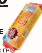
ПЕЧЕНЬЕ САХАРНОЕ "СО ВКУСОМ ТОПЛЕННОГО МОЛОКА", 160 ГР