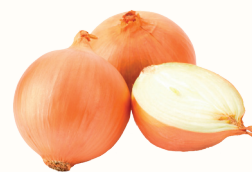
ЛУК РЕПЧАТЫЙ, 1 КГ

Ждём Вас с 08:00 до 02:00 по адресам: Санкт-Петербург, м. "Ладожская", пр. Косыгина, 21, м. "Пр. Просвещения", ул. Хошимина, 14