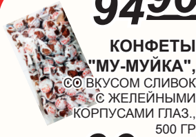
КОНФЕТЫ "МУ-МУЙКА", СО ВКУСОМ СЛИВОК С ЖЕЛЕЙНЫМИ КОРПУСАМИ ГЛАЗ., 500 ГР