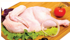
ЦЫПЛЕНОК БРОЙЛЕР ОХЛ., 1 КГ