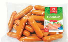
СОСИСКИ "ГОВЯЖЬИ" ОХЛ., ВНМД, 1 КГ