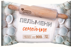
ПЕЛЬМЕНИ "СЕМЕЙНЫЕ" "КУЛИНАРНЫЕ РЕШЕНИЯ", 900 ГР