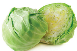
КАПУСТА, 1 КГ