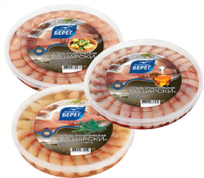
СЕЛЬДЬ ФИЛЕ КУСОЧКИ В МАСЛЕ "ПО-ЦАРСКИ" "БАЛТИЙСКИЙ БЕРЕГ" В АССОРТИМЕНТЕ, 200 ГР