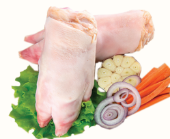
НОГИ СВИНИЕ С/М, 1 КГ