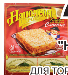
КОРЖИ "НАПОЛЕОН- ЧЕРОКА" ДЛЯ ТОРТА СЛОЕННЫЕ, 300 ГР