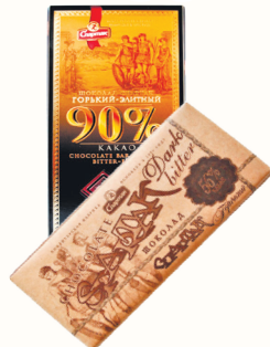
ШОКОЛАД "СПАРТАК" В АССОРТИМЕНТЕ, 90 ГР