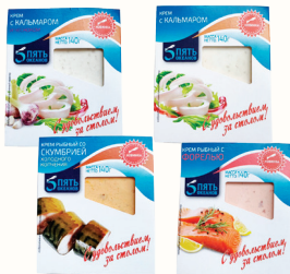
КРЕМ РЫБНЫЙ "5 ОКЕАНОВ" В АССОРТИМЕНТЕ, 140 ГР