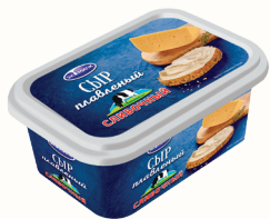
СЫР ПЛАВЛЕННЫЙ "ЭКОМИЛК" СЛИВОЧНЫЙ 55%, 400 ГР