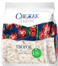
ТВОРОГ "СВЕЖЕЕ ЗАВТРА", 1,8%, 400 ГР