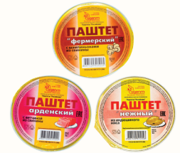
ПАШТЕТ В АССОРТИМЕНТЕ, ВНМД, 90 ГР