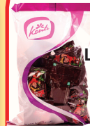
КОНФЕТЫ ШОКОЛАДНЫЕ ИСТОРИИ "ДЖЕК" МИНИ, 500 ГР