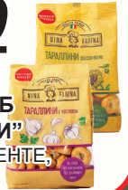
ИЗДЕЛИЕ Х/Б "ТАРАЛЛИНИ" В АССОРТИМЕНТЕ, 180 ГР