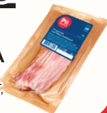
ГРУДИНКА В/К ПИТ-ПРОДУКТ, 100 ГР