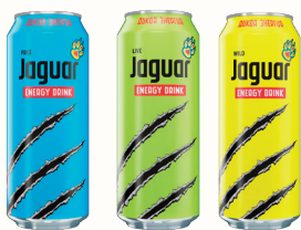
НАПИТОК ЭНЕРГЕТИЧЕСКИЙ "ЯГУАР" ГАЗ. В АССОРТИМЕНТЕ, 500 МЛ