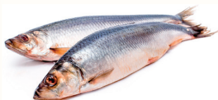
СЕЛЬДЬ С/М, 1 КГ