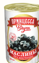
МАСЛИНЫ Б/К "ПРИНЦЕССА ВКУСА", 300 МЛ