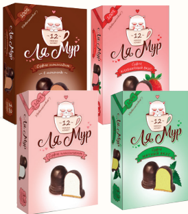
СУФЛЕ "ЛЯ МУР" В АССОРТИМЕНТЕ, 230 ГР