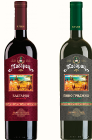
ВИНО СТОЛОВОЕ КРЫМСКОЕ "МАГАРАЧ" В АССОРТИМЕНТЕ, 0,75 Л