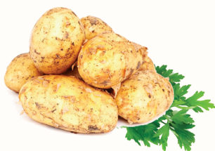
КАРТОФЕЛЬ КРУПНЫЙ, 1 КГ