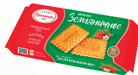
ПЕЧЕНЬЕ САХАРНОЕ "ЗЕМЛЯНИЧНОЕ", 190 ГР