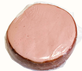
КОЛБАСА "ДОКТОРСКАЯ" ВАР. ФК ЛАДОГА, 1 КГ