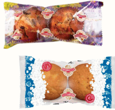
КЕКС "АЛАДУШКИН" В АССОРТИМЕНТЕ. "ДАРНИЦА", 2 ШТ. X 75 ГР