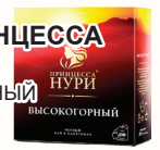
ЧАЙ "ПРИНЦЕССА НУРИ" ВЫСОКОГОРНЫЙ ЧЕРН. БАЙХ. 100 ПАК. С/Я