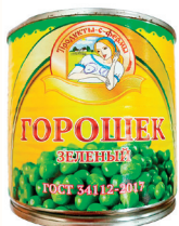
ГОРОШЕК ЗЕЛЕНый "ПРОДУКТЫ С ФЕРМЫ", 425 ГР