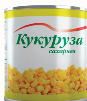
КУКУРУЗА САХАРНАЯ, 340 ГР