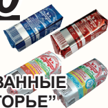
СЫРКИ ГЛАЗИРОВАННЫЕ "СВИТЛОГОРЬЕ" В АССОРТИМЕНТЕ, 50 ГР