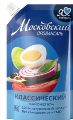
МАЙОНЕЗ "МОСКОВСКИЙ ПРОВАНСАЛЬ" КЛАССИЧЕСКИЙ, 67%, 420 МЛ