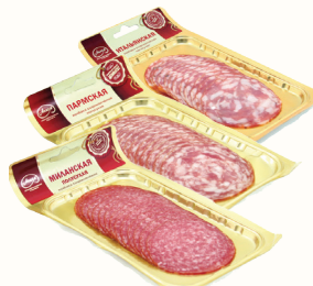
КОЛБАСА С/К В АССОРТИМЕНТЕ АНКОН, 100 ГР