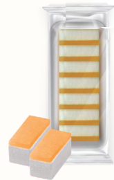
ПАСТИЛА ДВУХСЛОЙНАЯ, 200 ГР