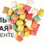
КАРАМЕЛЬ ЖЕЛЕЙНАЯ В АССОРТИМЕНТЕ, 1 КГ