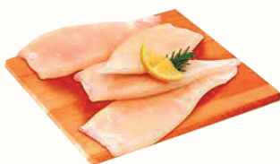
КАЛЬМАР (ТУШКА) С/М, 1 КГ