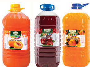
НАПИТОК НЕГАЗИРОВАННЫЙ СОКОСодержащий В АССОРТИМЕНТЕ, 3 Л