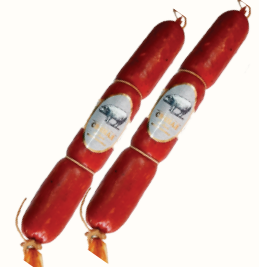
КОЛБАСА "СВИНАЯ" П/К СОВАД, 250 ГР