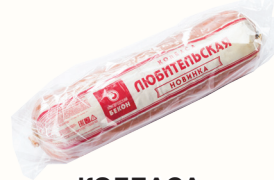
КОЛБАСА "ЛЮБИТЕЛЬСКАЯ" НОВИНКА ВАР., ВНМД, 1 КГ Продажа только на Косыгина, 21