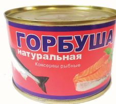
ГОРБУША НАТУРАЛЬНАЯ, 245ГР