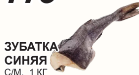
ЗУБАТКА СИНЯЯ С/М, 1 КГ