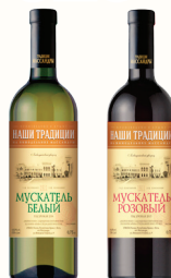
ЛИКЕРНОЕ ВИНО "МУСКАТЕЛЬ" БЕЛЫЙ, РОЗОВЫЙ 16%, 0,75 Л