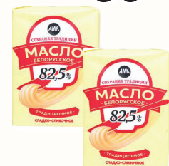
МАСЛО "СОХРАНЯЯ ТРАДИЦИИ" СЛАДКО-СЛИВОЧНОЕ 82,5%, 180 ГР