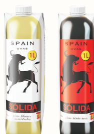
ВИНО СТОЛОВОЕ "СОЛИДА ТРАДИСИОН" В АССОРТИМЕНТЕ, 1 Л