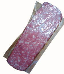
СЕРВЕЛАТ "ШВЕЙЦАРСКИЙ" В/К ФК ЛАДОГА, 1 КГ