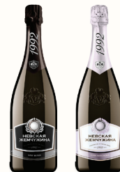
ВИНО ИГРИСТОЕ "НЕВСКАЯ ЖЕМЧУЖИНА" В АССОРТИМЕНТЕ, 0,75 Л