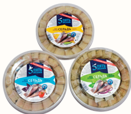
СЕЛЬДЬ ФИЛЕ КУСОЧКИ "5 ОКЕАНОВ" В АССОРТИМЕНТЕ, 350 ГР