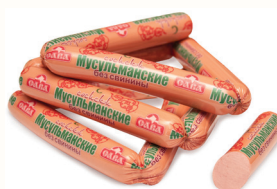
СОСИСКИ "МУСУЛЬМАНСКИЕ" ОХЛ., САВА, 1 КГ