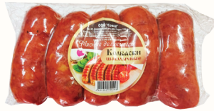
КОЛБАСКИ "ШАШЛЫЧНЫЕ" П/К, СОВАД, 350 ГР