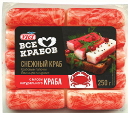
КРАБОВЫЕ ПАЛОЧКИ ОХЛ. С МЯСОМ НАТ. КРАБА "ВИЧИ", 250 ГР