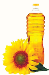
МАСЛО ПОДСОЛНЕЧНОЕ, 800 МЛ