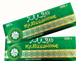
СПРЕД "ХАЛАЛЬ ТРАДИЦИОННОЕ" РАСТИТЕЛЬНО-ЖИРОВОЙ 82%, 500 ГР