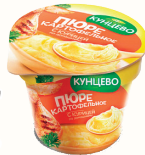
ПОРЕ "КУНЦЕВО" СО ВКУСОМ КУРИЦЫ, 40 ГР