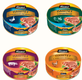
ПАШТЕТ "ХАМЕ" В АССОРТИМЕНТЕ, 250 ГР