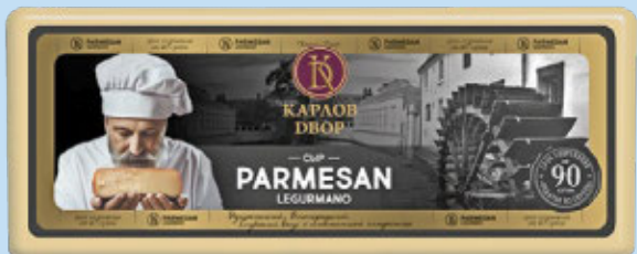
Сыр ПАРМЕЗАН, Браво (Карлов двор), 100 г