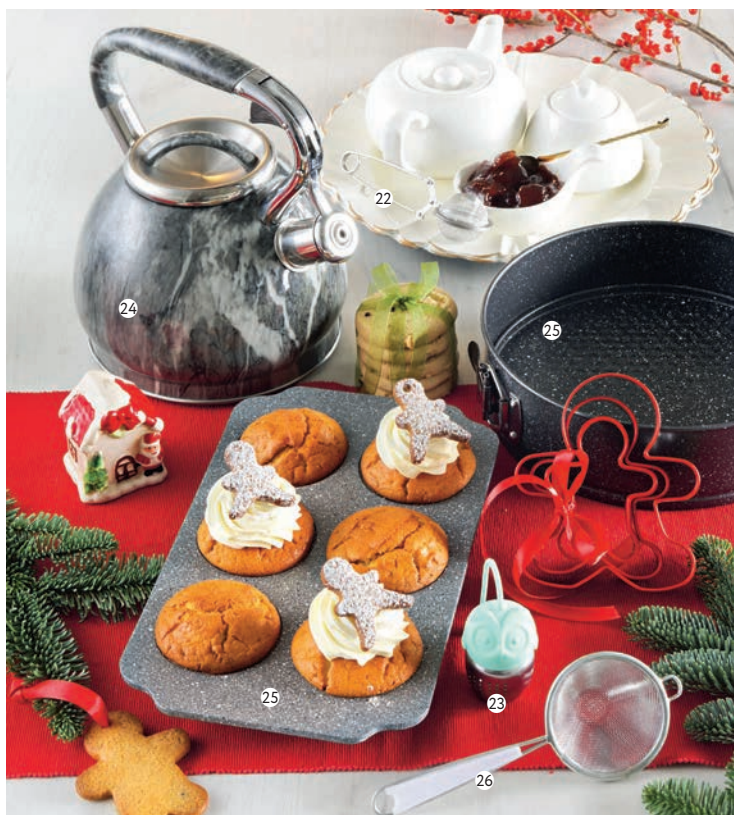
22. Ситечко-щипцы для заваривания чая Atmosphere – 129.99/79.99 23. Ситечко для чая Совушка – 199.99/139.99 24. Чайник Marble, нержавеющая сталь, 3 л – 2499.00/1499.00 25. Форма металлическая Loft, для выпечки** – от 499.00/от 249.00 26. Сито с пластиковой ручкой Basic Atmosphere, 7-20 см** – от 84.99/от 49.99

WWW.OKMARKET.RU | Цены действительны с 10 декабря 2020 года по 1 января 2021 года в гипермаркетах О'КЕЙ. Старые цены, указанные в каталоге, в разных магазинах сети О'КЕЙ могут незначительно отличаться. Отдельные товары могут быть представлены не во всех гипермаркетах «О'КЕЙ». О наличии товаров узнавайте в магазинах.