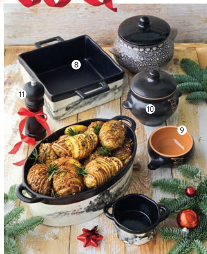
8. Форма керамическая Kargara** – от 299.00/от 149.99 9. Кокотница, 0,18 л – 169.99/109.99 10. Горшочек для жаркого с ручками, 0,5/0,95 л – от 199.99/от 149.99 11. Перцемолка Premium, с керамическим ножом, 15 см – 399.00/299.00