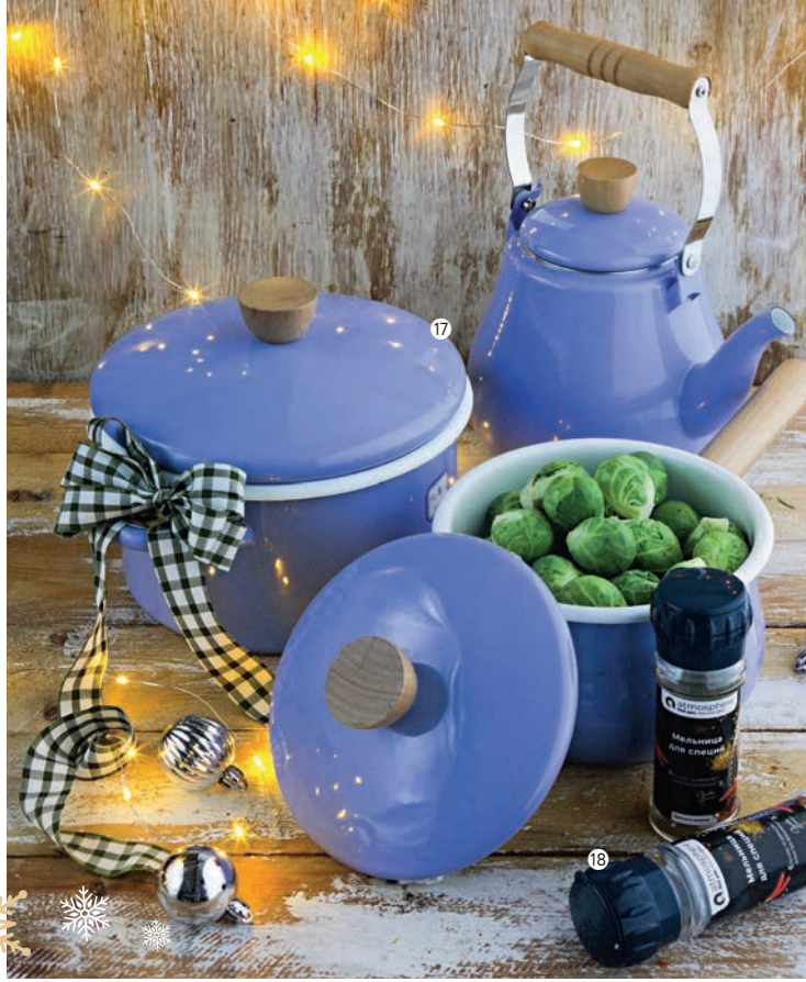
17. Ковш Maritime, эмаль, 1 л – 1099.00/699.00, Кастрюля , 2,1-6,2 л** – от 1699.00/от 1099.00, Чайник , 3 л – 1699.00/1099.00 18. Мельница для специй Atmosphere Store, стекло – 149.99/109.99