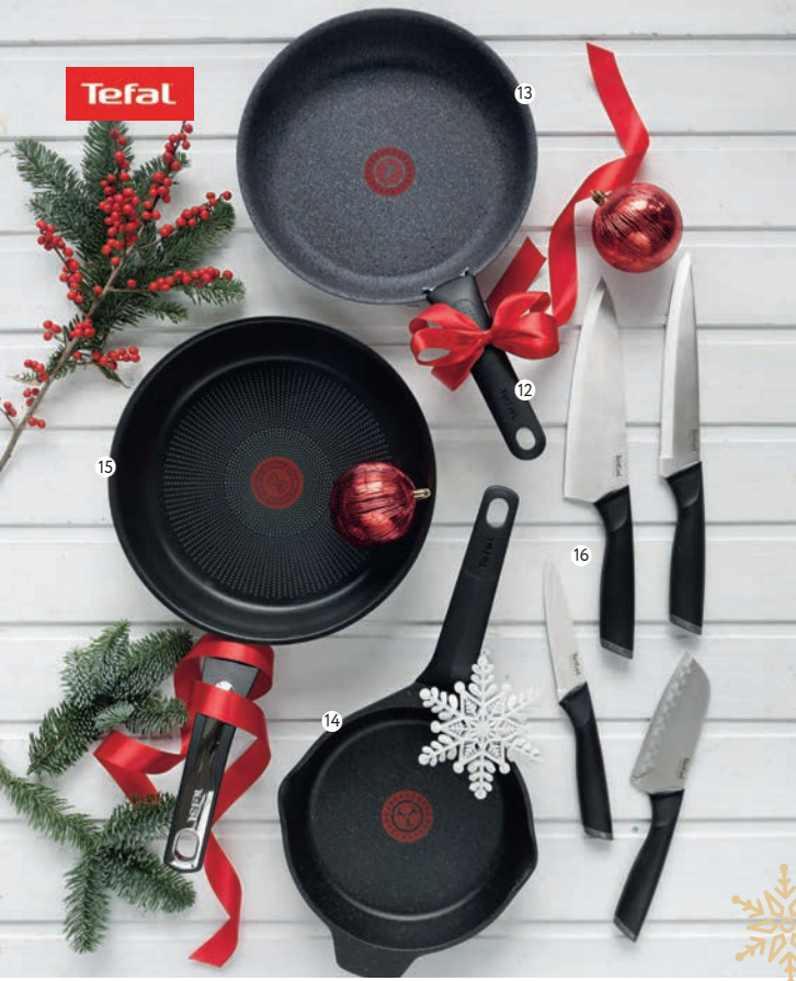
12. Ручка съемная Tefal Ingenio – 1699.00/1499.00 13. Ковш Ingenio, 16 см – 2799.00/1499.0, Сковорода , 24/28 см** – от 3299.00/от 1799.00 14. Сковорода Inspiration, 20-28 см** – от 2299.00/от 1299.00 15. Сковорода Emotion, 24-28 см** – от 2999.00/от 1599.00 16. Нож Comfort, 9-20 см** – от 799.00/от 399.00