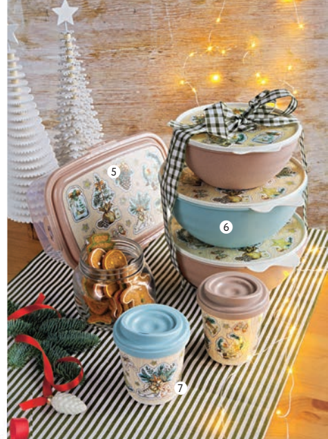
5. Контейнер для продуктов, с декором, 1,55 л – 129.99/89.99, 3 л – 179.99/119.99, 3,6 л – 199.99/129.99, 4,8 л – 229.00/159.99, 6. Миска пластиковая, с крышкой, 1,55 л – 199.99/129.99, 2,8 л – 219.00/149.99, 3,7 л – 249.00/179.99 7. Термостакан пластиковый, 300 мл – 199.99/129.99