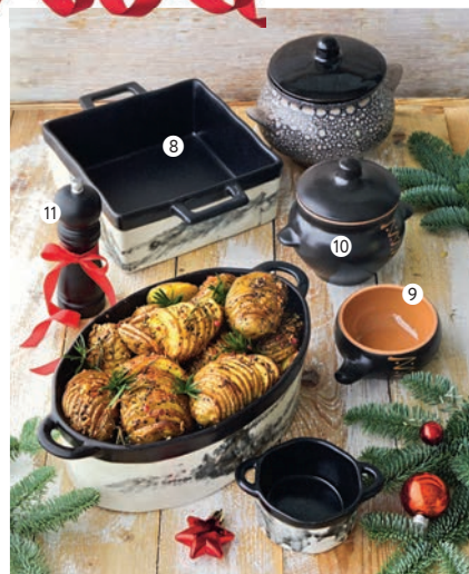
8. Форма керамическая Kargara** – от 299.00/от 149.99 9. Кокотница, 0,18 л – 169.99/109.99 10. Горшочек для жаркого с ручками, 0,5/0,95 л – от 199.99/от 149.99 11. Перцемолка Premium, с керамическим ножом, 15 см – 399.00/299.00