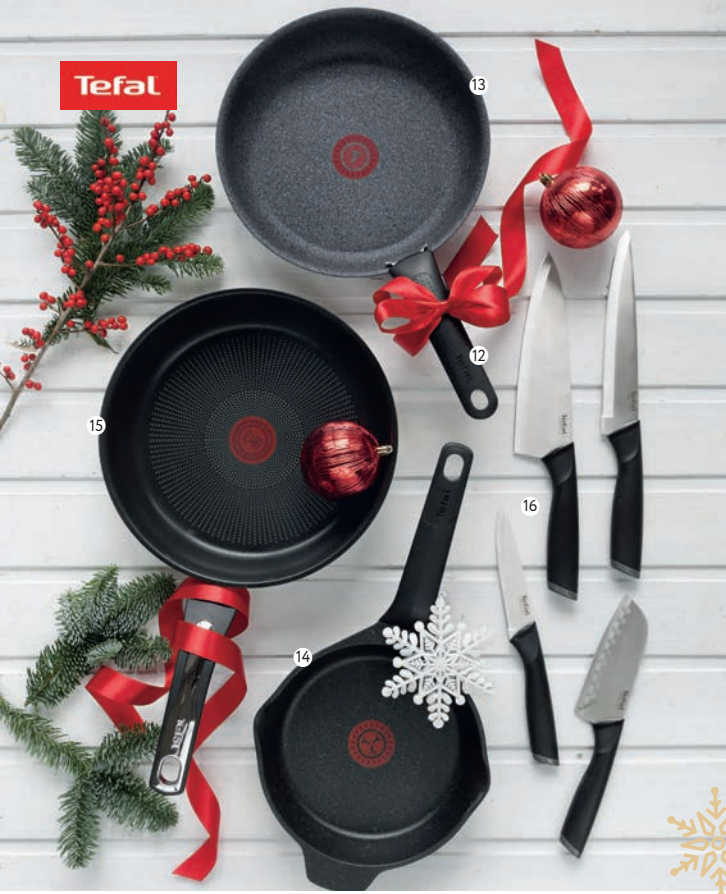
12. Ручка съемная Tefal Ingenio – 1699.00/1499.00 13. Ковш Ingenio, 16 см – 2799.00/1499.0, Сковорода , 24/28 см** – от 3299.00/от 1799.00 14. Сковорода Inspiration, 20-28 см** – от 2299.00/от 1299.00 15. Сковорода Emotion, 24-28 см** – от 2999.00/от 1599.00 16. Нож Comfort, 9-20 см** – от 799.00/от 399.00