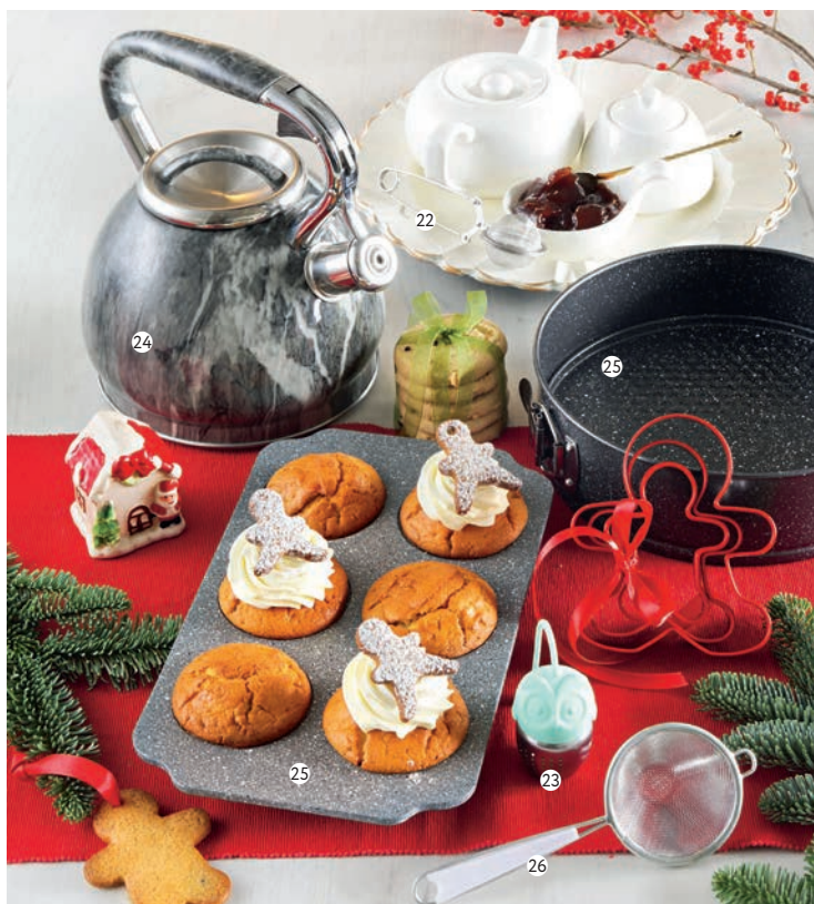
22. Ситечко-щипцы для заваривания чая Atmosphere – 129.99/79.99 23. Ситечко для чая Совушка – 199.99/139.99 24. Чайник Marble, нержавеющая сталь, 3 л – 2499.00/1499.00 25. Форма металлическая Loft, для выпечки** – от 499.00/от 249.00 26. Сито с пластиковой ручкой Basic Atmosphere, 7-20 см** – от 84.99/от 49.99

WWW.OKMARKET.RU | Цены действительны с 10 декабря 2020 года по 1 января 2021 года в гипермаркетах О'КЕЙ. Старые цены, указанные в каталоге, в разных магазинах сети О'КЕЙ могут незначительно отличаться. Отдельные товары могут быть представлены не во всех гипермаркетах «О'КЕЙ». О наличии товаров узнавайте в магазинах.