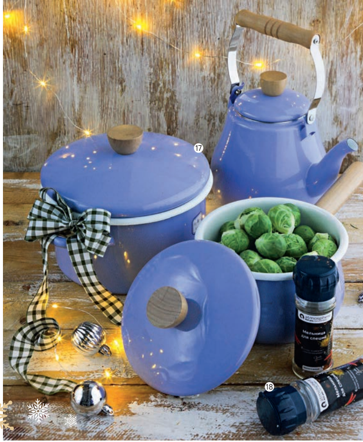
17. Ковш Maritime, эмаль, 1 л – 1099.00/699.00, Кастрюля , 2,1-6,2 л** – от 1699.00/от 1099.00, Чайник , 3 л – 1699.00/1099.00 18. Мельница для специй Atmosphere Store, стекло – 149.99/109.99