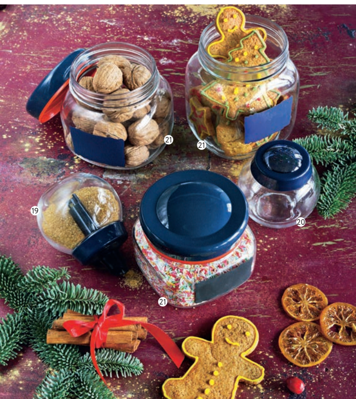
19. Сахарница стеклянная Store, 250 мл – 129.99/79.99 20. Емкость для специй, 250 мл – 129.99/79.99 21. Банка для продуктов Store, 0,5-1 л** – от 249.00/от 159.99