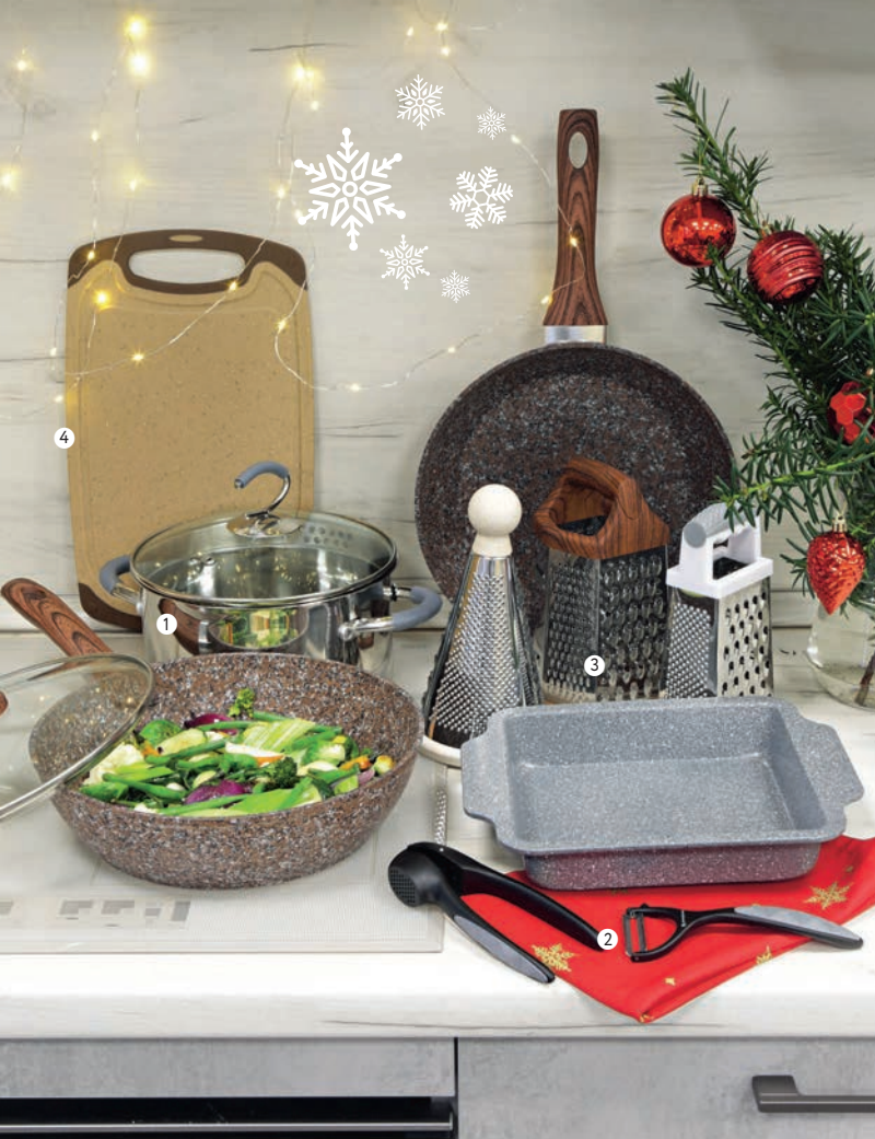
1. Кастриюла с крышкой Grey Swan, 2-5 л** – от 1699.00/от 999.00 2. Кухонные инструменты Crystal** – от 279.00/от 179.99 3. Терка Stone – 199.99/129.99, Терка Grano Soft – 299.00/199.99, Терка Wood – 399.00/249.00 4. Доска разделочная Vermont** – от 299.00/от 199.99