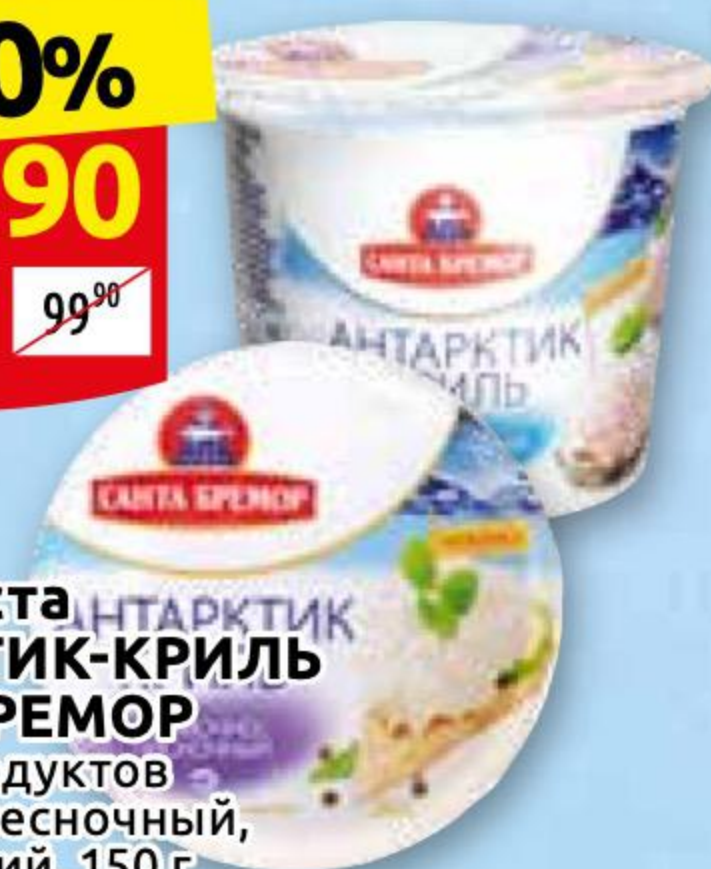
Крем-паста АНТАРКТИК-КРИЛЬ САНТА БРЕМОР из морепродуктов сливочно-чесночный, классический, 150 г