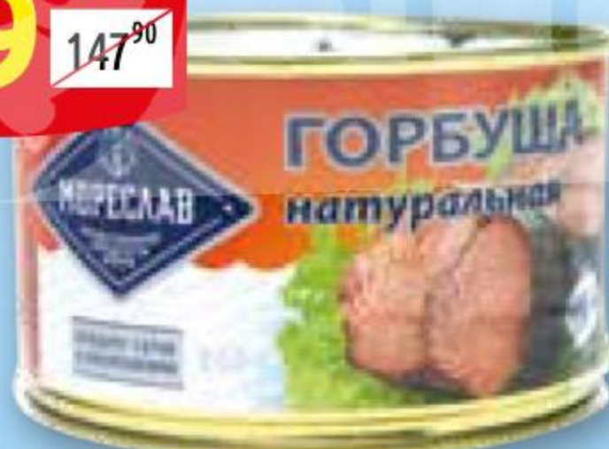
Горбуша натуральная МОРЕСЛАВ ж/б, 240 г