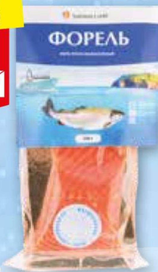
Форель АПРЕЛЬСКОЕ филе-кусок, с/с, 200 г