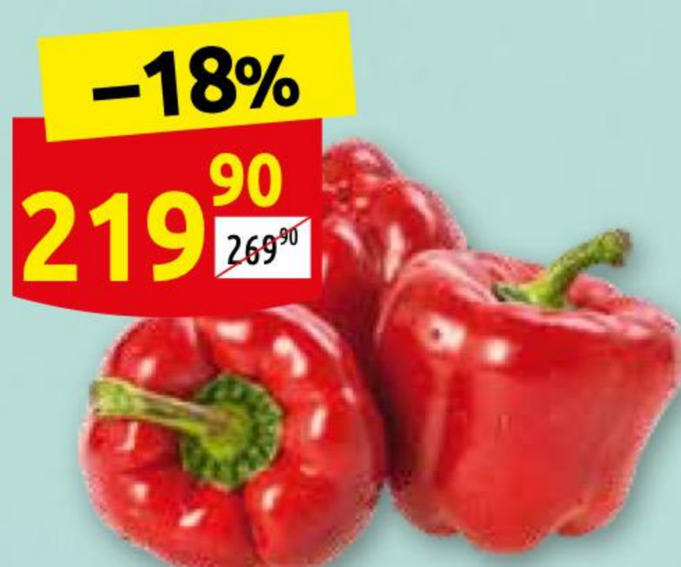
Перец красный 1 кг