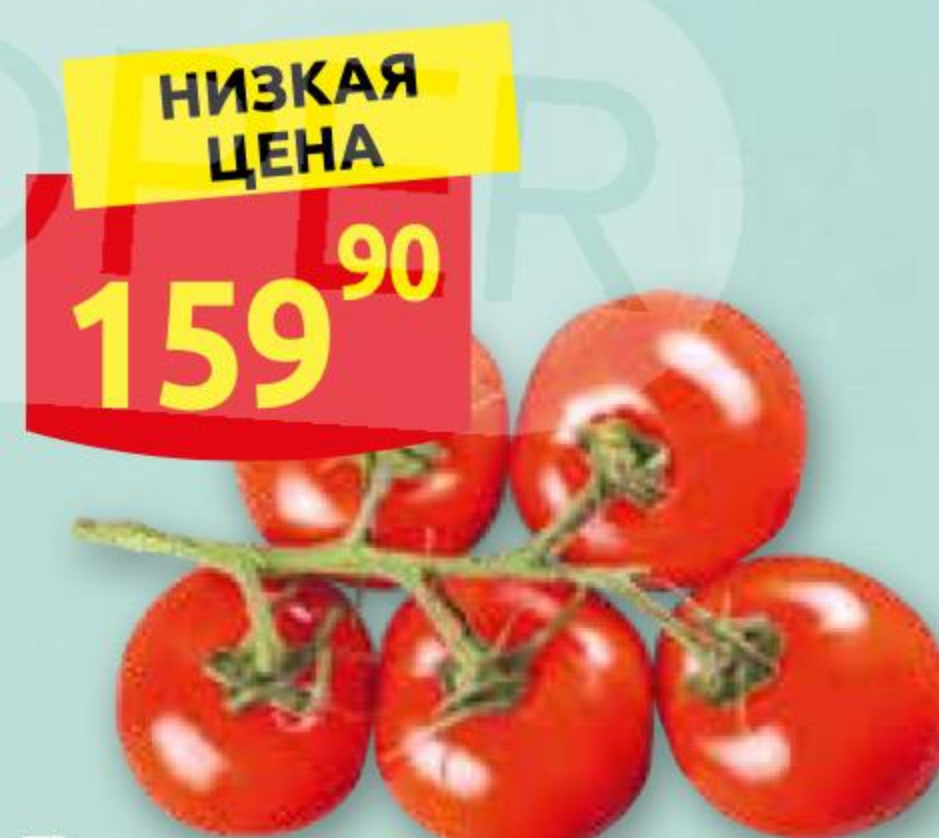
Томаты на ветке 1 кг