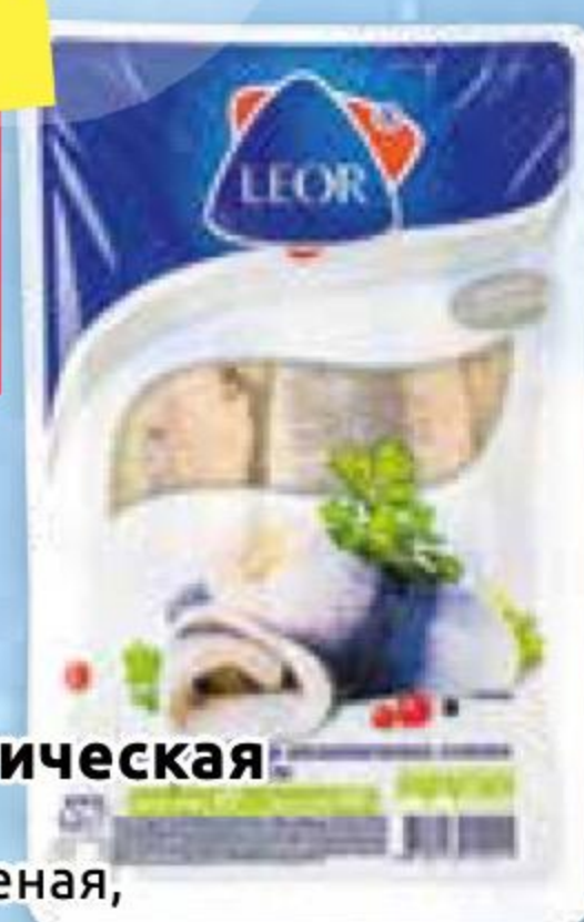
Сельдь атлантическая ЛЕОР филе в масле, соленая, в/у, 400 г