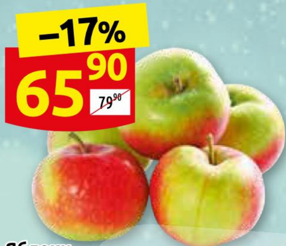
Яблоки 1 кг