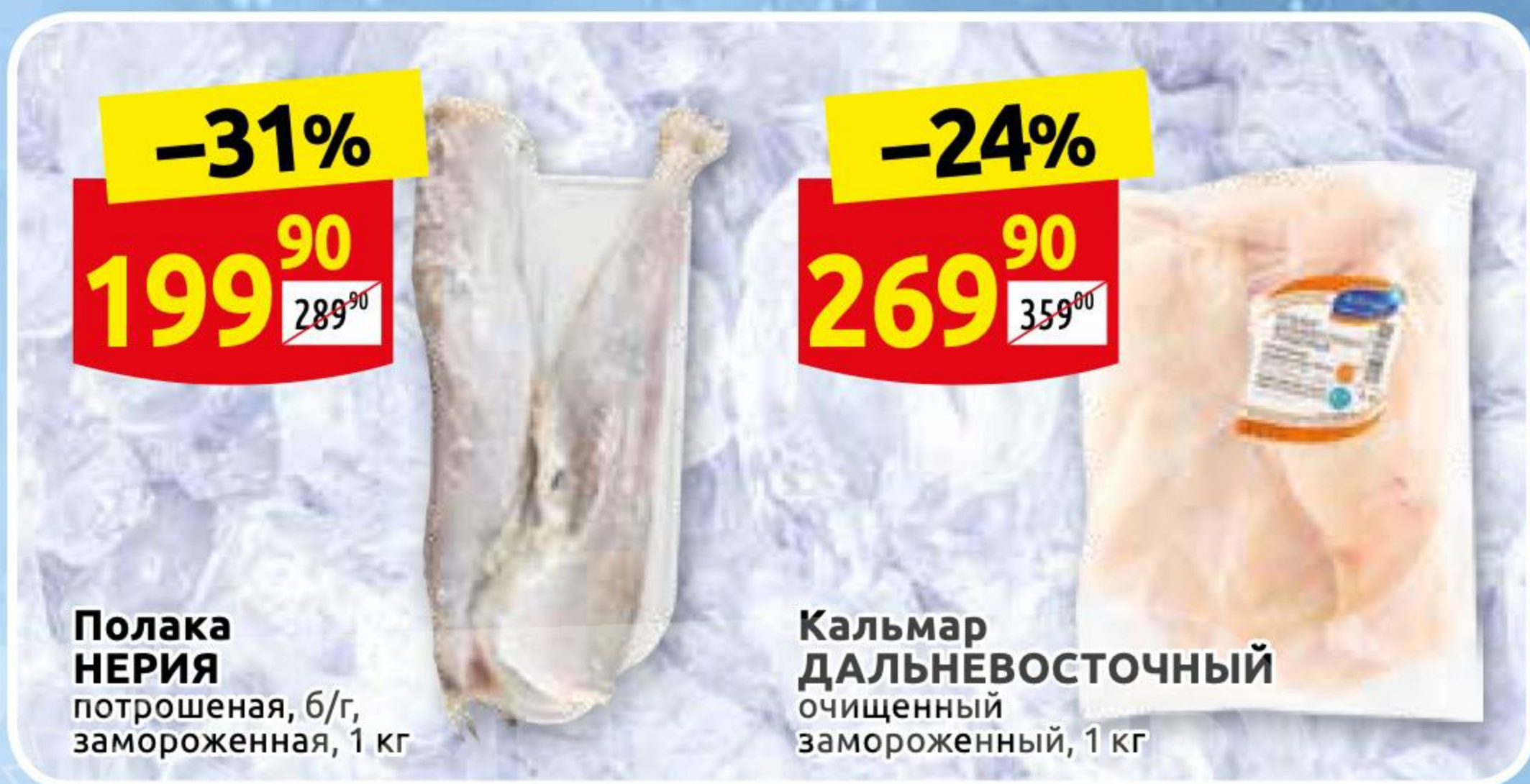
Полака НЕРИЯ потрошенная, б/г, замороженная, 1 кг