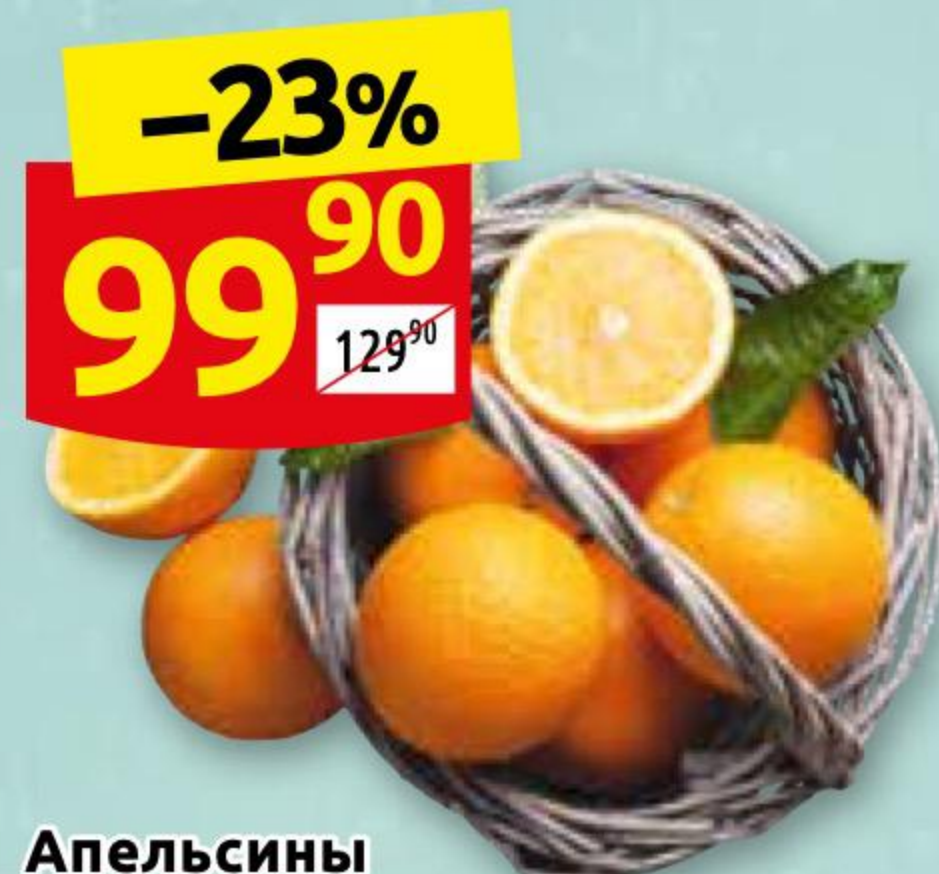
Апельсины 1 кг