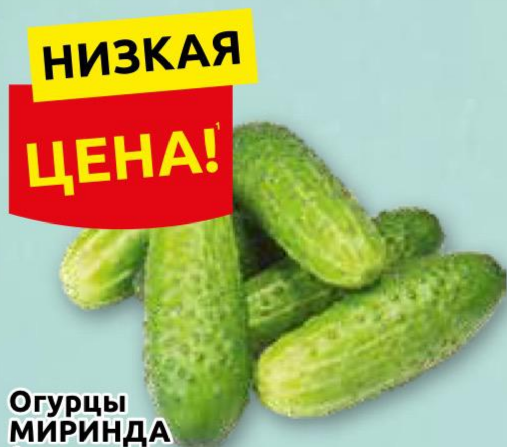
Огурцы МИРИНДА 1 кг