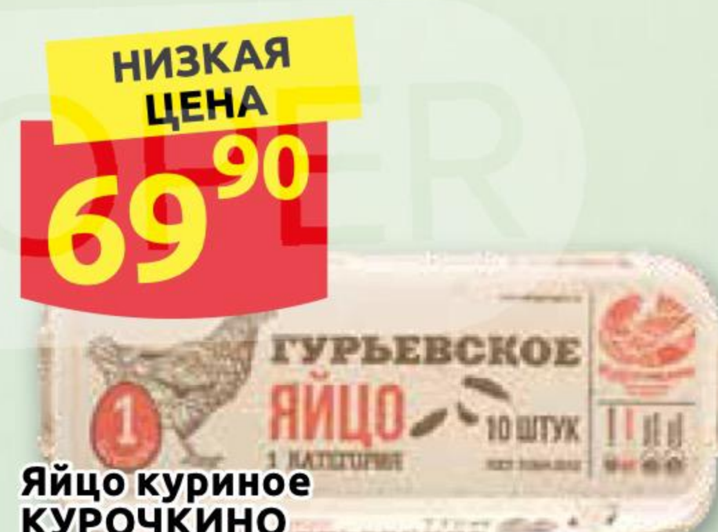
Яйцо куриное КУРОЧКИНО ПФ ГУРЬЕВСКАЯ столовое цветное 1 категория, 10 шт.