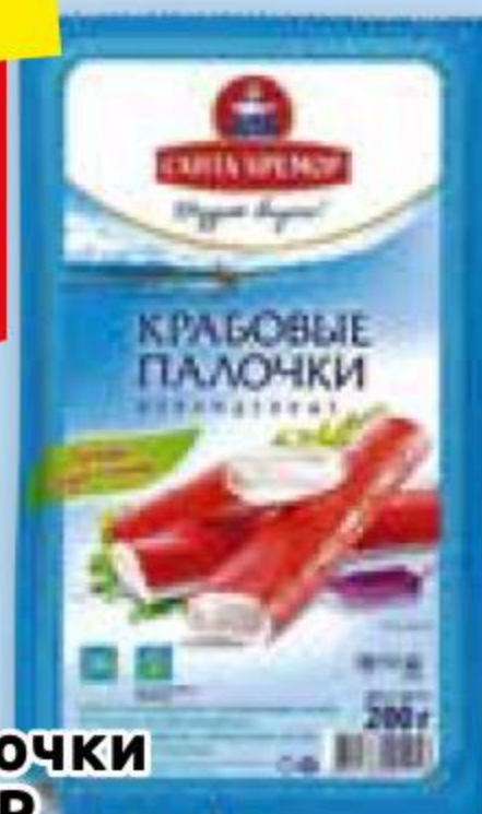
Крабовые палочки САНТА БРЕМОР охлажденные, в/у, 200 г