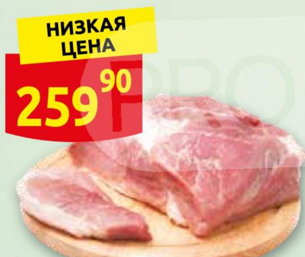
Окорок свиной б/к, охлажденный, в/у, 1 кг