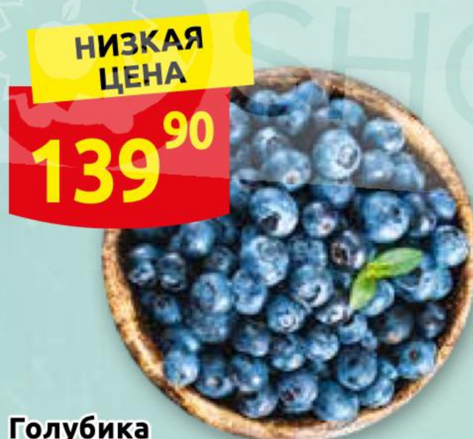
Голубика 1 уп.