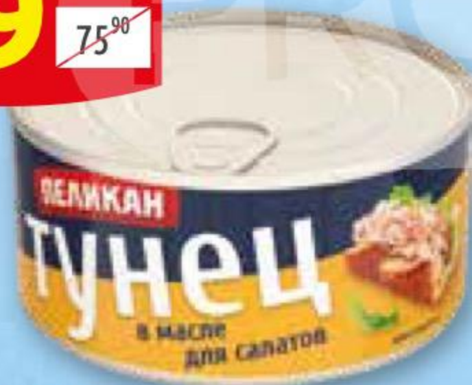
Тунец ПЕЛИКАН для салата в масле, ж/б, 185 г