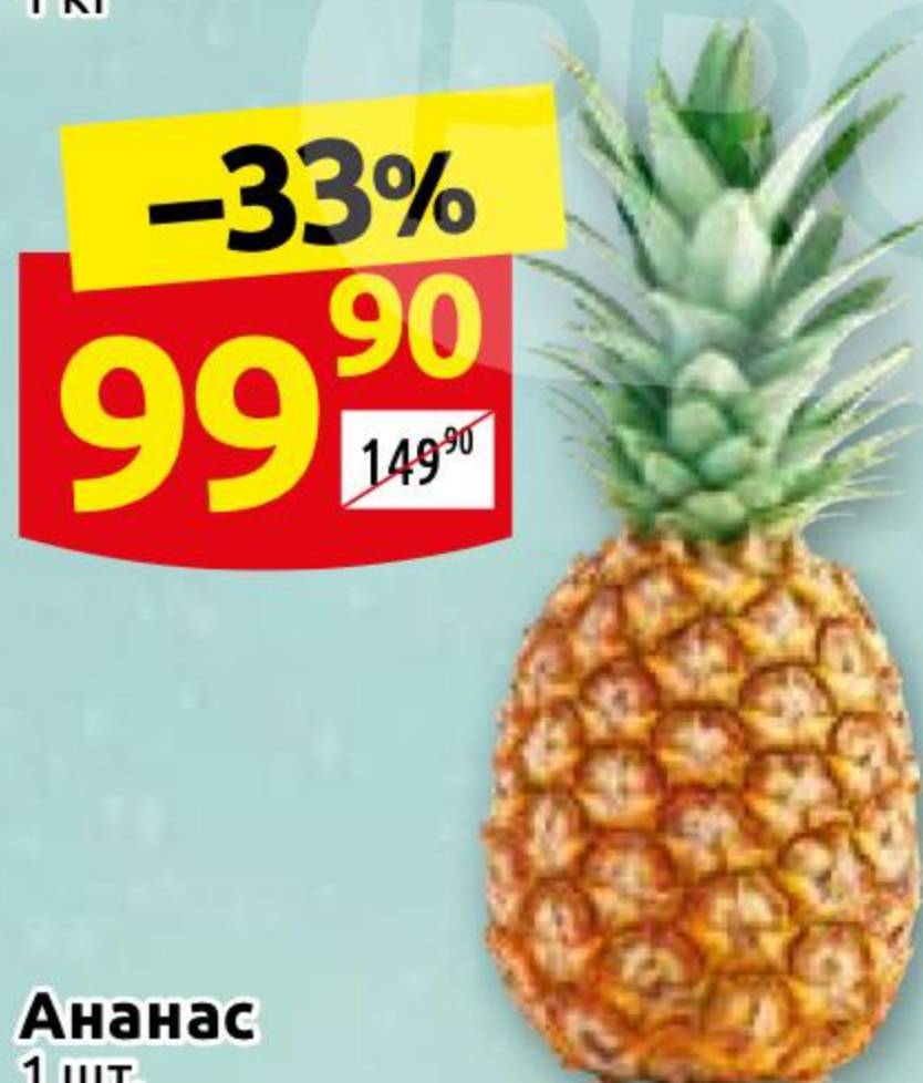
Ананас 1 шт.