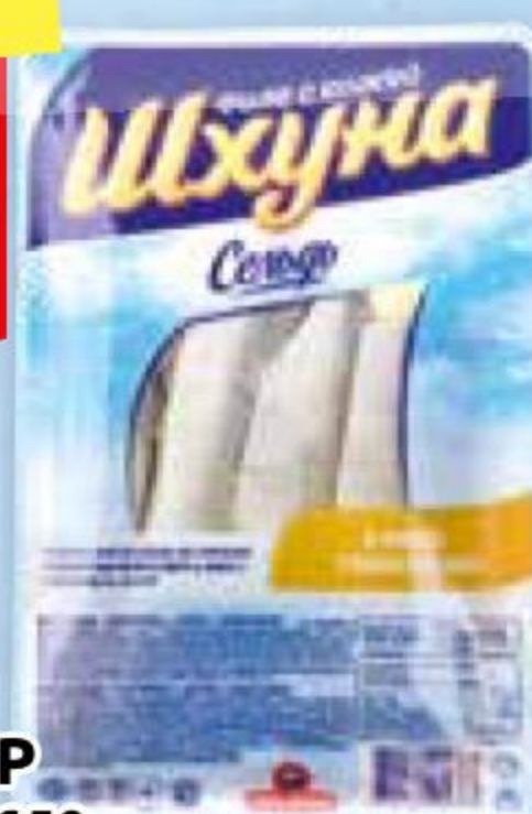
Сельдь ШХУНА САНТА БРЕМОР филе с кожей в масле, с/с, в/у, 240 г