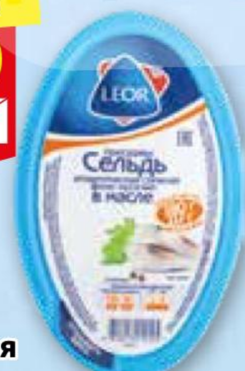
Сельдь атлантическая ЛЕОР филе-кусочки в масле, 180 г