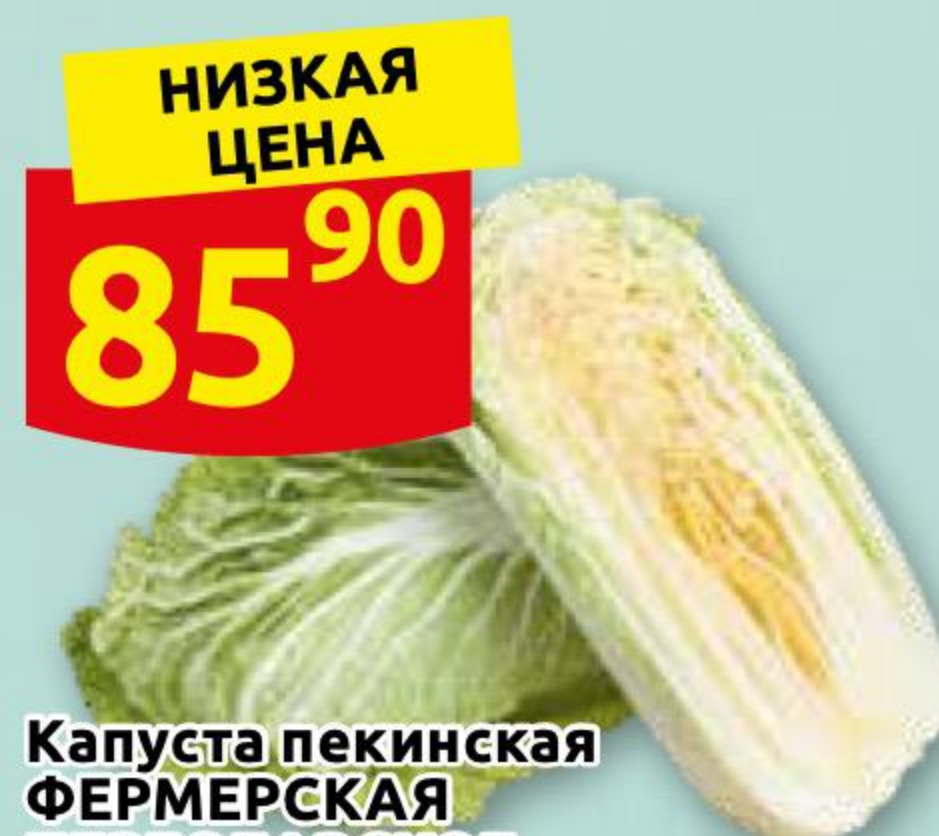
Капуста пекинская ФЕРМЕРСКАЯ ПЕРЕСЛАВСКОЕ 1 кг