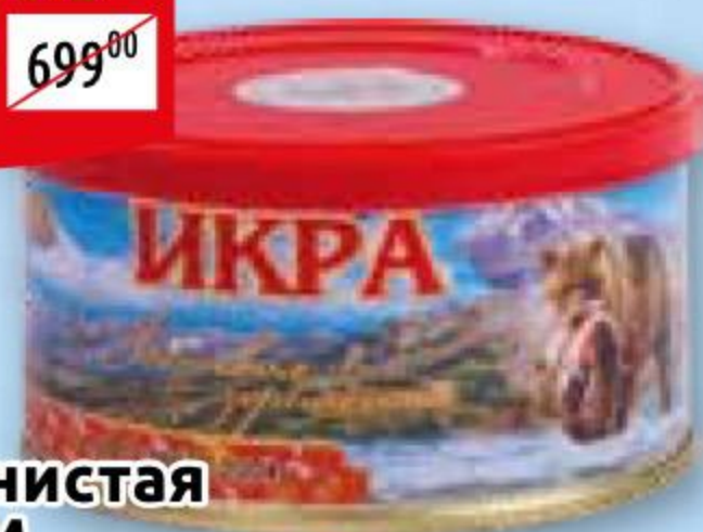
Икра зернистая ПРЕМИУМ АВИСТРОН лососевая, ГОСТ, ж/б, 130 г