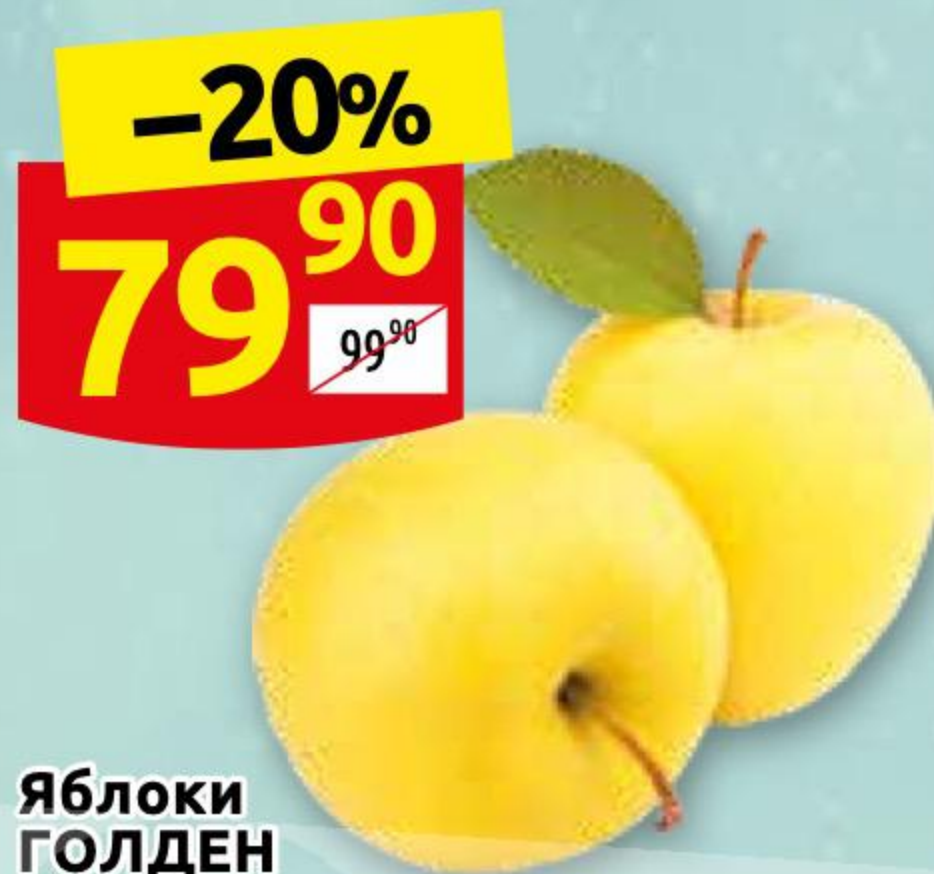
Яблоки ГОЛДЕН 1 кг