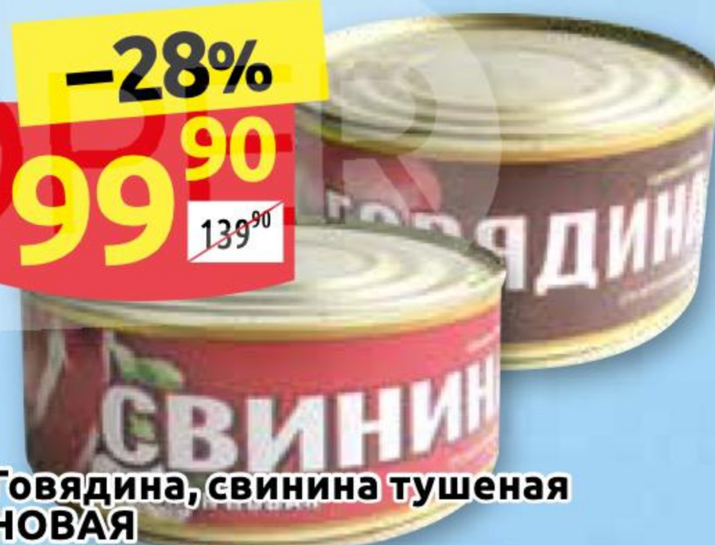
Говядина, свинина тушеная НОВАЯ УНИВЕРСАЛ ТРЕЙДИНГ-БАЛТИКА ж/б, 325 г