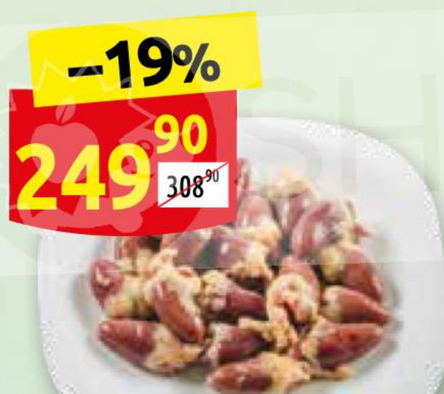
Сердце куриное БАЛТПТИЦПРОМ охлажденное, 1 кг