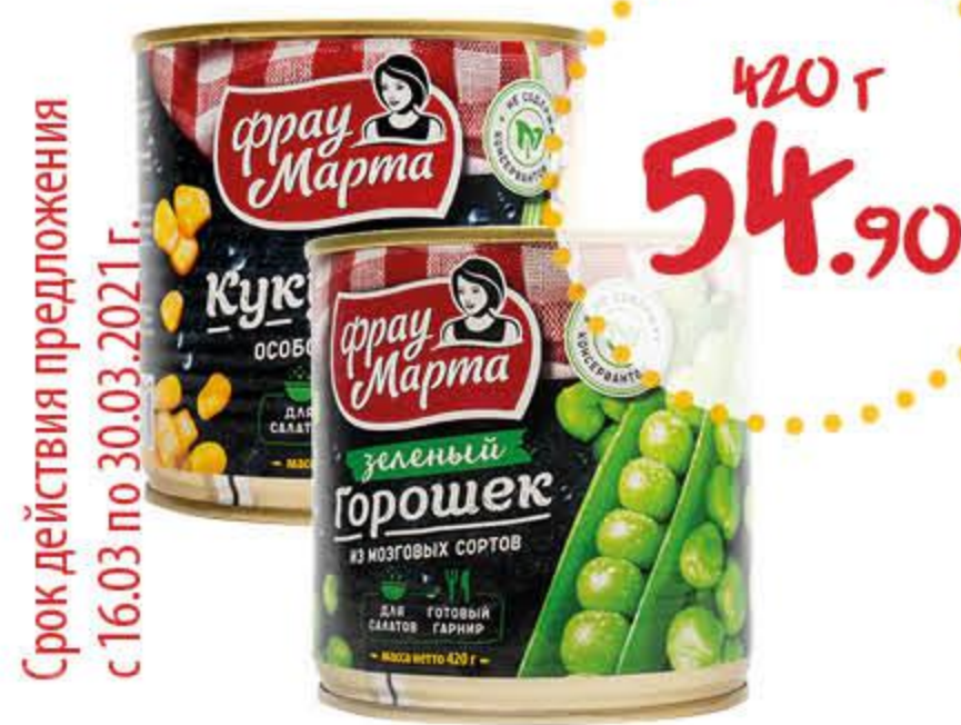
Горошек, кукуруза ФРАУ МАРТА ГОСТ