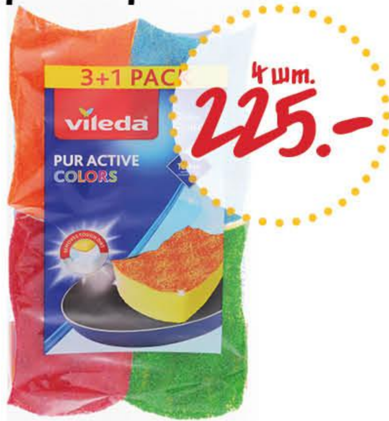
Губка кухонная ВИЛЕДА Пур Колорс