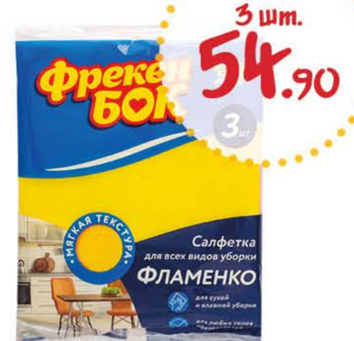
Салфетка для уборки ФРЕКЕН БОК Фламенко ВИСКОЗНАЯ