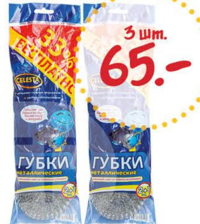
Губка СЕЛЕСТА металлическая