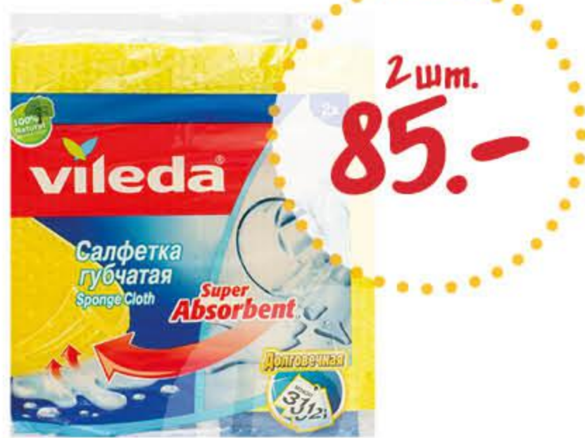
Салфетка ВИЛЕДА губчатая