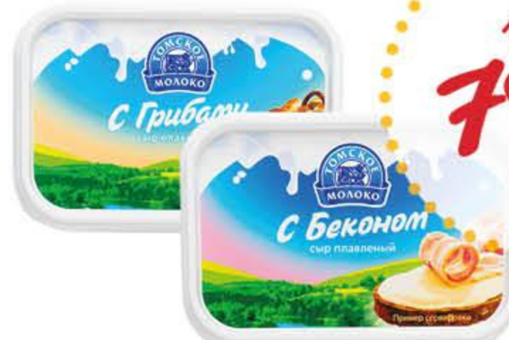
Сыр плавленый ТОМСКОЕ МОЛОКО сливочный, с беконом, с грибами бзмж 65%