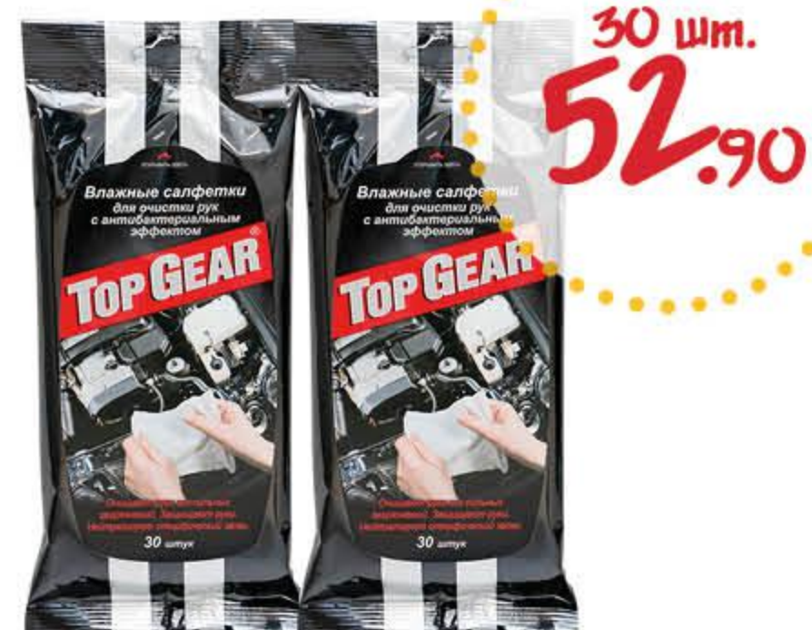
Салфетки влажные ТОП ГИР для рук антибактериальные