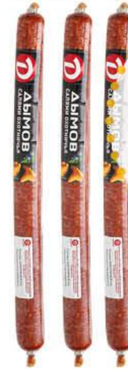
Салями ДЫМОВ ОХОТНИЧЬЯ полукопченая