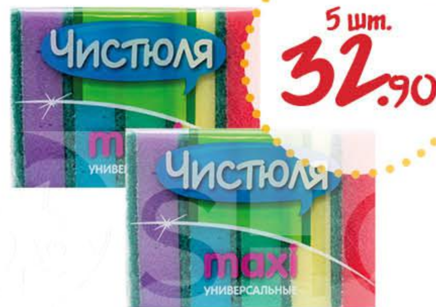
Губка хозяйственная ЧИСТЮЛЯ Макси