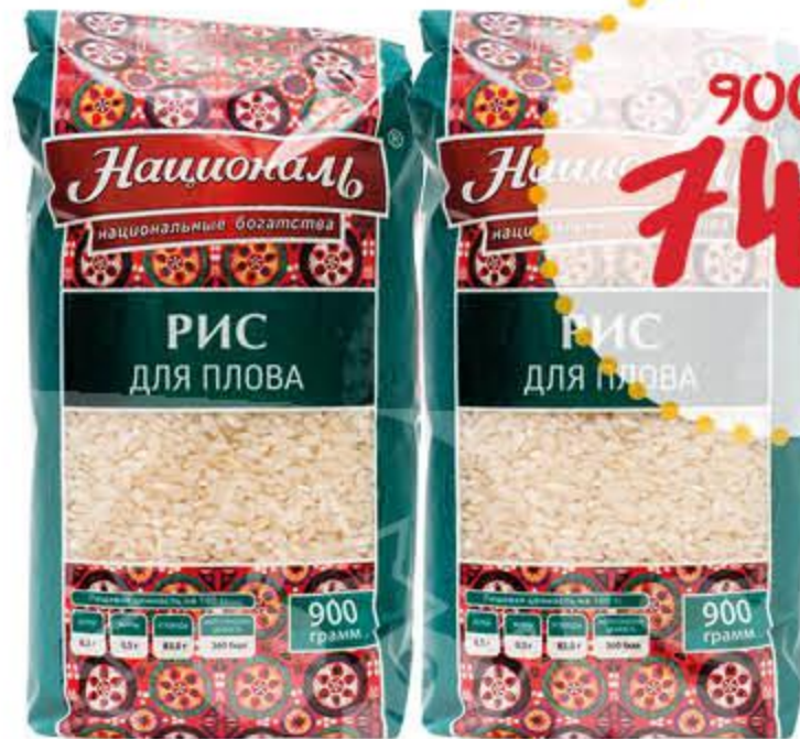
Рис НАЦИОНАЛЬ для плова