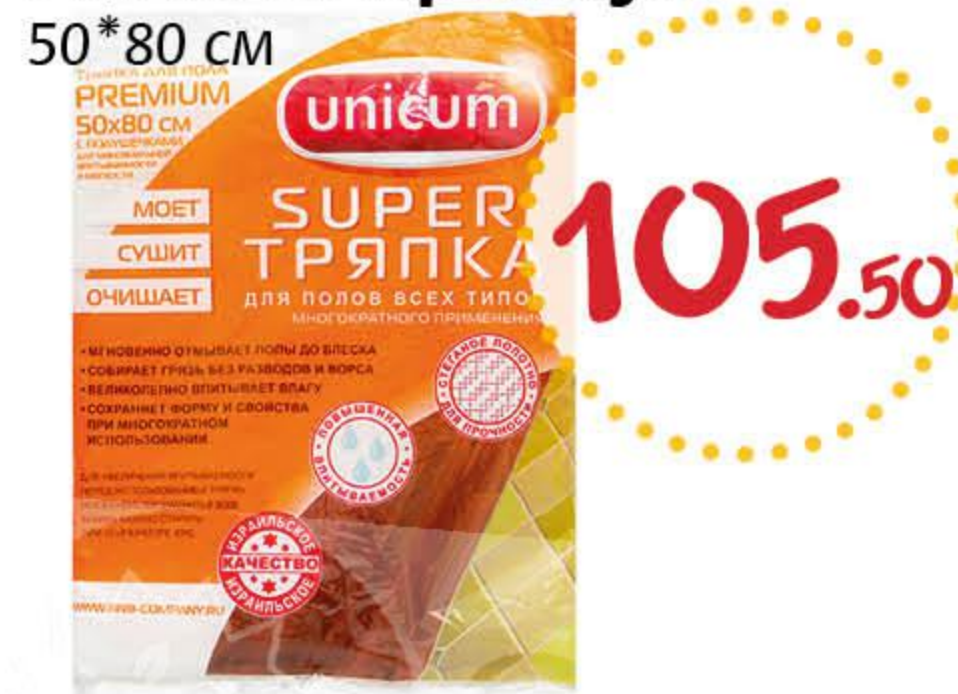
Тряпка для пола УНИКУМ Премиум