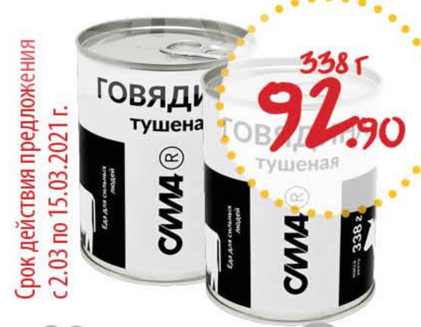
Говядина тушеная СИЛА высший сорт

Срок действия предложения с 2.03 по 15.03.2021 г.