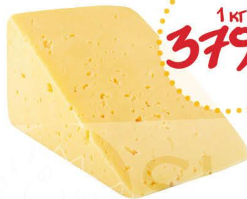
Сыр АЛТАЙСКИЕ ПРОДУКТЫ Российский бзмж 50%