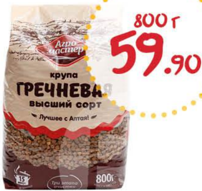
Гречневая крупа АГРОМАСТЕР