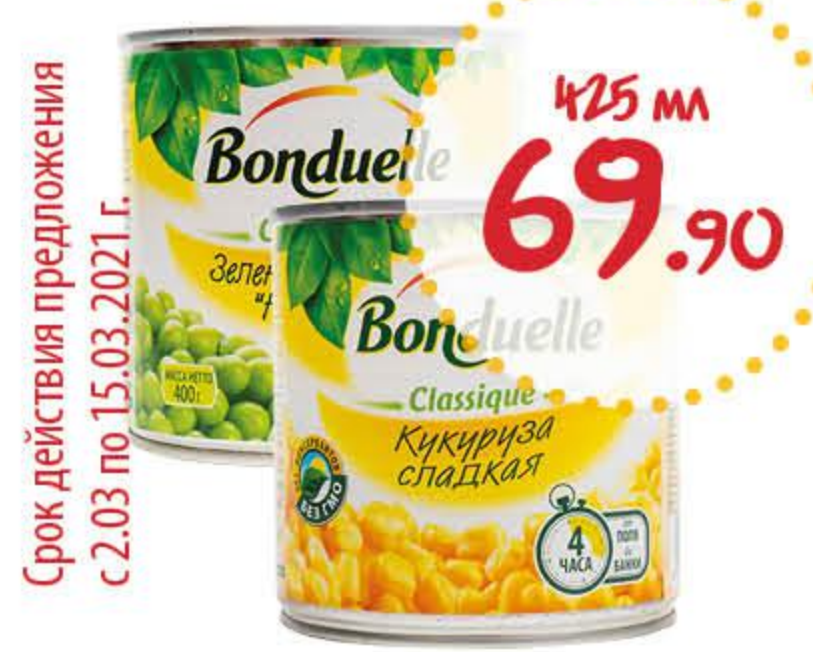
Горошек, Кукуруза БОНДЮЭЛЬ

Срок действия предложения с 16.03 по 30.03.2021 г.