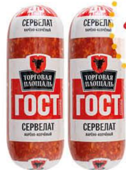
Сервелат ТОРГОВАЯ ПЛОЩАДЬ варено-копченый