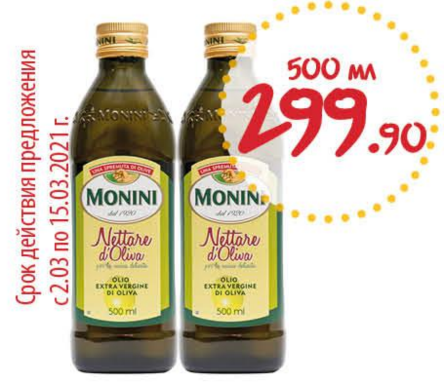
Масло оливковое МОНИНИ Неттаре экстра вирджин