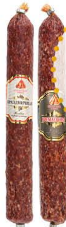
Колбаса СМП Кремлевская, Праздничная сырокопченая