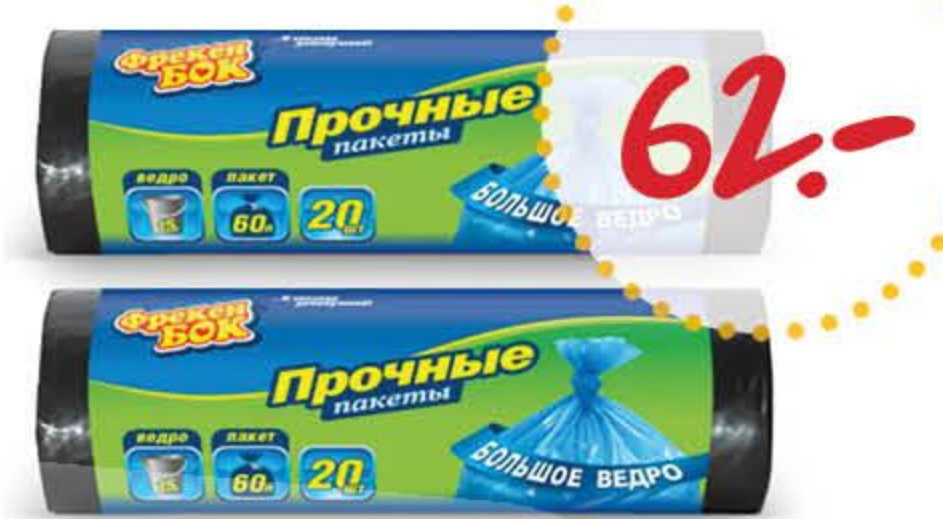
Пакеты для мусора ФРЕКЕН БОК прочные черные 60 л 20 шт.