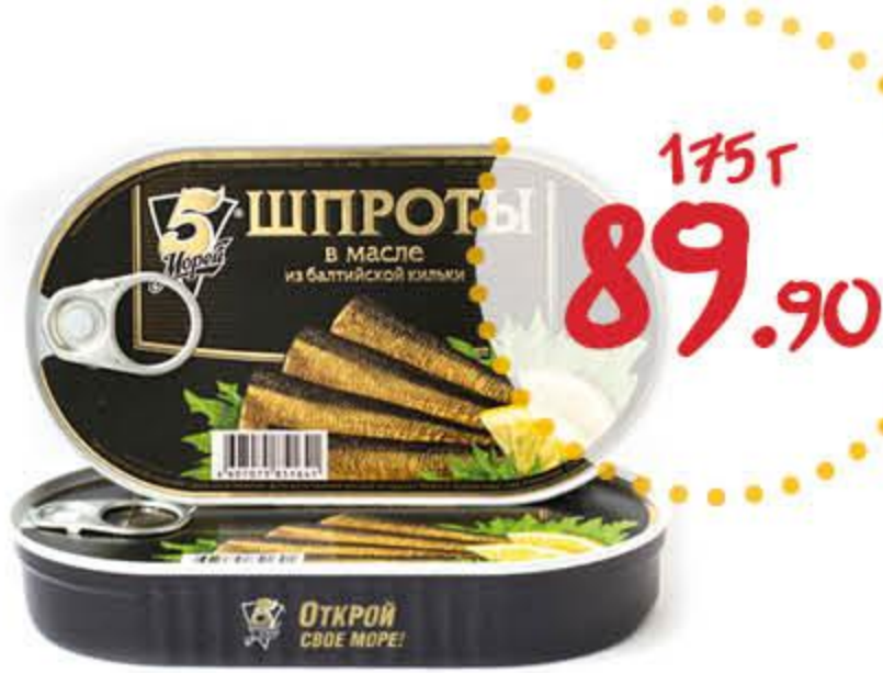
Шпроты 5 МОРЕЙ из балтийской кильки в масле

Срок действия предложения с 2.03 по 15.03.2021 г.