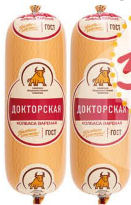
Колбаса СПК Докторская