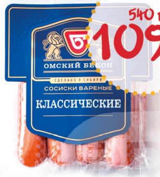
Сосиски ОМСКИЙ БЕКОН Классические