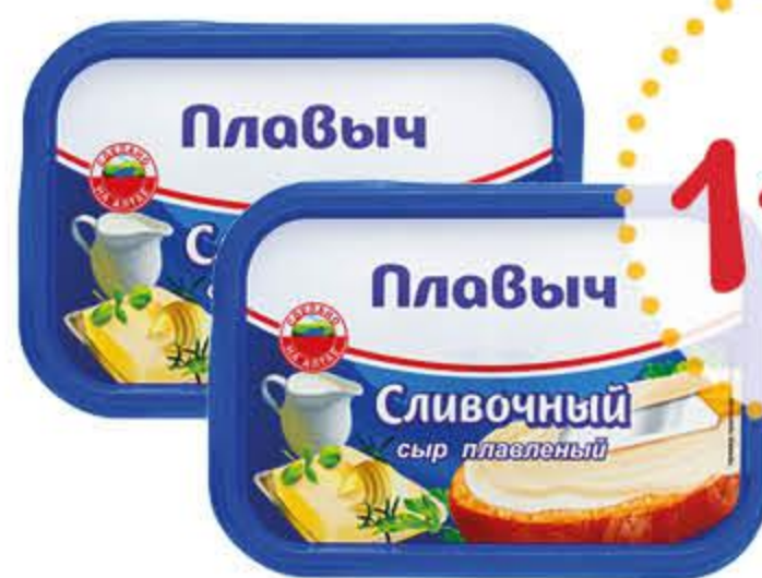
Сыр плавленый ПЛАВЫЧ сливочный бзмж 50% ванна