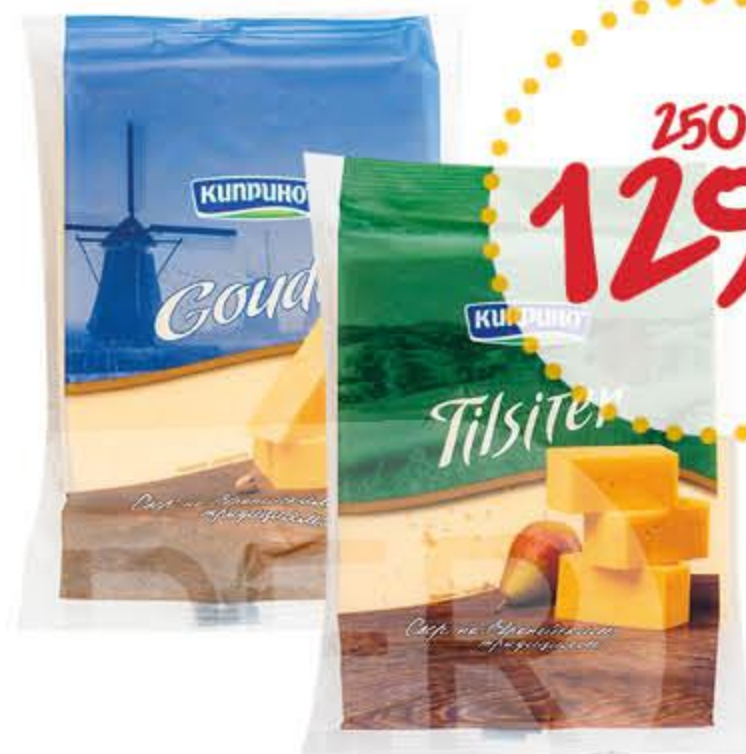
Сыр КИПРИНО Гауда, Тильзитер бзмж 45%