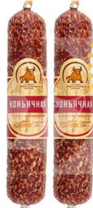
Колбаса СПК Коньячная сырокопченая