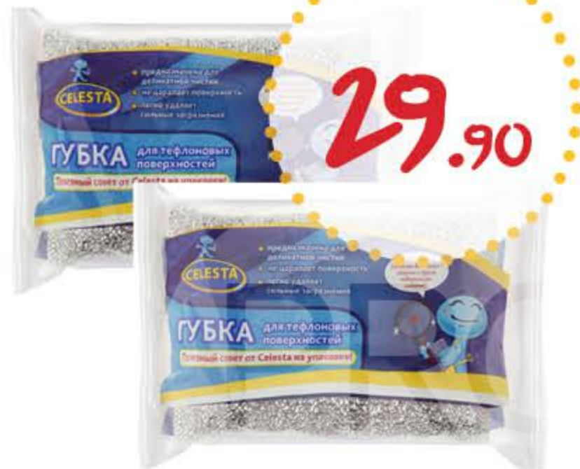
Губка для посуды СЕЛЕСТА для тефлоновых поверхностей