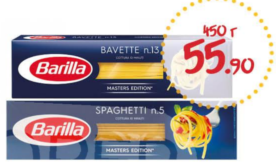
Макаронные изделия БАРИЛЛА баветте № 13, спагетти № 5