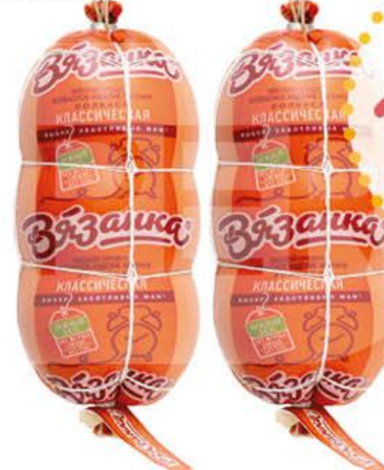
Колбаса СТАРОДВОРСКИЕ КОЛБАСЫ Вязанка классическая вареная