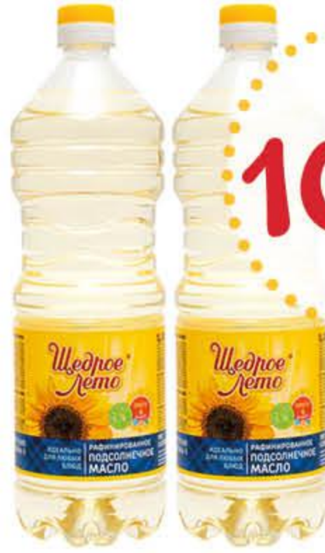
Масло подсолнечное ЩЕДРОЕ ЛЕТО рафинированное