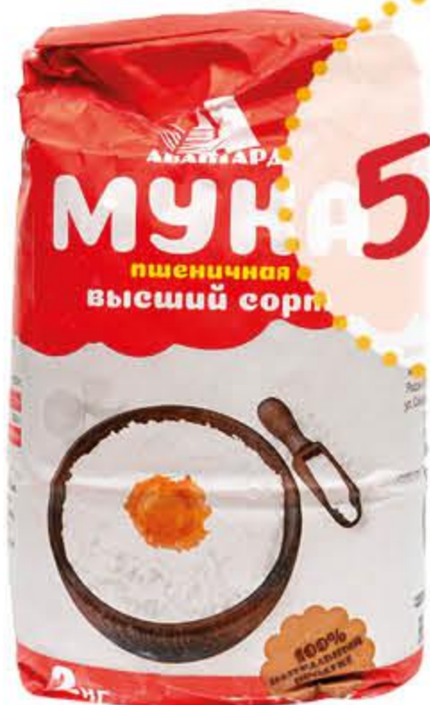
Мука АВАНГАРД пшеничная высший сорт