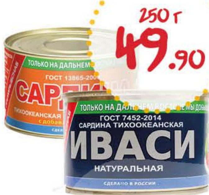
Сардина ПРИМРЫБСНАБ Иваси натуральная с добавлением масла

Срок действия предложения с 2.03 по 15.03.2021 г.