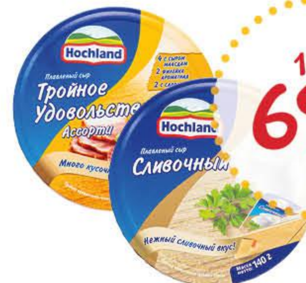
Сыр плавленый ХОХЛАНД в ассортименте бзмж 45%