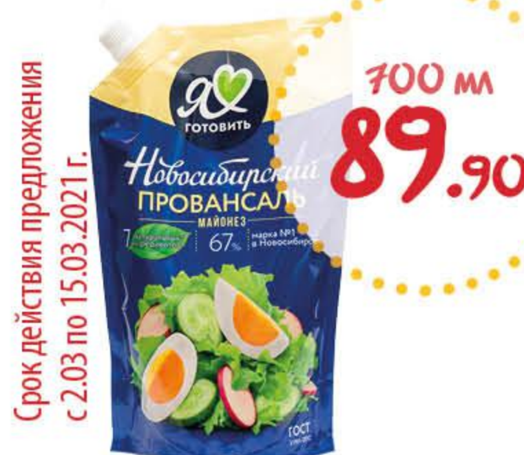
Майонез НОВОСИБИРСКИЙ ПРОВАНСАЛЬ 67%