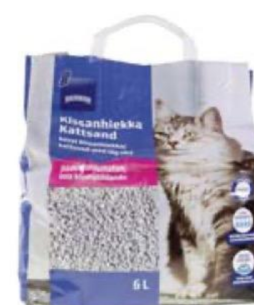
НАПОЛНИТЕЛЬ для кошачьего туалета, Rainbow, 6 л