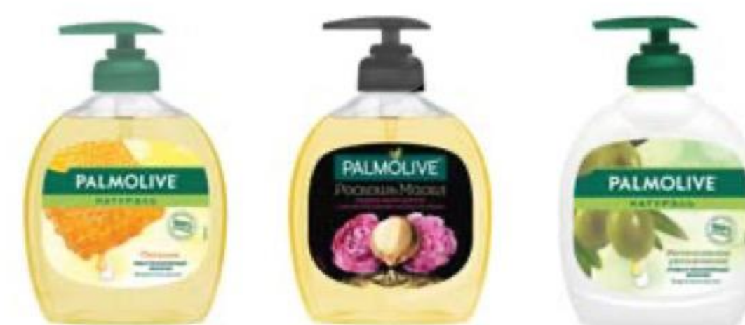
МЫЛО жидкое в ассортименте, Palmolive, 300 мл