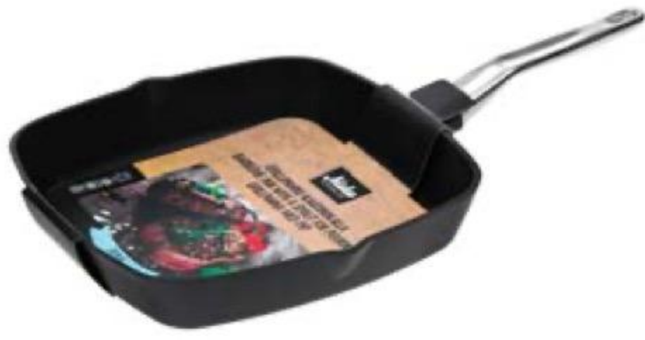
СКОВОРОДА-ГРИЛЬ 2999 00 с носиками, MaKu Kitchen Life 2249 00