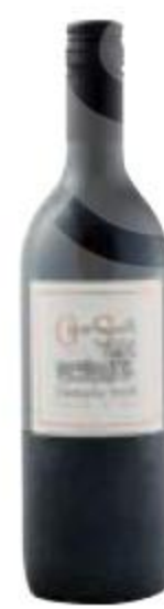
ВИНО Great South, красное, сухое, 13%, 0,75 л, Франция