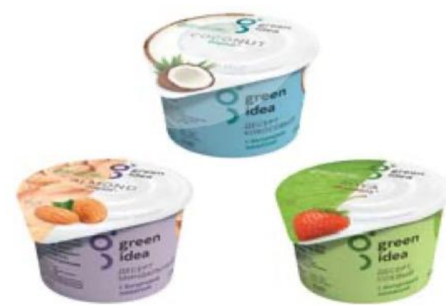
ДЕСЕРТ кокосовый/ миндальный/соевый в ассортименте, Green Idea, 140 г