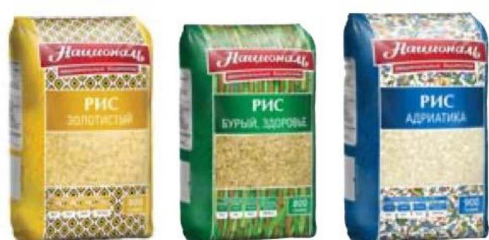
РИС в ассортименте, Националь, 900/800 г