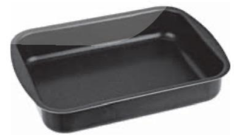
ФОРМА 1090 00 для лазаньи, House 799 90