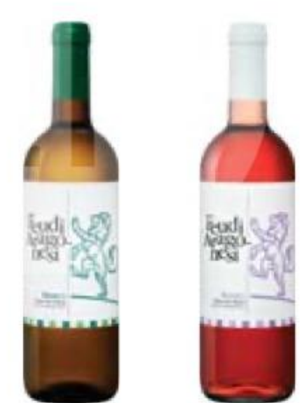
ВИНО Feudi Aragonesi, белое/ розовое, сухое, 12%, 0,75 л, Италия