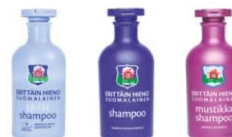
ШАМПУНЬ в ассортименте, Erittäin, 300 мл