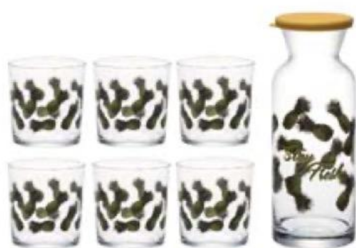
НАБОР 1890 00 Jungle, графин и стаканы, Stay Fresh 1399 00