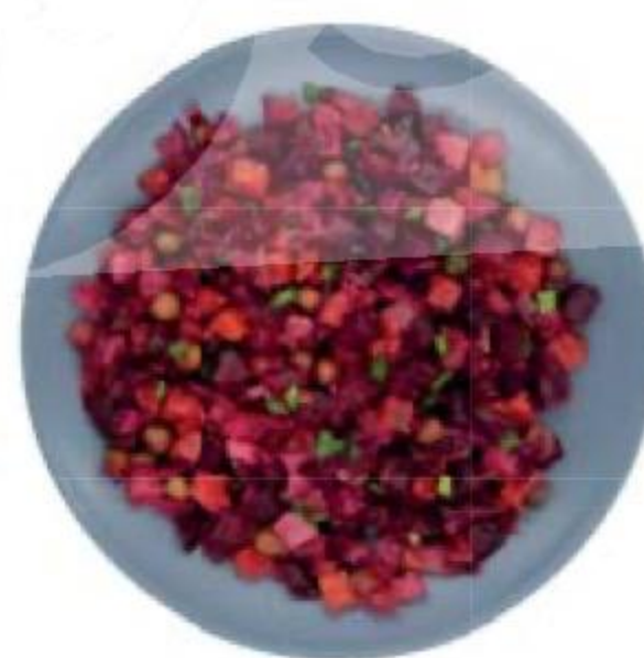
ВИНЕГРЕТ овощной, 100 г