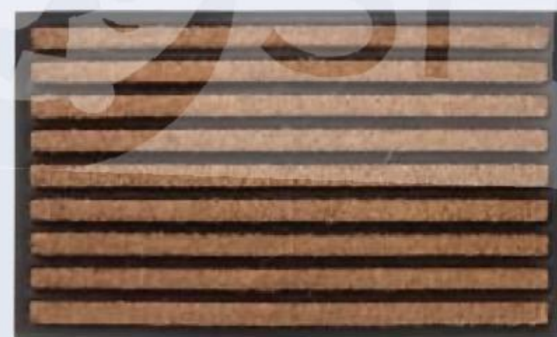
КОВРИК придверный Brush, House, 45 × 75 см