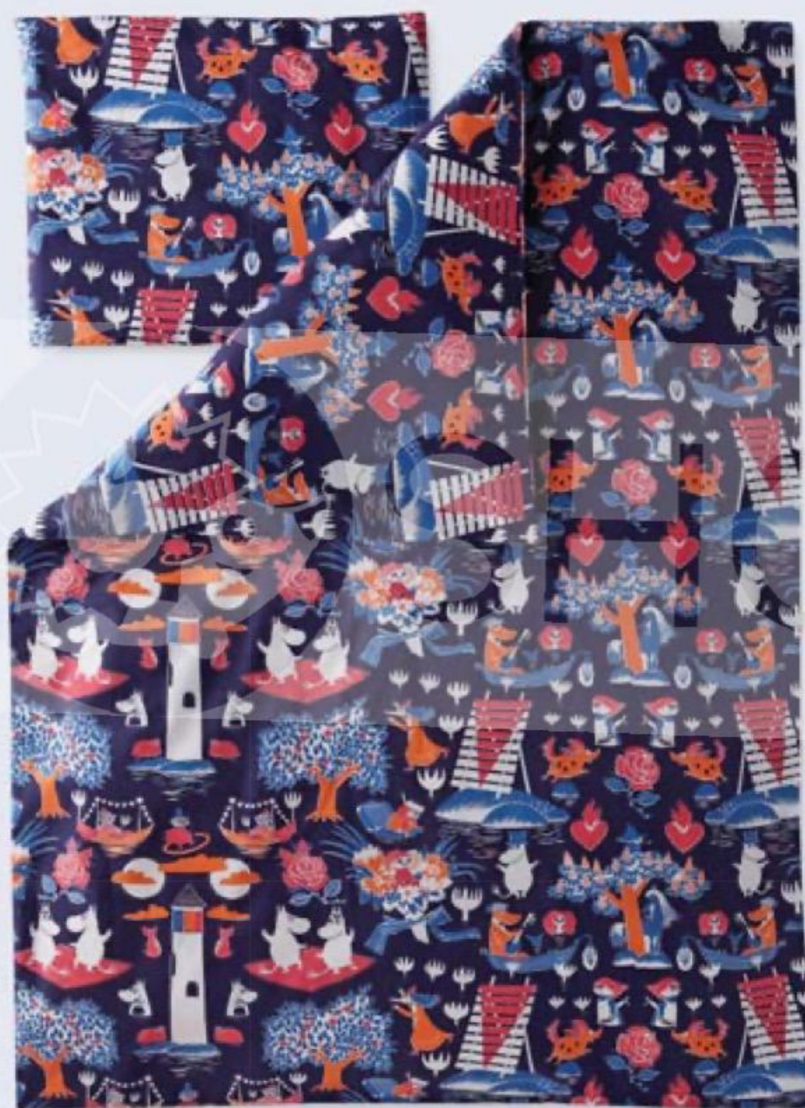
КОМПЛЕКТ постельного белья 1,5-спальный, Finlayson, 150 × 210 см