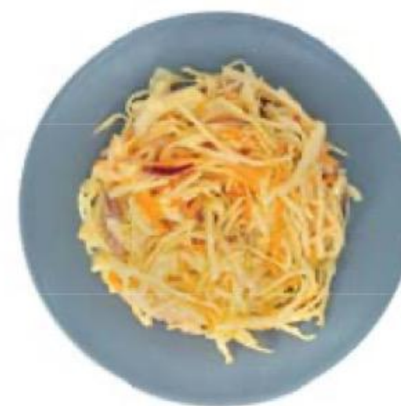
САЛАТ Коул слоу, 100 г