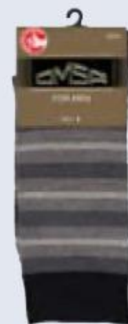
НОСКИ/ КОЛГОТКИ/ НИЖНЕЕ БЕЛЬЁ в ассортименте, OMSA