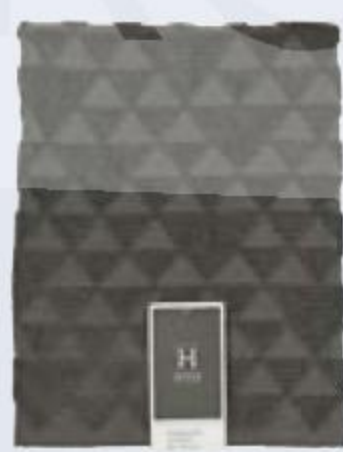
ПОЛОТЕНЦЕ в ассортименте, House, 50 × 70 см