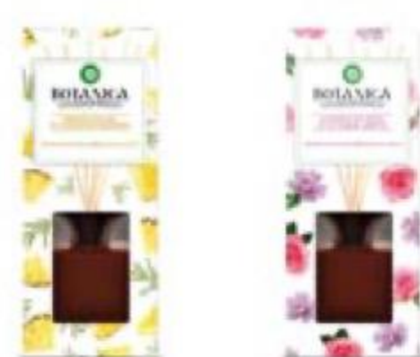
ДИФFUЗОР ароматический в комплекте с деревянными палочками Алтайская роза и луговые цветы/Свежий ананас и тунисский розмарин, Air Wick