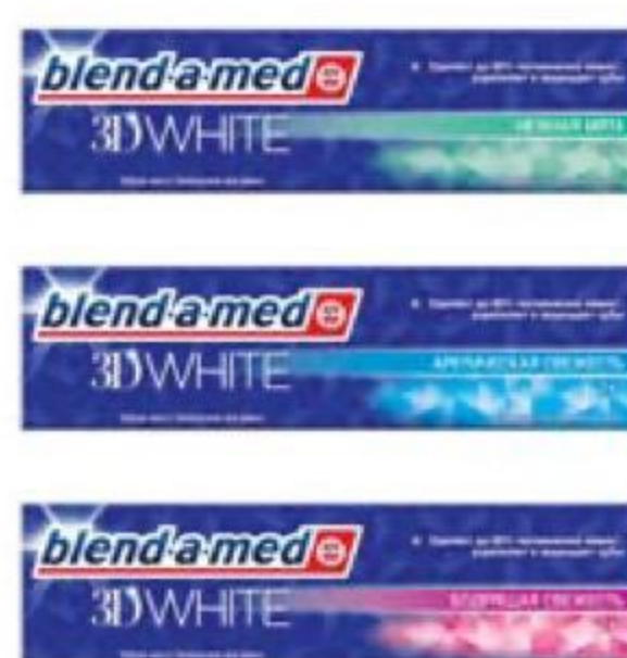
ЗУБНАЯ ПАСТА в ассортименте, Blend-a-med, 100 мл