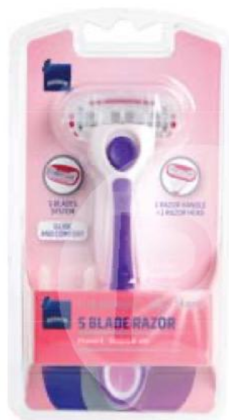
СТАНОК бритвенный с 5 лезвиями в ассортименте, Rainbow, 1 шт.