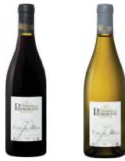
ВИНО Domaine de la Présidente, белое/красное, сухое, 13,5%, 0,75 л, Франция