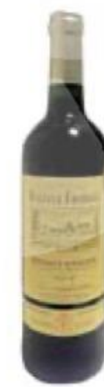
ВИНО Château Bellevue Favereau, красное, сухое, 13%, 0,75 л, Франция