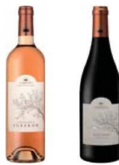
ВИНО Amédée Ventoux L'Excellence, красное/ розовое, сухое, 14,5/13,5%, 0,75 л, Франция