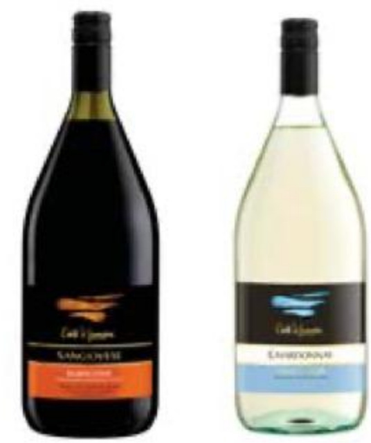
ВИНО Crete di Lamone, красное/белое, сухое, 11/11,5%, 1,5 л, Италия