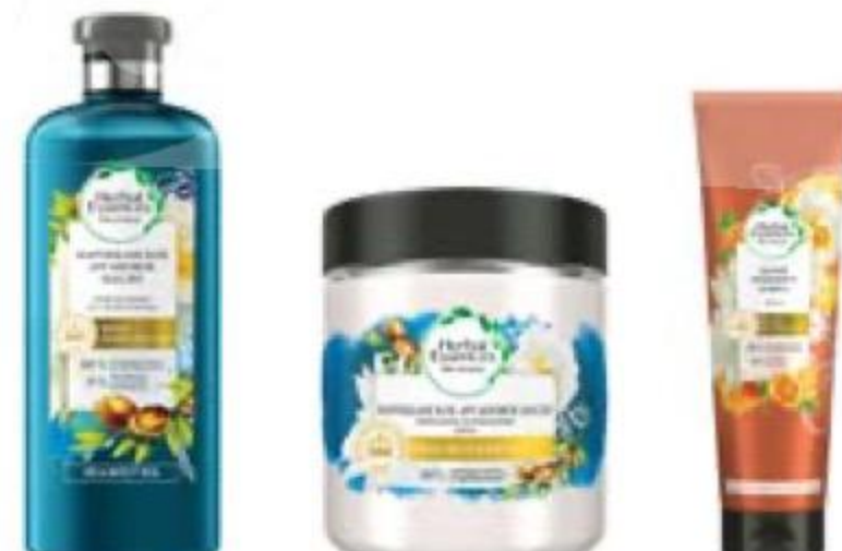
БАЛЬЗАМ- ОПОЛАСКИВАТЕЛЬ/ МАСКА/ШАМПУНЬ в ассортименте, Herbal Essences, 275–400 мл