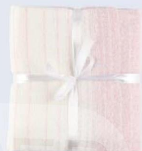
ПЛЕД Blue/Rosa, 4Living, 127 × 152 см