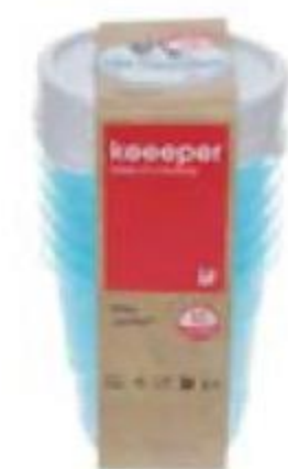
КОНТЕЙНЕРЫ 399 90 для заморозки, Кеерер, 0,35 л 299 90