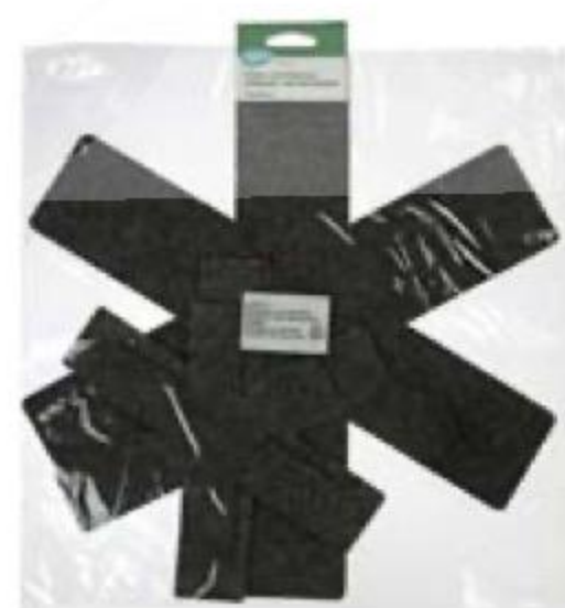
ЗАЩИТА 349 90 для сковороды с тефлоновым покрытием, X-tra 269 90