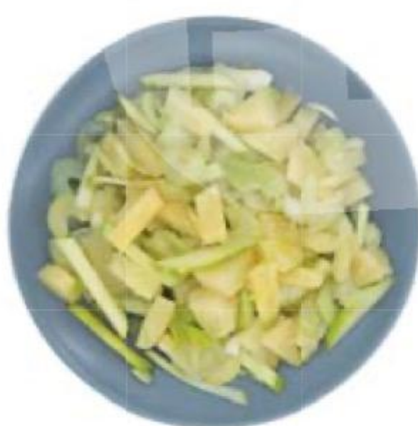
САЛАТ Микс, 100 г