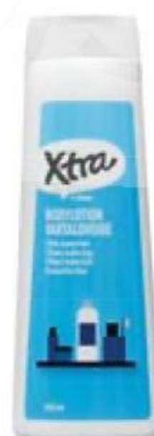
ЛОСЬОН для тела, X-tra, 500 мл