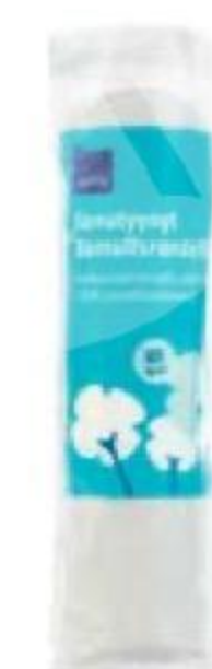
ВАТНЫЕ ДИСКИ Rainbow, 80 шт.