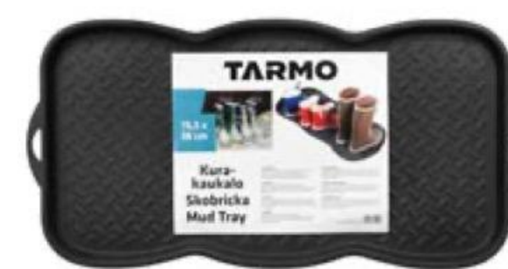
ПОДСТАВКА для обуви, Natura, 75,5 × 38 × 3,5 см