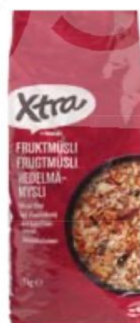
МЮСЛИ фруктовые, X-tra, 1 кг, Германия