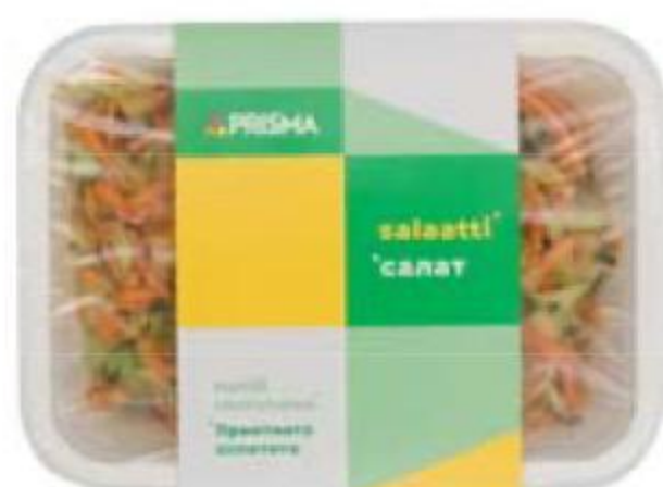
САЛАТ Солнышко, 300 г