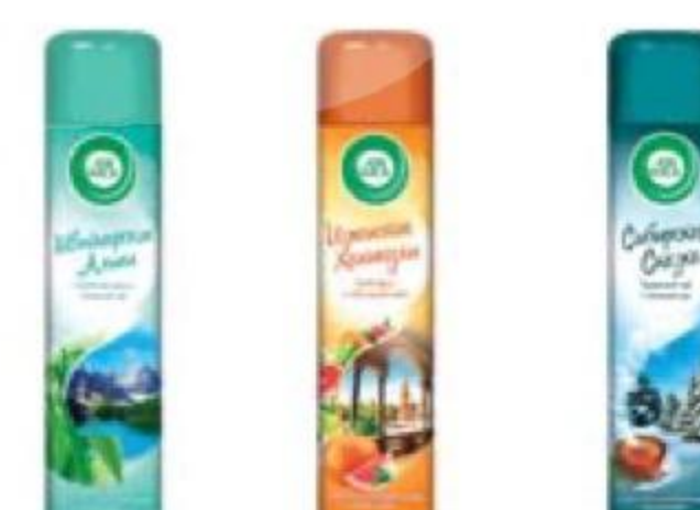
ОСВЕЖИТЕЛЬ воздуха в ассортименте, Air Wick, 290 мл