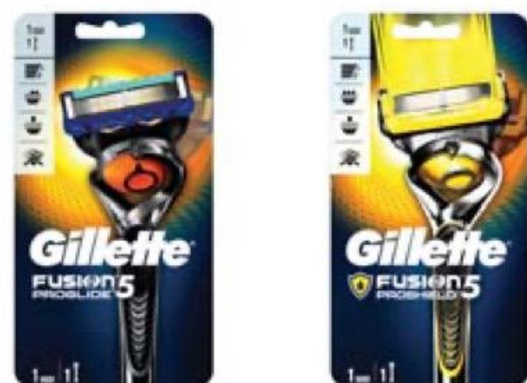
СТАНОК Fusion5 ProGlide/ ProShield, Gillette