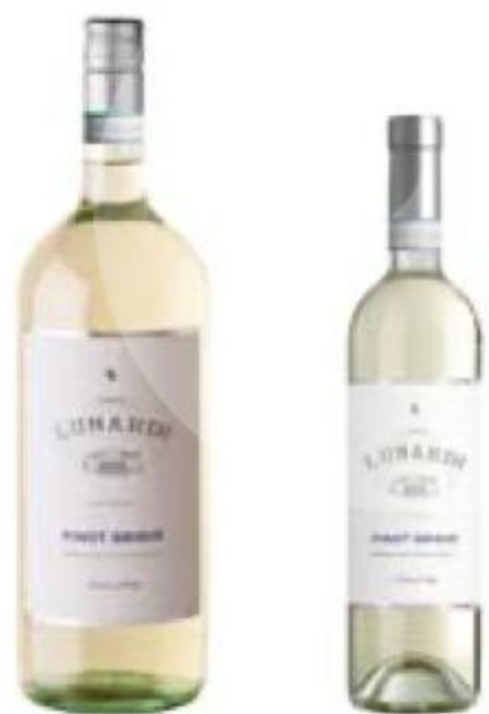
ВИНО Casa Lunardi Pinot Grigio, белое, сухое, 12%, 0,75/1,5 л, Италия