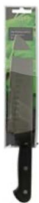
НОЖ 749 90 House, 18 см 499 90