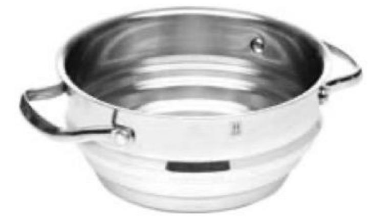
ПАРОВАРКА 1799 00 House 1199 00