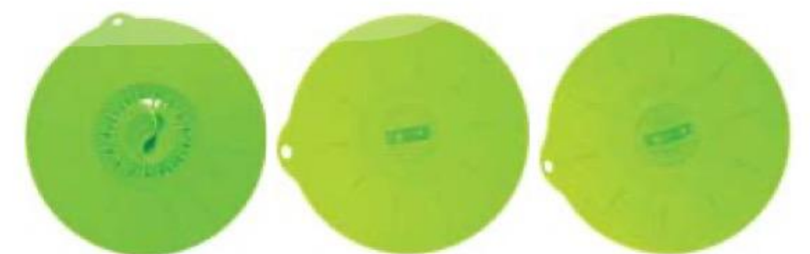
КРЫШКА от 299 90 силиконовая, House, 14–30 см от 199 90