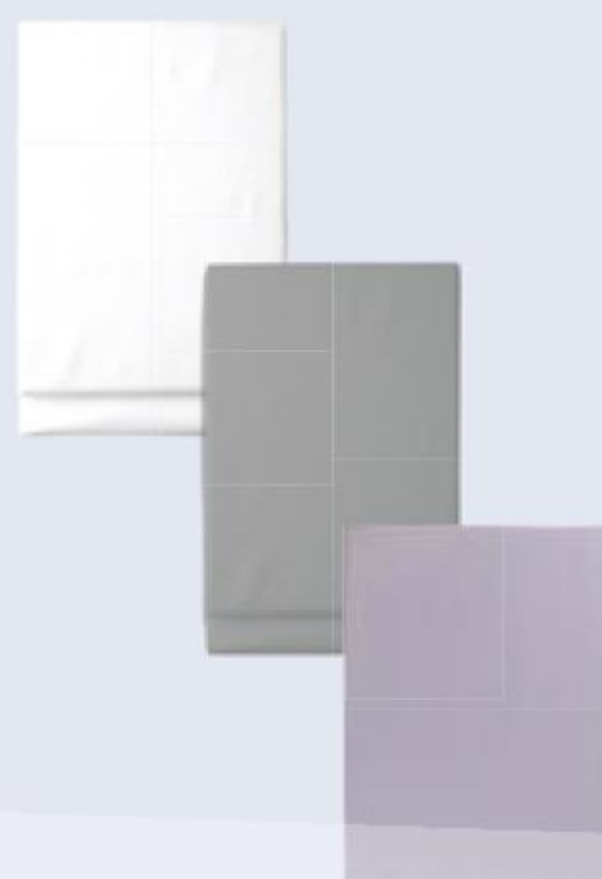
ПРОСЫНЯ в ассортименте, Finlayson, 90 × 200/120 × 200/160 × 200/ 180 × 200 см