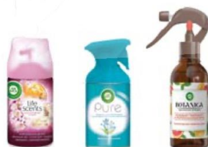
ОСВЕЖИТЕЛЬ/ СПРЕЙ/ФЛАКОН сменный, Air Wick, 250 мл