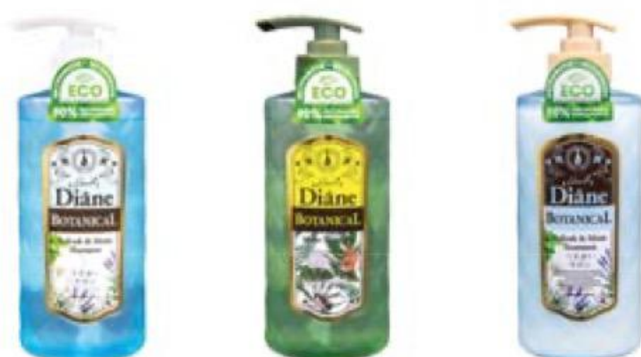
ШАМПУНЬ/ БАЛЬЗАМ для волос Botanical в ассортименте, Moist Diane, 450 мл