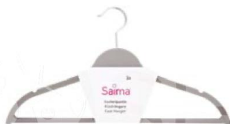
ВЕШАЛКА-ПЛЕЧИКИ Saima, 3 шт.