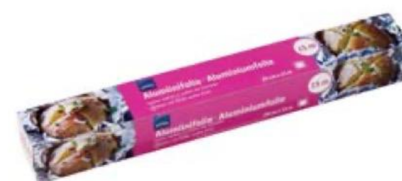
ФОЛЬГА алюминиевая, Rainbow, 29 × 150 см