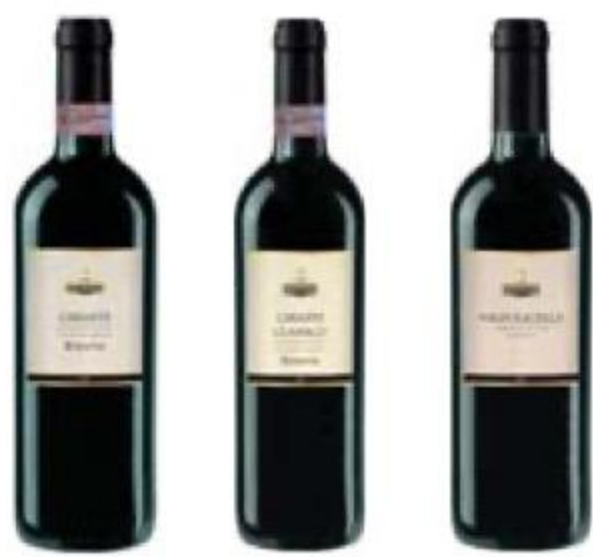
ВИНО Palazzo Nobile Chianti Classico/Valpolicella/ Chianti Riserva, красное, сухое, 13/12%, 0,75 л, Италия