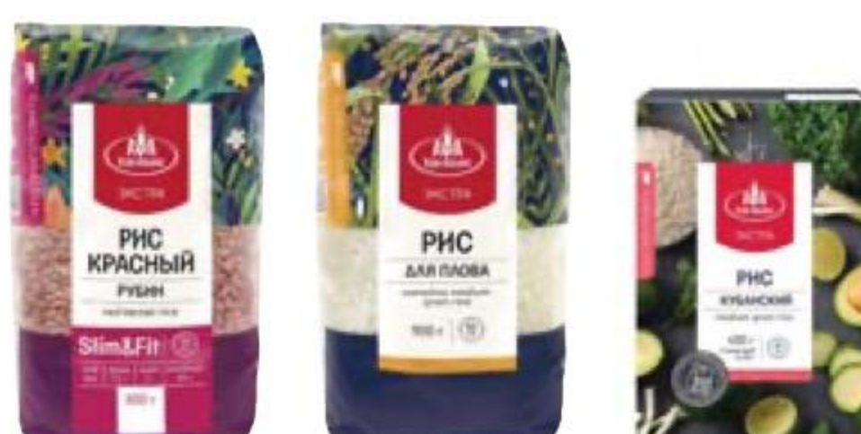
РИС в ассортименте, Агро-Альянс, 400–900 г