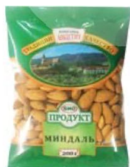
МИНДАЛЬ Биопродукт, 200 г