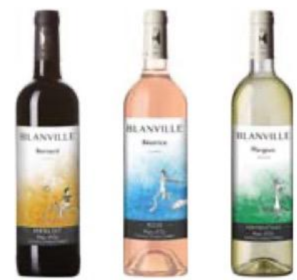
ВИНО Blanville Bernard/Beatrice/ Margaux, красное/розовое/ белое, сухое, 12,5/13,5%, 0,75 л, Франция