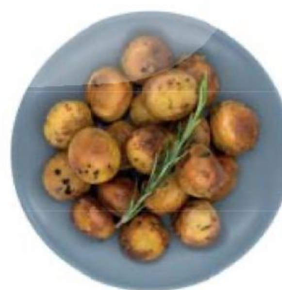
КАРТОФЕЛЬ запечённый с розмарином, 100 г