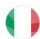
РИС длиннозёрный пропаренный, Rainbow, 1 кг, Италия