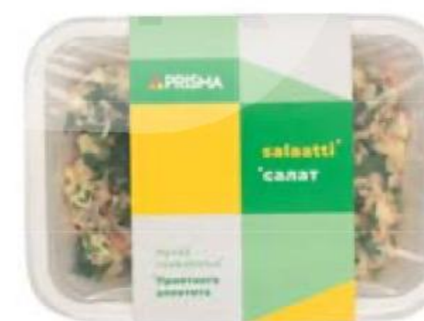
САЛАТ Оливье, 300 г