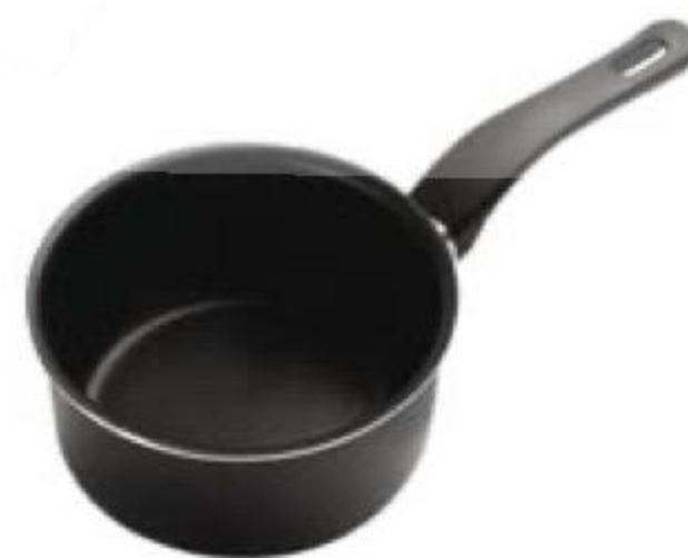
КОВШ 849 90 алюминиевый, X-tra, 1,2 л 599 90