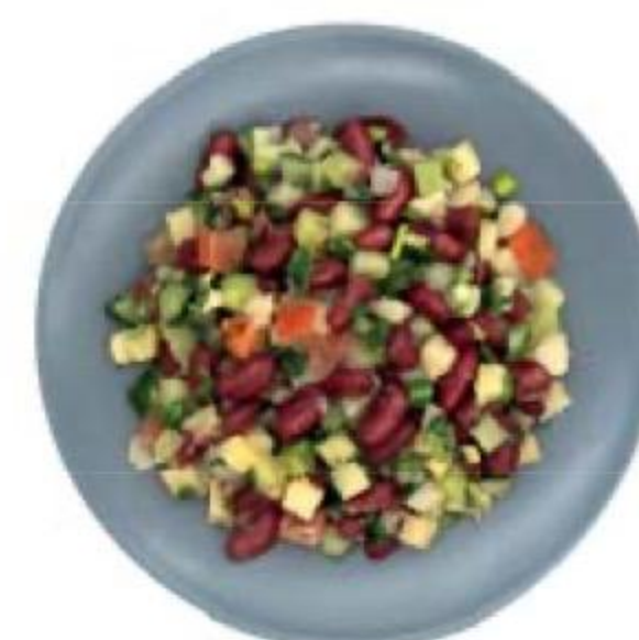
САЛАТ Купеческий, 100 г