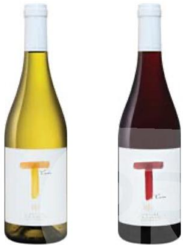
ВИНО Tramin, белое/ красное, сухое, 12,5%, 0,75 л, Италия