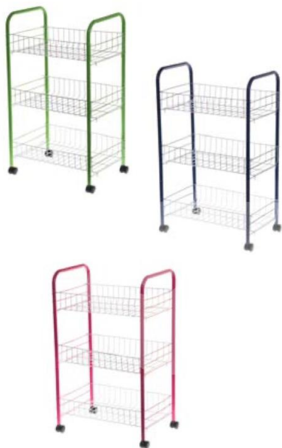
СТЕЛЛАЖ складной на колёсиках, Saima