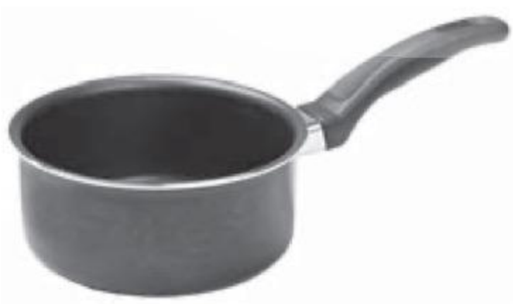
СОТЕЙНИК 1290 00 House, 1,5 л 949 90