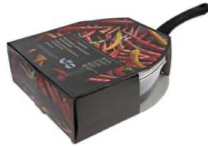
СКОВОРОДА 2499 00 для тушения, House, 24 см 1599 00