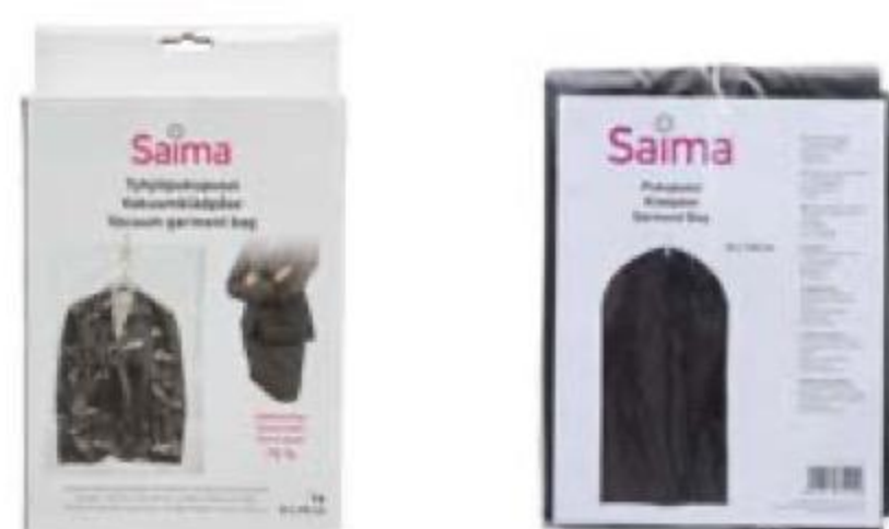
ПАКЕТ вакуумный в ассортименте, Saima