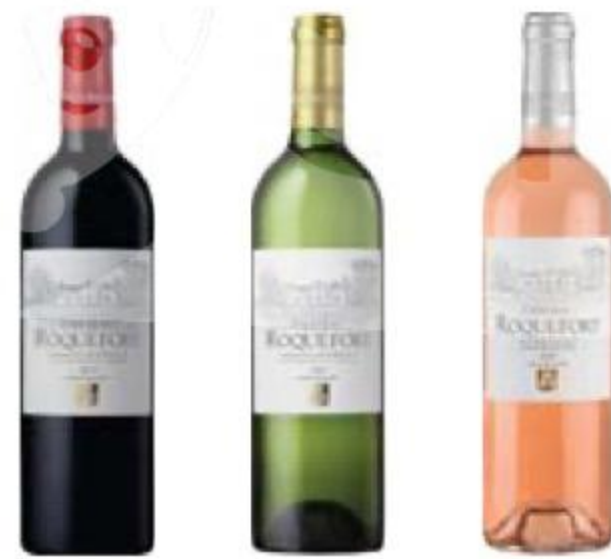
ВИНО Château de Roquefort, розовое/красное/белое, сухое, 12,5/13,5%, 0,75 л, Франция