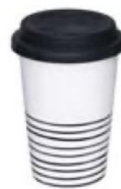
КРУЖКА 449 90 MaKu Kitchen Life, 400 мл 349 90