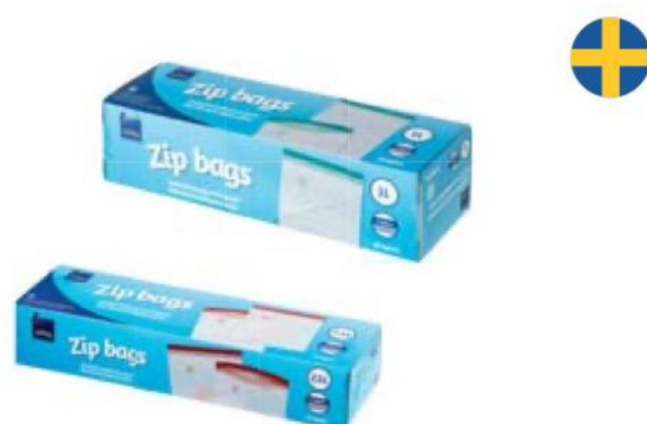
МИНИ-ПАКЕТЫ закрывающиеся, Rainbow, 25 шт., Швеция