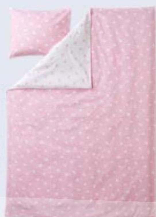
КОМПЛЕКТ постельного белья Oppl, розовый, Finlayson, 120 × 160/ 80 × 125 см