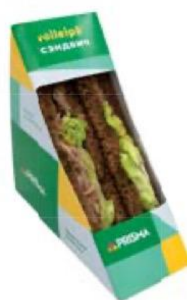
СЭНДВИЧ с тунцом, 1 упаковка