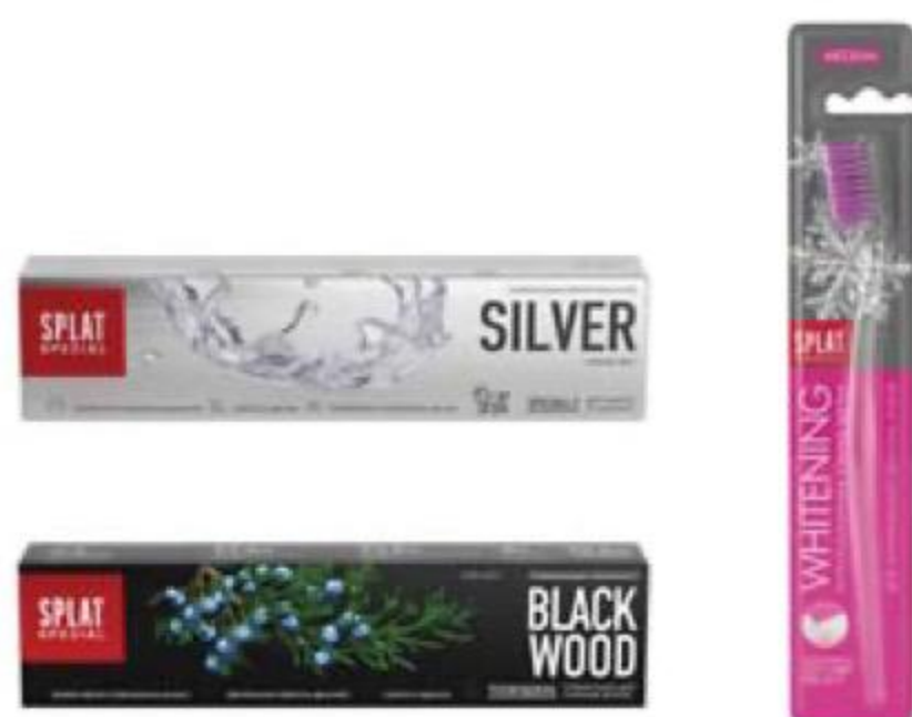
СРЕДСТВА для ухода за зубами в ассортименте, паста/ щётка/нить, SPLAT