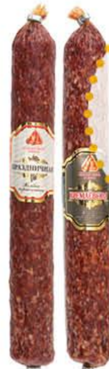
Колбаса СМП Кремлевская, Праздничная сырокопченая