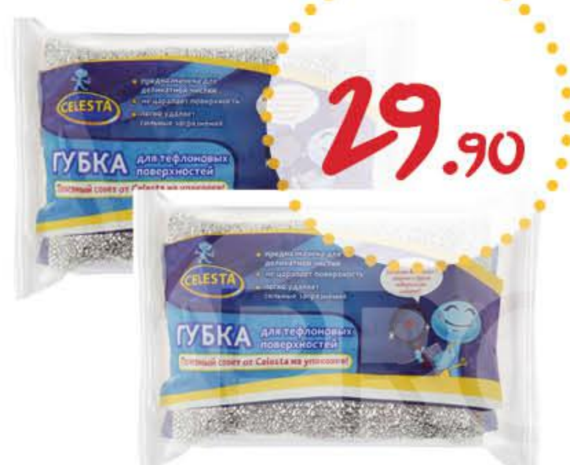
Губка для посуды СЕЛЕСТА для тефлоновых поверхностей