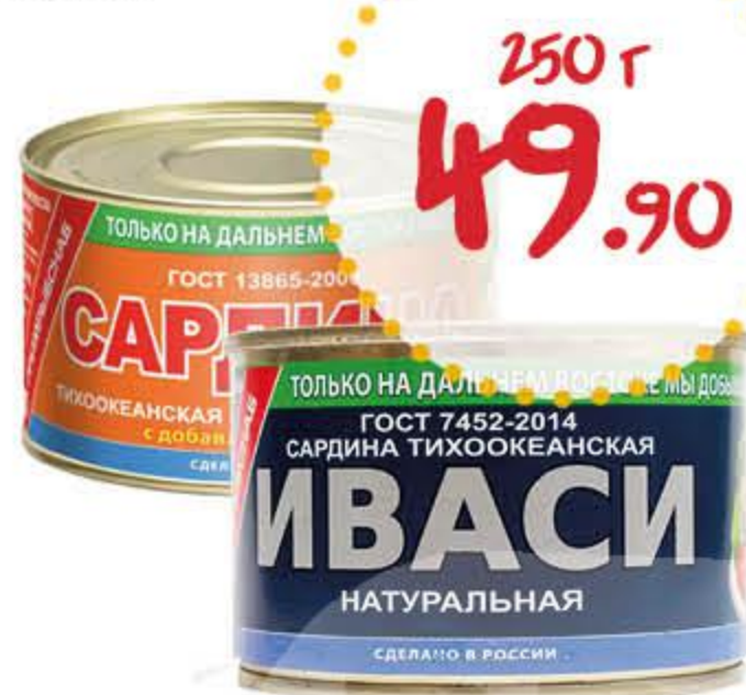
Сардина ПРИМРЫБСНАБ Иваси натуральная с добавлением масла

Срок действия предложения с 2.03 по 15.03.2021 г.