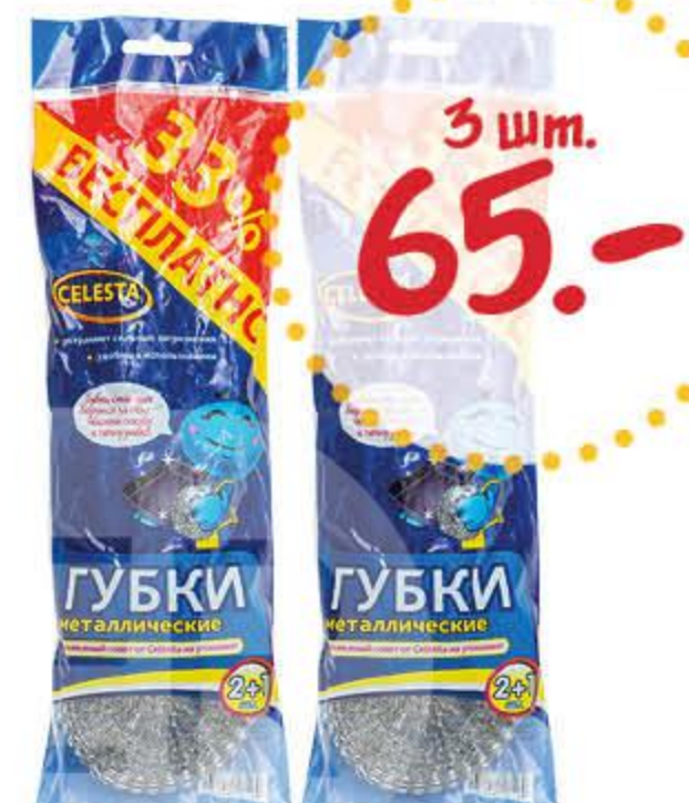
Губка СЕЛЕСТА металлическая