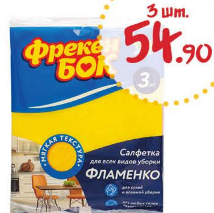
Салфетка для уборки ФРЕКЕН БОК Фламенко ВИСКОЗНАЯ