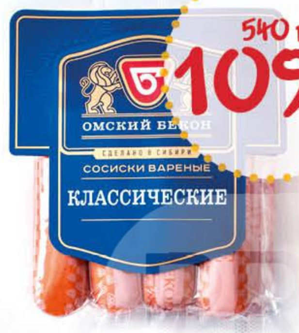
Сосиски ОМСКИЙ БЕКОН Классические