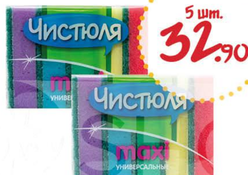
Губка хозяйственная ЧИСТЮЛЯ Макси