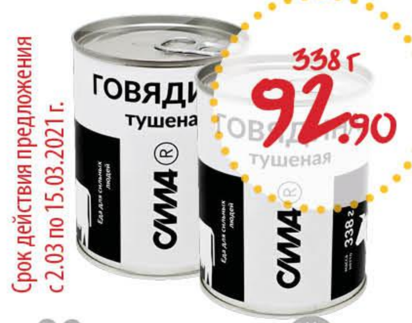
Говядина тушеная СИЛА высший сорт

Срок действия предложения с 2.03 по 15.03.2021 г.