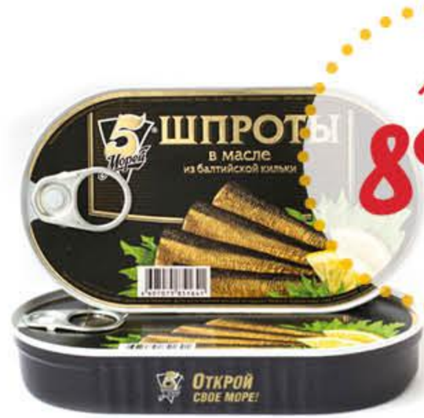
Шпроты 5 МОРЕЙ из балтийской кильки в масле

Срок действия предложения с 2.03 по 15.03.2021 г.