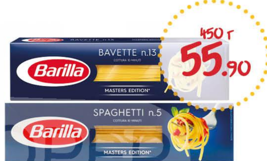
Макаронные изделия БАРИЛЛА баветте № 13, спагетти № 5