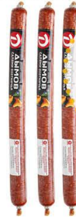
Салями ДЫМОВ ОХОТНИЧЬЯ полукопченая