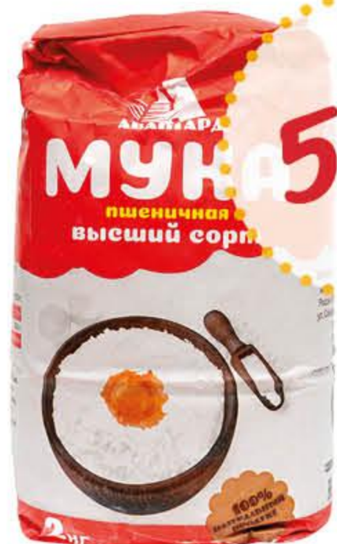
Мука АВАНГАРД пшеничная высший сорт