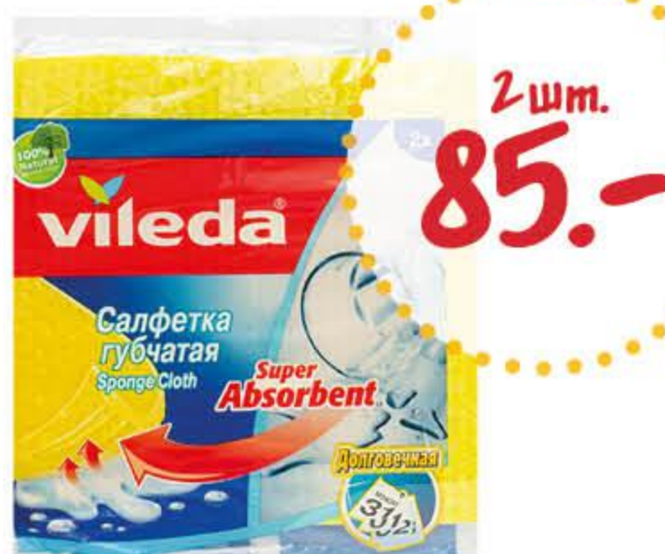
Салфетка ВИЛЕДА губчатая