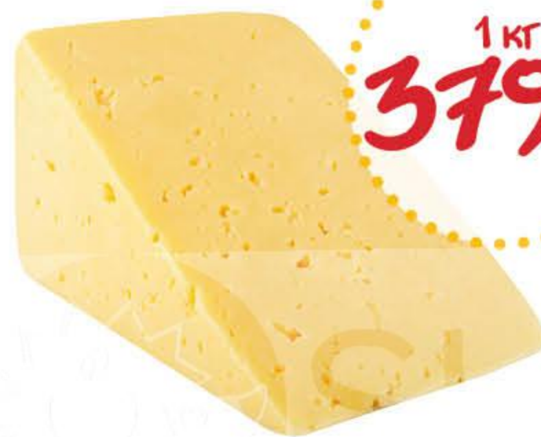
Сыр АЛТАЙСКИЕ ПРОДУКТЫ Российский бзмж 50%