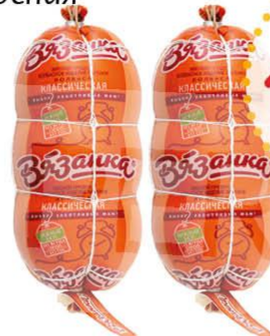
Колбаса СТАРОДВОРСКИЕ КОЛБАСЫ Вязанка классическая вареная