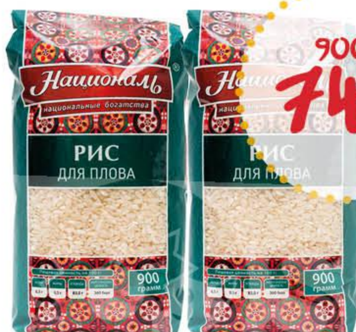
Рис НАЦИОНАЛЬ для плова