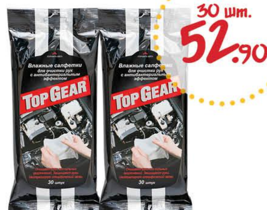
Салфетки влажные ТОП ГИР для рук антибактериальные