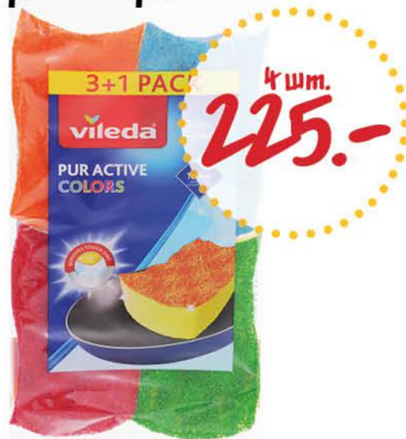
Губка кухонная ВИЛЕДА Пур Колорс