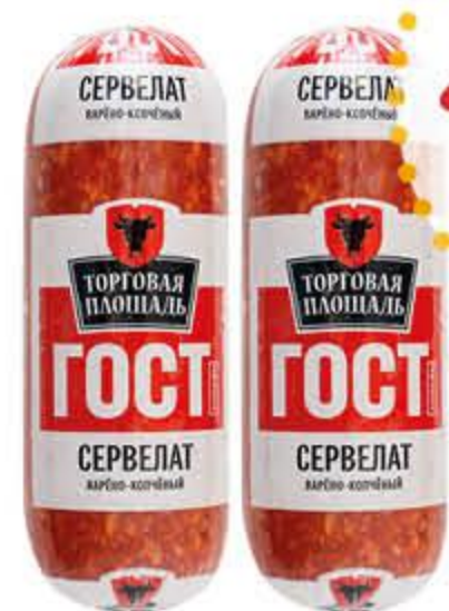
Сервелат ТОРГОВАЯ ПЛОЩАДЬ варено-копченый