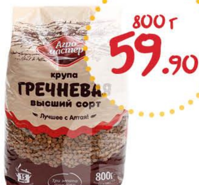
Гречневая крупа АГРОМАСТЕР