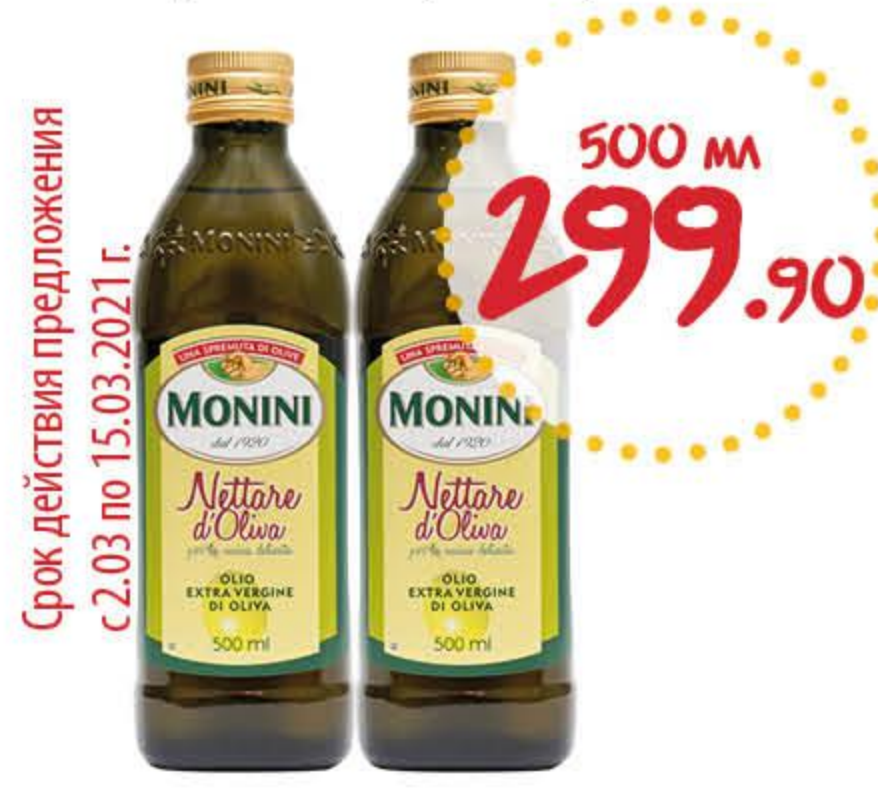
Масло оливковое МОНИНИ Неттаре экстра вирджин