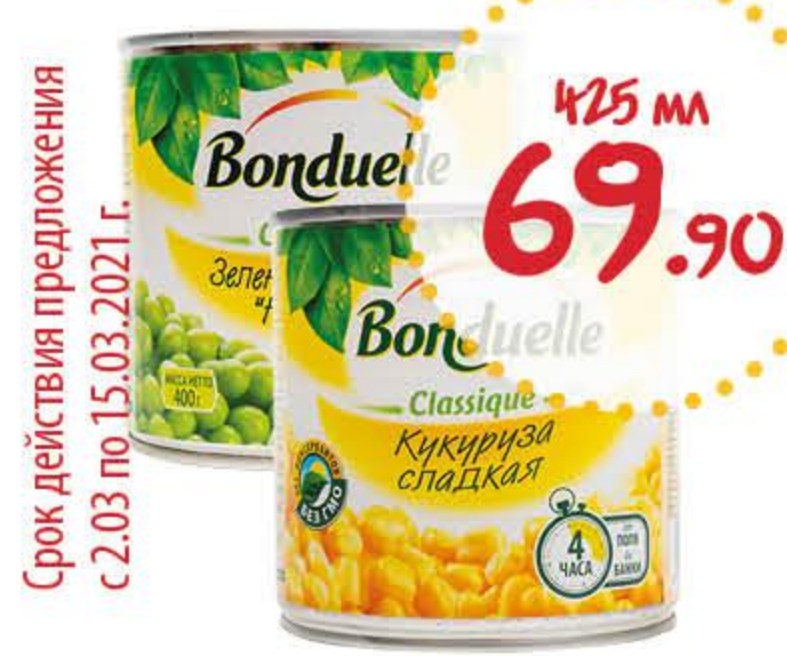
Горошек, Кукуруза БОНДЮЭЛЬ

Срок действия предложения с 16.03 по 30.03.2021 г.