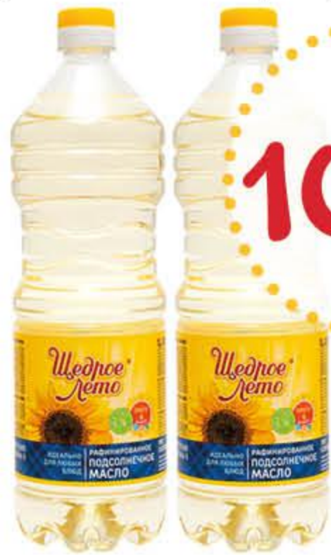
Масло подсолнечное ЩЕДРОЕ ЛЕТО рафинированное