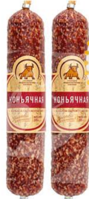
Колбаса СПК Коньячная сырокопченая