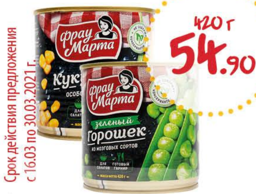
Горошек, кукуруза ФРАУ МАРТА ГОСТ