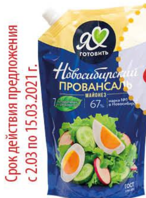
Майонез НОВОСИБИРСКИЙ ПРОВАНСАЛЬ 67%