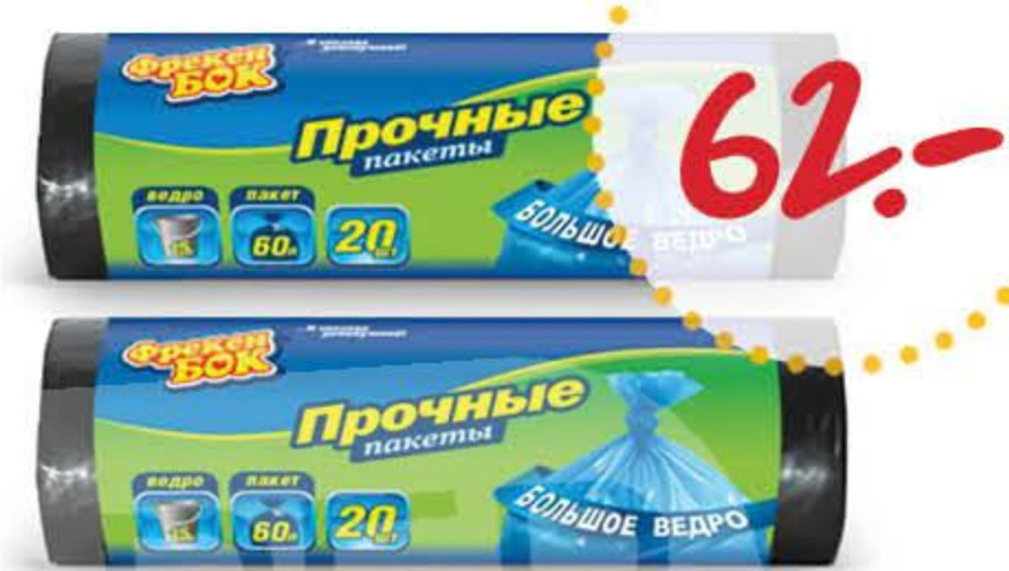
Пакеты для мусора ФРЕКЕН БОК прочные черные 60 л 20 шт.