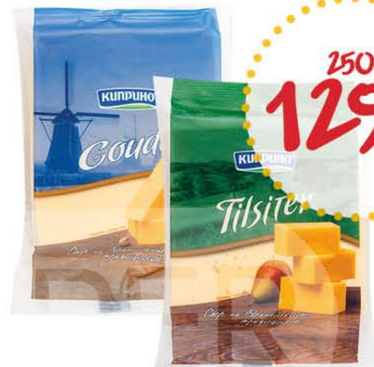
Сыр КИПРИНО Гауда, Тильзитер бзмж 45%