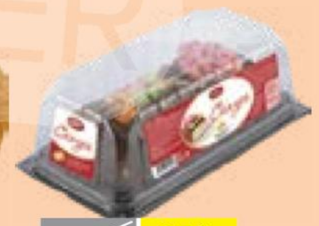
ТОРТ МЕДОВЫЙ Академия Вкуса, 650 г