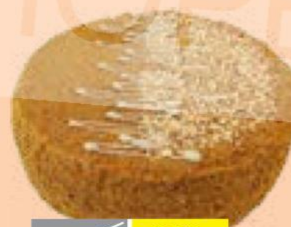
ПИРОЖНЫЕ ПРОФИТРОЛИ с пломбирным кремом, Mirel, 180 г