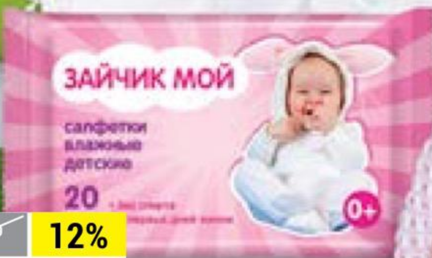
ВЛАЖНЫЕ САЛФЕТКИ ЗАЙЧИК МОЙ детские, гигиенические, 20 шт.

ОСТАВЬТЕ СВОЙ ОТЗЫВ О КАЧЕСТВЕ ТОВАРА! mnenie@ivoiin.ru