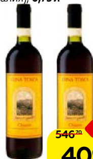
Вино ЛУНА ТОСКА , Кьянти, красное сухое (Италия), 0,75 л