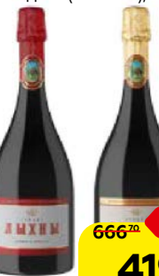
Вино игристое ЛЫХНЫ , Белое, полусладкое/ Красное, полусладкое (Абхазия), 0,75 л