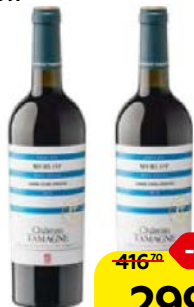
Вино ШАТО ТАМАНЬ Мерло, красное сухое, 0,75 л