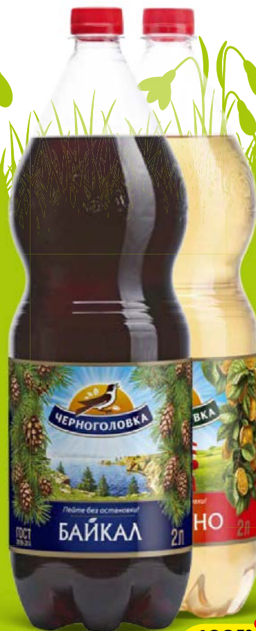
Напиток газированный НАПИТКИ ИЗ ЧЕРНОГОЛОВКИ, в ассортименте*, 2 л