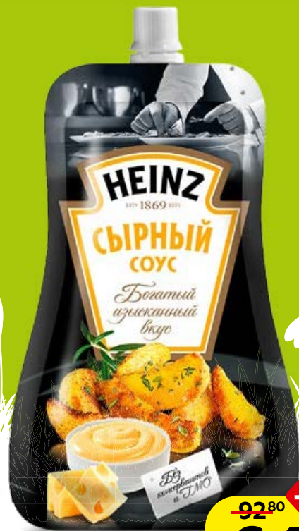
Соус ХАЙНЦ, сырный/чесночный/цезарь, 230 г