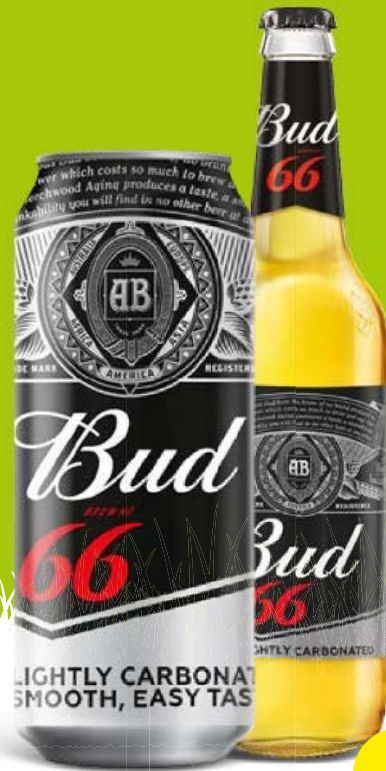
Пиво BUD® 66 , светлое, пастеризованное, 4,3%: банка, 0,45л/ бутылка, 0,47л