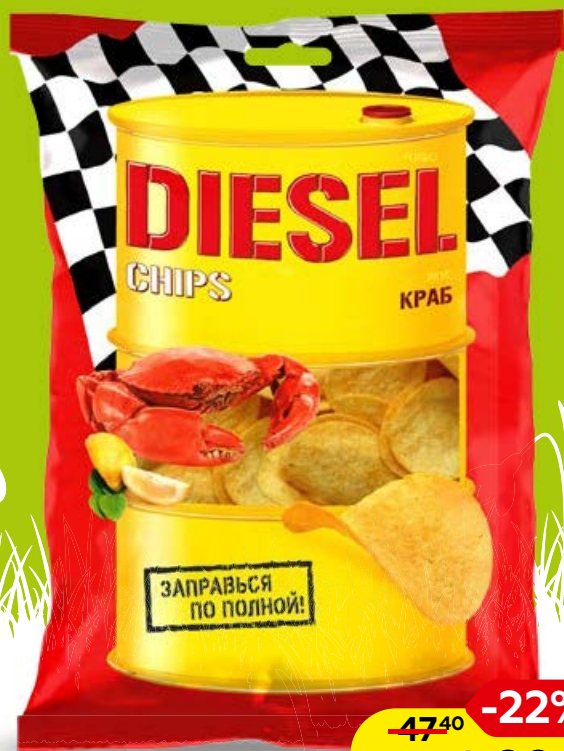
Чипсы ТУРБО ДИЗЕЛЬ сметана-зелень /краб, 75г