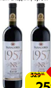
Вино ФАНАГОРИЯ Номерной резерв, Кагор Канонический, красный сладкий, 0,75 л