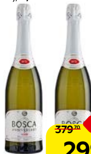
Напиток газированный БОСКА , Белый полусладкий (Литва), 0,75 л