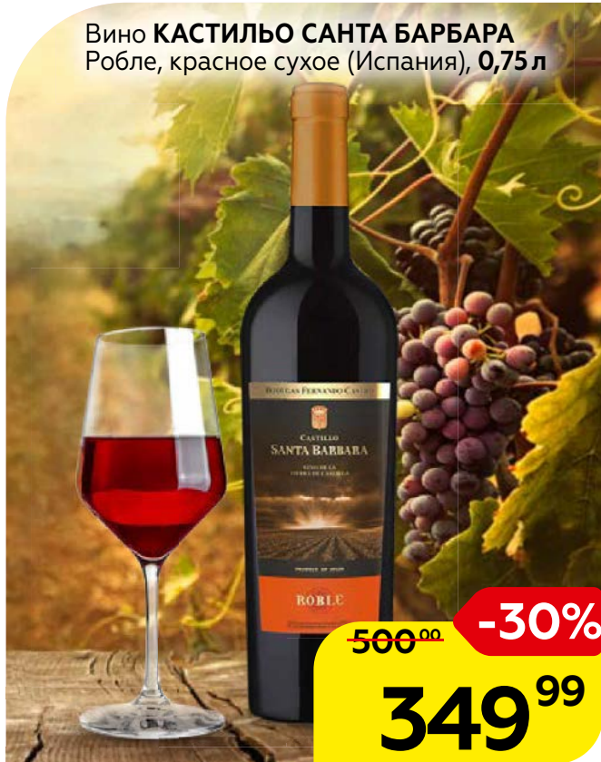
Вино КАСТИЛЬО САНТА БАРБАРА Робле, красное сухое (Испания), 0,75 л