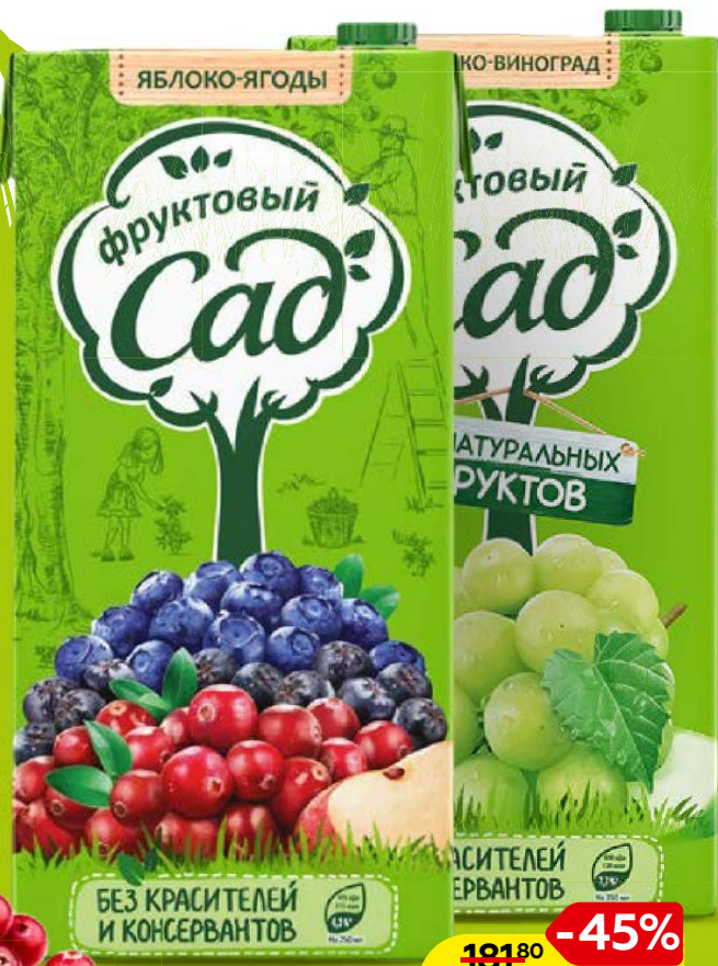
Соки, нектары и напитки ФРУКТОВЫЙ САД, в ассортименте*, 1,93 л