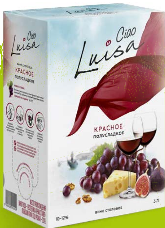
Вино ЛУИЗА ЧАО полусладкое: Каберне, красное/ Шардоне, белое, 3л