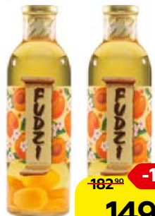
Вино фруктовое ФУДЗИ , Абрикос, белое сладкое, 0,7 л