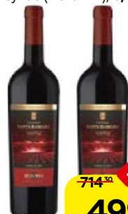
Вино КАСТИЛЬО САНТА БАРБАРА , Резерва, крас- ное сухое (Испания), 0,75 л