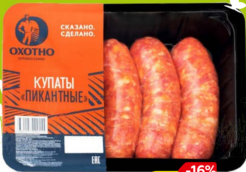
Купаты ПИКАНТНЫЕ, охлажденные, 400 г