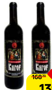
Вино ПРАВОСЛАВНОЕ красное, сладкое, 0,7 л