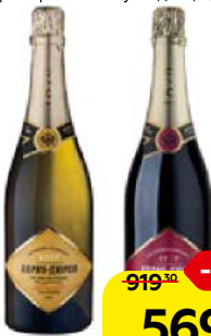
Вино игристое АБРАУ-ДЮРСО Пре- миум, выдержанное: Белое полусухое/ Каберне красное полусладкое, 0,75 л