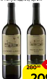
Вино КРЫМСКОЕ НАСЛЕДИЕ , Белое, Шардоне-Алиготе, сухое/ Белое полусладкое, 0,75 л