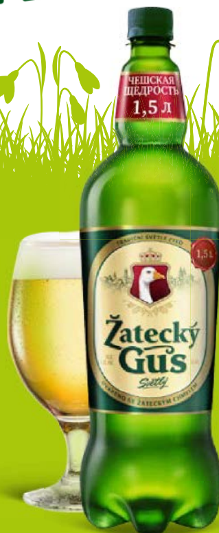
Пиво ЖАТЕЦКИЙ ГУСЬ светлое, 1,5 л