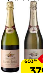
Шампанское АБРАУ-ДЮРСО , Рос- сийское Классическое, выдержанное белое: полусладкое/ брют, 0,75 л