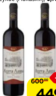
Вино АШТА ЛАША , Саперави-Оджалеси, крас- ное сухое (Абхазия), 0,75 л