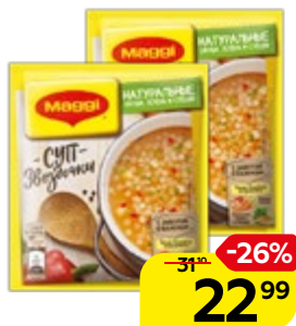
Суп МАГГИ®, Звездочки, 54 г