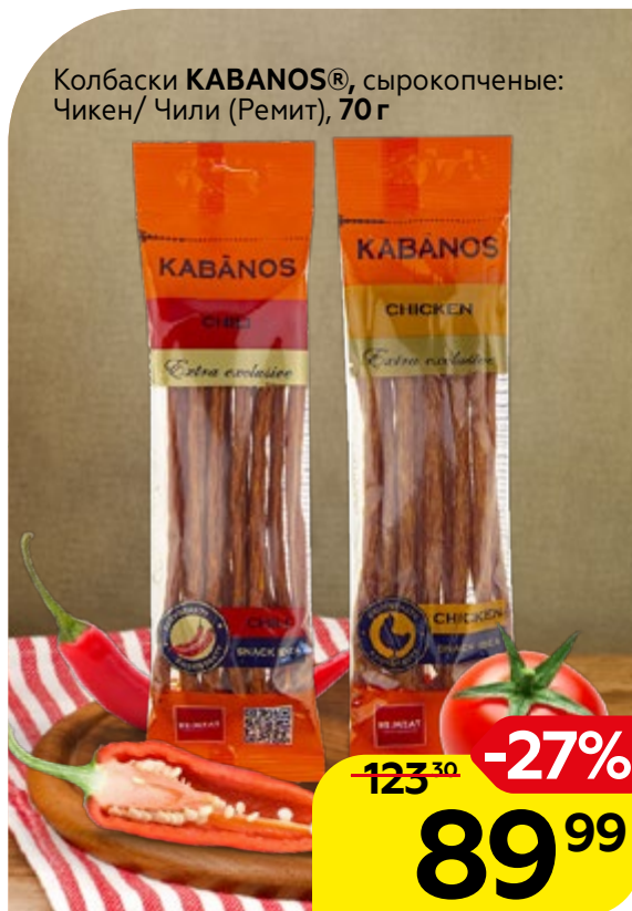
Колбаски KABANOS® , сырокопченые: Чикен/ Чили (Ремит), 70 г