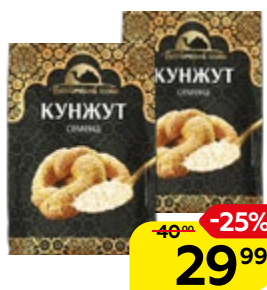
Семена кунжута ВОСТОЧНЫЙ ГОСТЬ, 40 г