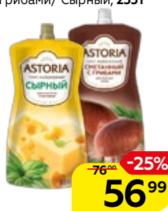
Соус майонезный АСТОРИЯ, Сметанный с грибами/ Сырный, 233 г