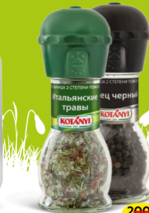
Приправы КОТАНИ, Мельница: Чеснок-травы-соль, 50г/ Итальянские травы, 48г/Черный перец, 36г