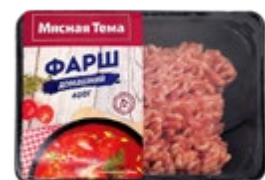
Фарш МЯСНАЯ ТЕМА домашний, свино-говяжий, охлажденный, 400 г