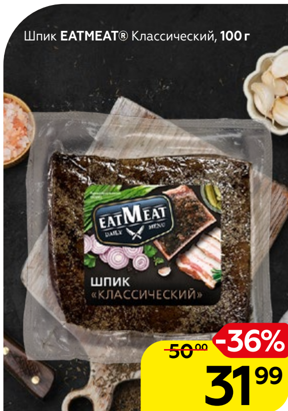
Шпик EATMEAT® Классический, 100 г