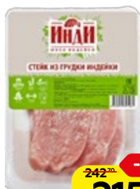
Стейк из грудки индейки ИНДИ охлажденный, 500 г