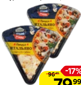
Пицца КУХНЯ БОЛЬШОЙ СТРАНЫ , Италияно, с курочкой и грибами, 160 г