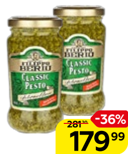
Соус ФИЛИППО БЕРИО Песто, классический, 190 г