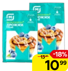
Дрожжи МАГНИТ Быстродействующие, 11 г