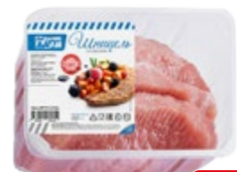
Шницель ДАЛЬНИЕ ДАЛИ , из свинины (Агро-Белогорье), 700 г