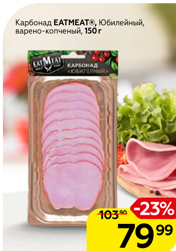
Карбонад EATMEAT® , Юбилейный, варено-копченый, 150 г