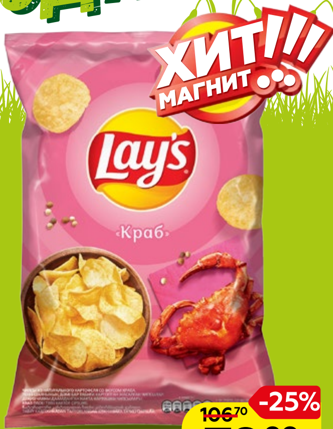
Чипсы LAY'S®, в ассортименте*, 150 г