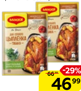
Приправа МАГГИ®, На второе, для сочного цыпленка табака, 47 г