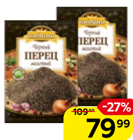
Перец черный ИНДАНА, молотый, 50 г