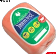
Ветчина ИМПЕРИЯ ВКУСА , с индейкой, мини (ЧМПЗ), 400 г