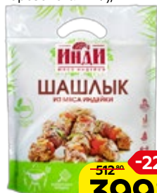
Шашлык ИНДИ из индейки, сациви, охлажденный (Морозовская ПФ), 1 кг