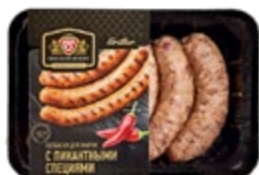
Колбаски для жарки ОМСКИЙ БЕКОН , с пикантными специями, 600 г