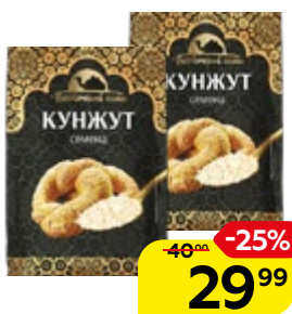
Семена кунжута ВОСТОЧНЫЙ ГОСТЬ, 40 г