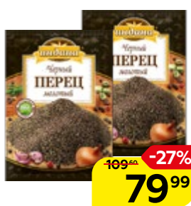
Перец черный ИНДАНА, молотый, 50 г