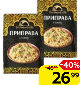
Приправа ВОСТОЧНЫЙ ГОСТЬ, для плова, 40 г