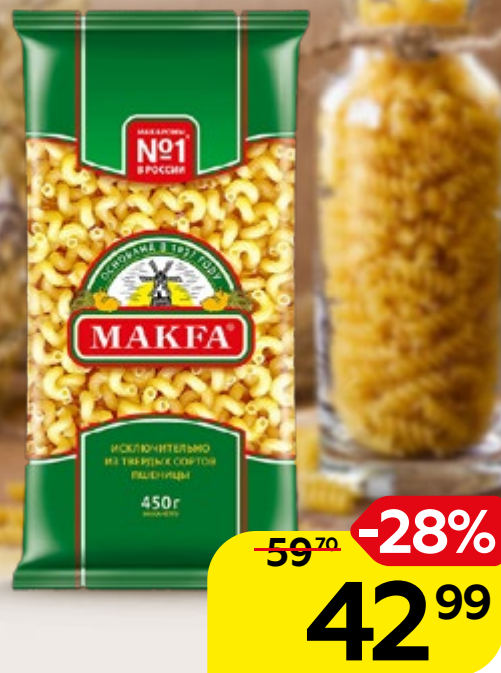
Макаронные изделия МАКФА®, виток, 450 г