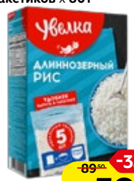
Рис УВЕЛКА , Длиннозерный, шлифованный, 5 пакетиков x 80 г