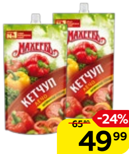
Кетчуп МАХЕЕВЪ Лечо, 300 г