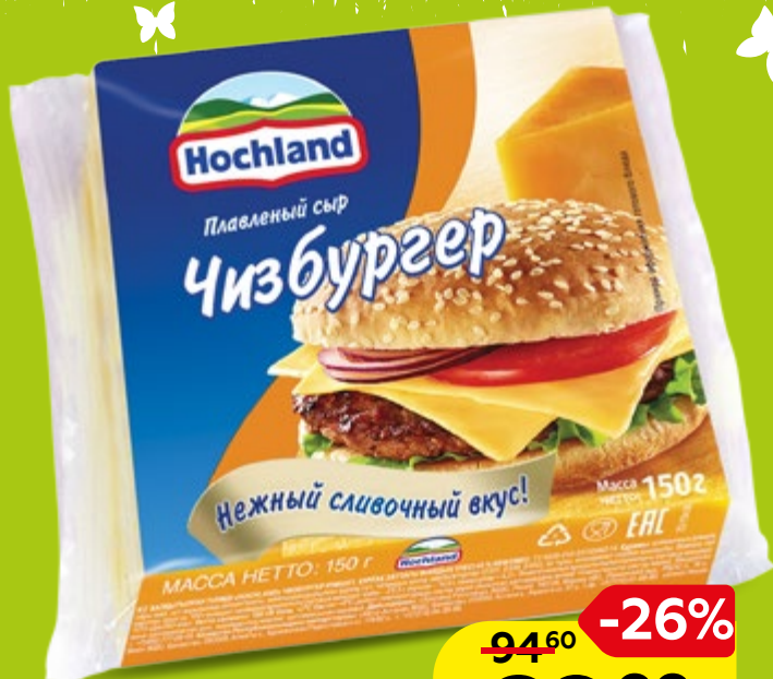
Сыр плавленный ХОХЛАНД, в ассортименте*, 150г