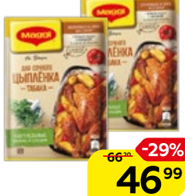
Приправа МАГГИ®, На второе, для сочного цыпленка табака, 47 г