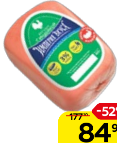
Ветчина ИМПЕРИЯ ВКУСА , с индейкой, мини (ЧМПЗ), 400 г