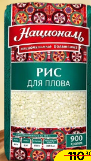
Рис НАЦИОНАЛЬ , для плова, 900 г