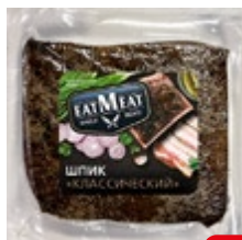
Шпик EATMEAT® Классический, 100 г