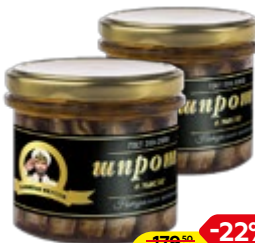
Шпроты КАПИТАН ВКУСОВ в масле, 250 г