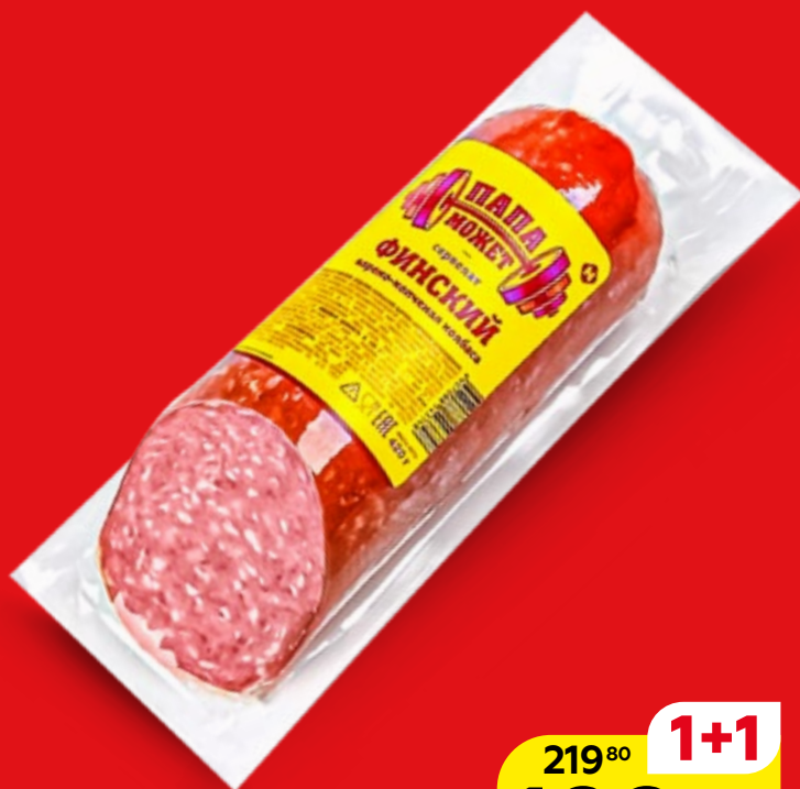
Сервелат ФИНСКИЙ, варено-копченый (Останкино), 420 г