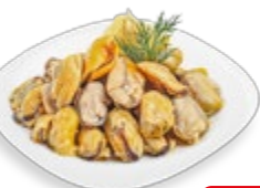
МЯСО МИДИЙ мороженое, 300 г

Представлены варианты с другими продуктами