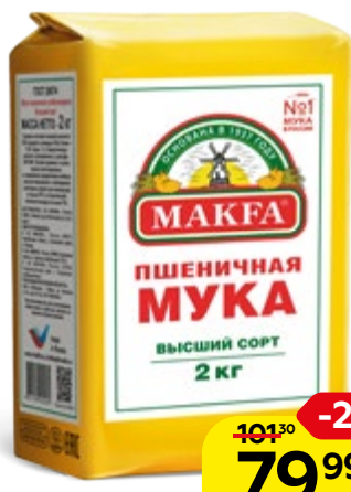
Мука пшеничная МАКФА®, высший сорт, 2 кг