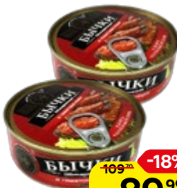
Бычки ЗНАК КАЧЕСТВА в томате, 240 г