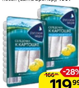
Филе сельди РУССКОЕ МОРЕ, к картошке, традиционный посол (Санта Бремор), 400 г