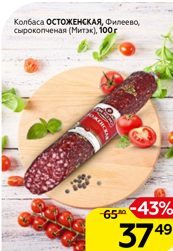
Колбаса ОСТОЖЕНСКАЯ , Филеево, сырокопченая (Митэк), 100 г