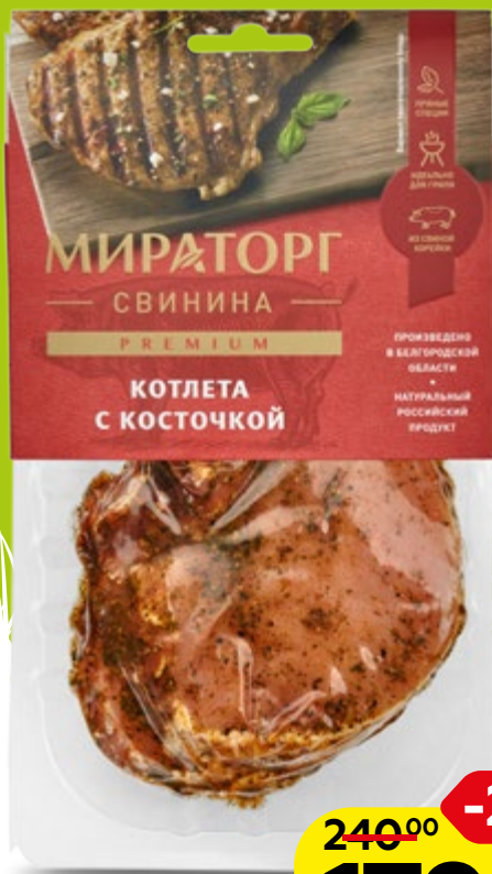
Стейк МИРАТОРГ котлета с косточкой охлажденный, 400г