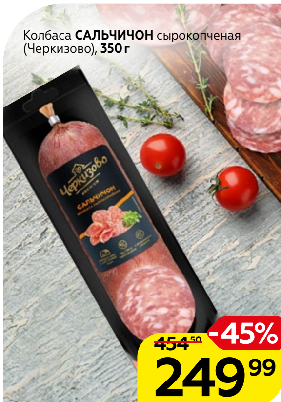
Колбаса САЛЬЧИЧОН сырокопченая (Черкизово), 350 г