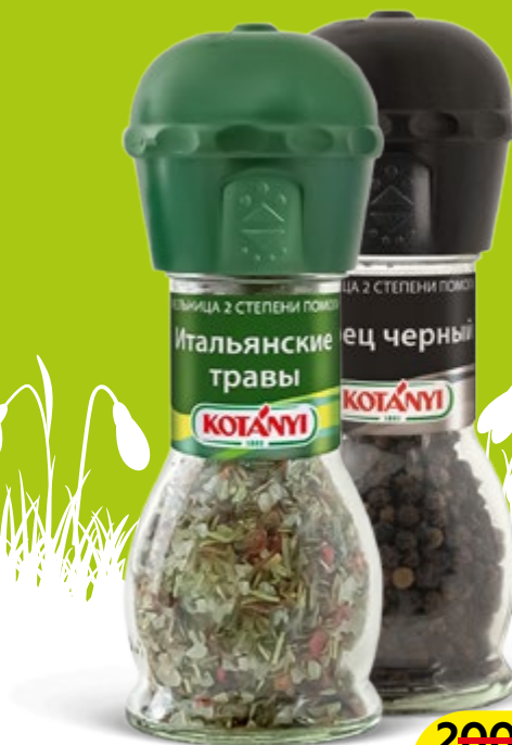
Приправы КОТАНИ, Мельница: Чеснок-травы-соль, 50г/ Итальянские травы, 48г/Черный перец, 36г