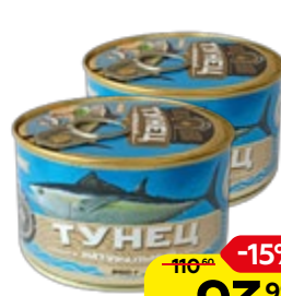
Тунец ЗНАК КАЧЕСТВА натуральный, 250 г