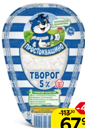
Творог ПРОСТОКВАШИНО, 5%, 220 г