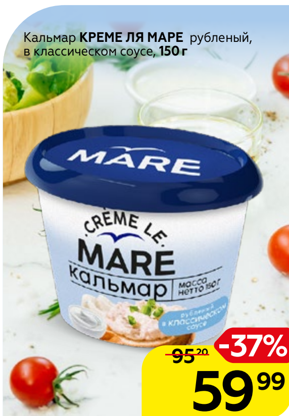
Кальмар КРЕМЕ ЛЯ МАРЕ рубленный, в классическом соусе, 150 г