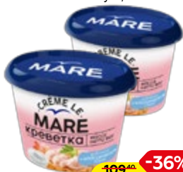
Креветки БАЛТИЙСКИЙ БЕРЕГ Крем Ле Маре, рубленные, в классическом соусе, 150 г