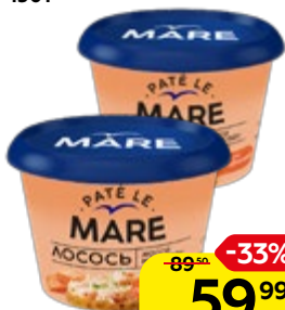
Лосось ПАТЕ ЛЕ МАРЕ, рубленный, подколпаченный, 150 г