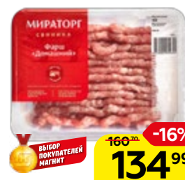
Фарш ДОМАШНИЙ свинина-говядина, охлажденный (Мираторг), 400 г