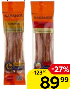
Колбаски KABANOS® , сырокопченые: Чикен/Чили (Ремит), 70 г