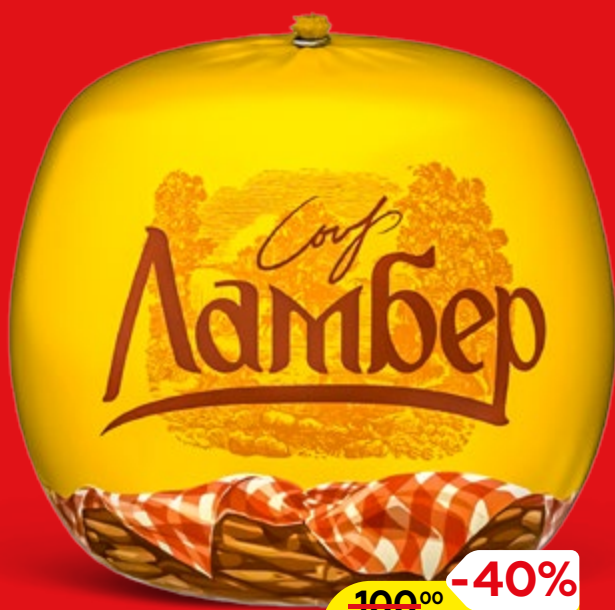
Сыр ЛАМБЕР, 100 г

Рекламная акция магазинов «Магнит у дома» 28 апреля – 04 мая 2021 г.