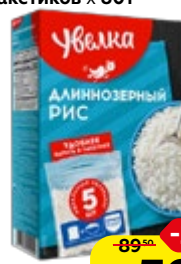
Рис УВЕЛКА , Длиннозерный, шлифованный, 5 пакетиков x 80 г