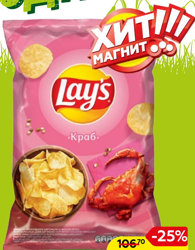
Чипсы LAY'S®, в ассортименте*, 150г