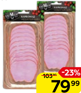
Карбонад EATMEAT® , Юбилейный, варено-копченый, 150 г