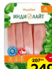
Стейк ИНДИЛАЙТ , из грудки индейки, охлажденный, 525 г