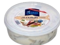
Сельдь 5 ОКЕАНОВ тихоокеанская, филе-кусочки в майонезном соусе, 350 г