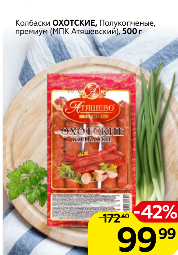
Колбаски ОХОТСКИЕ , Полукопченые, премиум (МПК Атяшевский), 500 г