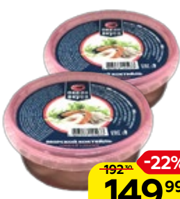
Коктейль морской ОКЕАН ВКУСА в рассоле, 300 г