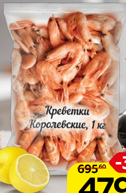
КРЕВЕТКИ КОРОЛЕВСКИЕ, с головой, варено-мороженые, 1 кг