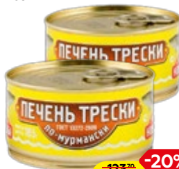
Печень трески ВКУСНЫЕ КОНСЕРВЫ По-мурмански, 185 г