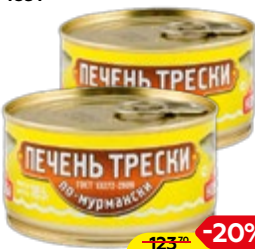
Печень трески ВКУСНЫЕ КОНСЕРВЫ По-мурмански, 185 г