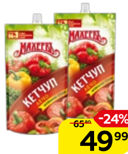
Кетчуп МАХЕЕВЪ Лечо, 300 г