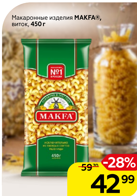
Макаронные изделия МАКФА®, виток, 450 г