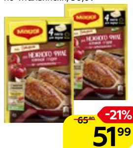
Приправа МАГГИ®, На второе, куриная грудка по-итальянски, 30,6 г