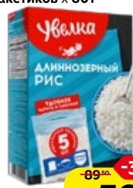
Рис УВЕЛКА , Длиннозерный, шлифованный, 5 пакетиков x 80 г