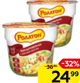
Пюре картофельное РОЛЛТОН Быстрого приготовления, с мясным вкусом, 40 г