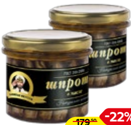
Шпроты КАПИТАН ВКУСОВ в масле, 250 г