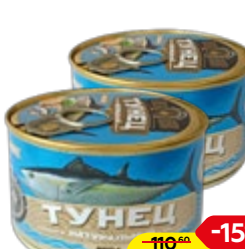
Тунец ЗНАК КАЧЕСТВА натуральный, 250 г