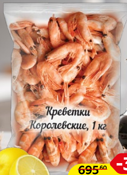
КРЕВЕТКИ КОРОЛЕВСКИЕ, с головой, варено-мороженые, 1 кг