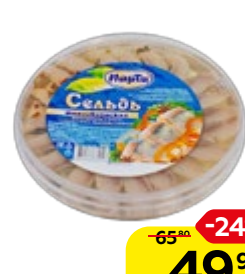
Сельдь МАРТИ Филе-кусочки в масле, с пряностями, 180 г