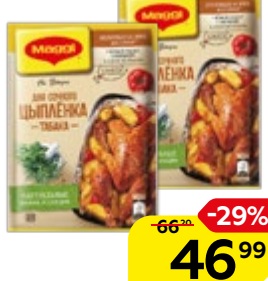
Приправа МАГГИ®, На второе, для сочного цыпленка табака, 47 г