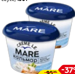
Кальмар КРЕМЕ ЛЯ МАРЕ рубленый, в классическом соусе, 150 г