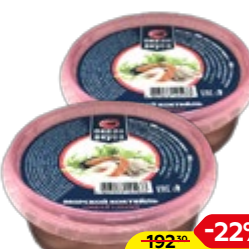
Коктейль морской ОКЕАН ВКУСА в рассоле, 300 г