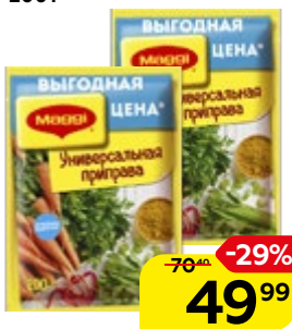
Приправа МАГГИ®, Универсальная, овощная, 200 г