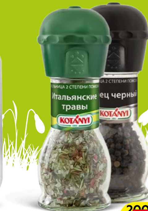
Приправы КОТАНИ, Мельница: Чеснок-травы-соль, 50г/ Итальянские травы, 48г/Черный перец, 36г