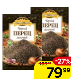
Перец черный ИНДАНА, молотый, 50 г