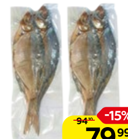
Рыба ЛЕЩ, вяленая, 300 г