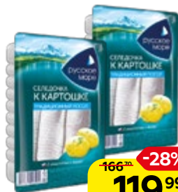
Филе сельди РУССКОЕ МОРЕ, к картошке, традиционный посол (Санта Бремор), 400 г