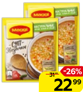
Суп МАГГИ®, Звездочки, 54 г