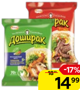
Лапша ДОШИРАК, Говядина/ Курица, 70 г