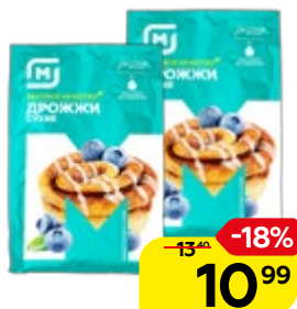
Дрожжи МАГНИТ Быстродействующие, 11 г