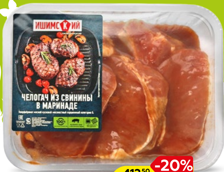
ЧЕЛОГАЧ из свинины в маринаде, 1кг