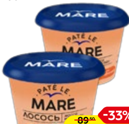
Лосось ПАТЕ ЛЕ МАРС, рубленый, подкопченный, 150 г