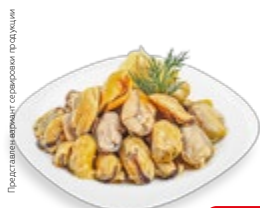
МЯСО МИДИЙ мороженое, 300 г