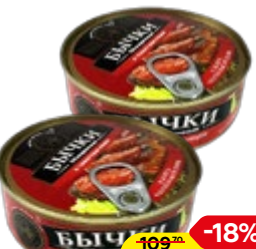
Бычки ЗНАК КАЧЕСТВА в томате, 240 г