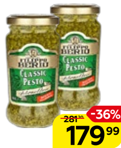
Соус ФИЛИППО БЕРИО Песто, классический, 190 г