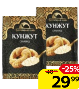
Семена кунжута ВОСТОЧНЫЙ ГОСТЬ, 40 г