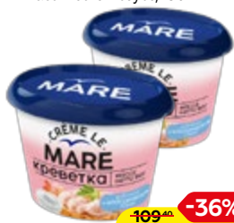
Креветки БАЛТИЙСКИЙ БЕРЕГ Крем Ле Марс, рубленые, в классическом соусе, 150 г