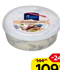
Сельдь 5 ОКЕАНОВ тихоокеанская, филе-кусочки в майонезном соусе, 350 г