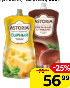
Соус майонезный АСТОРИЯ, Сметанный с грибами/ Сырный, 233 г