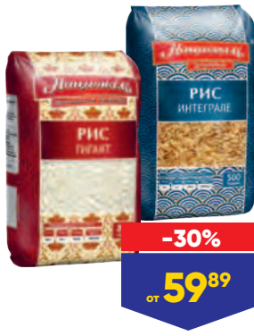
РИС НАЦИОНАЛЬ, 500-800 г, в ассортименте