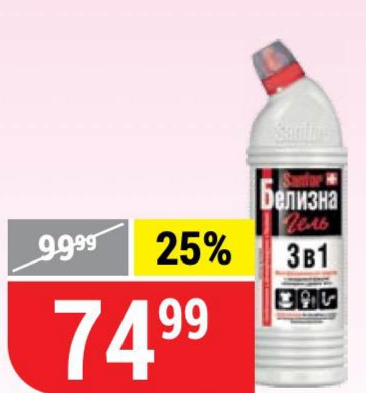
БЕЛИЗНА ГЕЛЬ SANFOR 3 в 1, 700 г