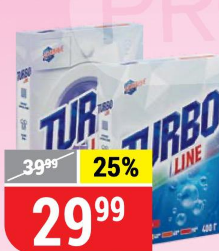
СТИРАЛЬНЫЙ ПОРОШОК TURBO LINE ручная стирка; автомат, 400 г