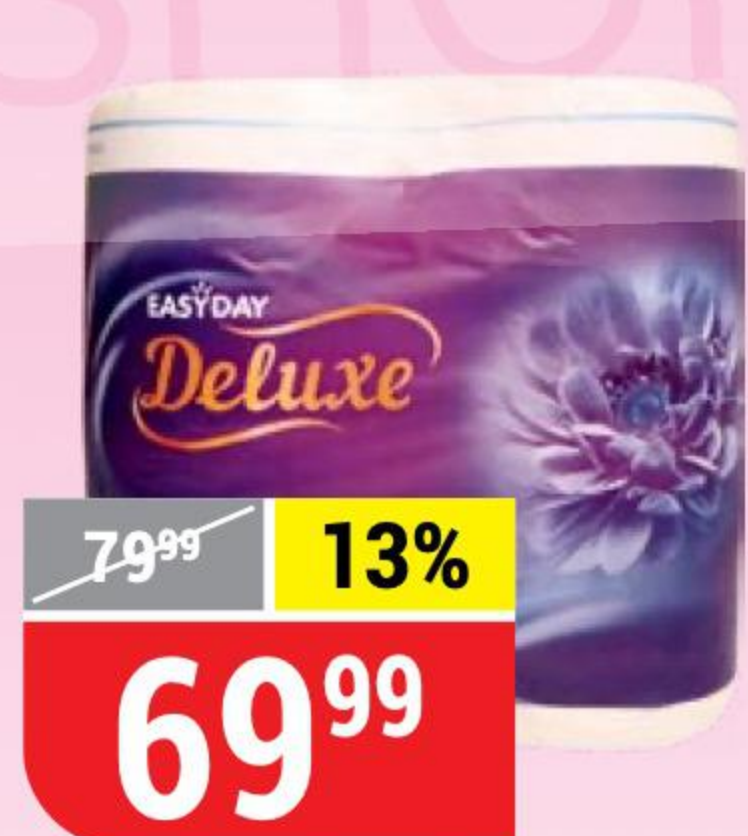
ТУАЛЕТНАЯ БУМАГА EASY DAY DELUXE белая, 3 слоя, 4 рул.