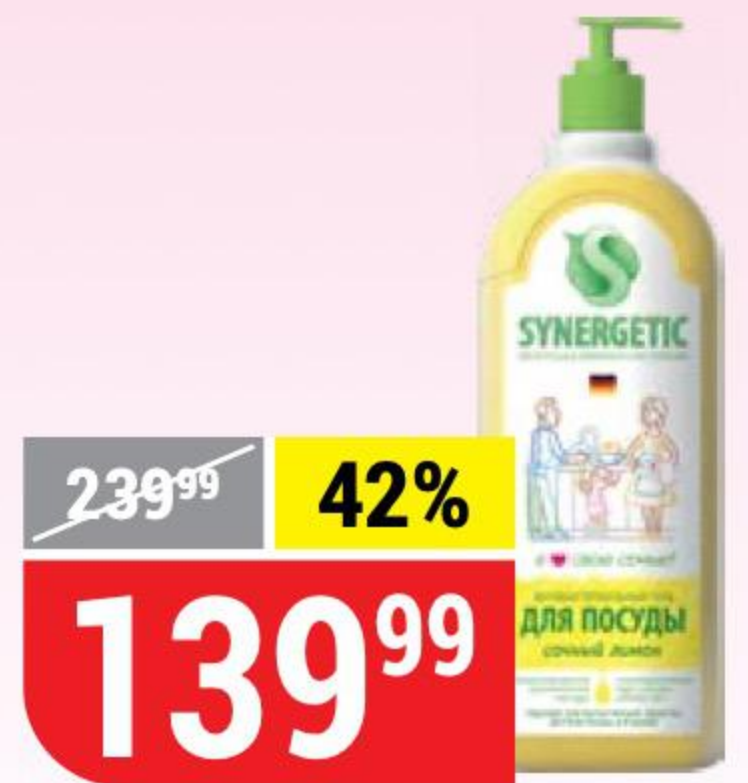
СРЕДСТВО ДЛЯ МЫТЬЯ ПОСУДЫ SYNERGETIC лимон, 1 л