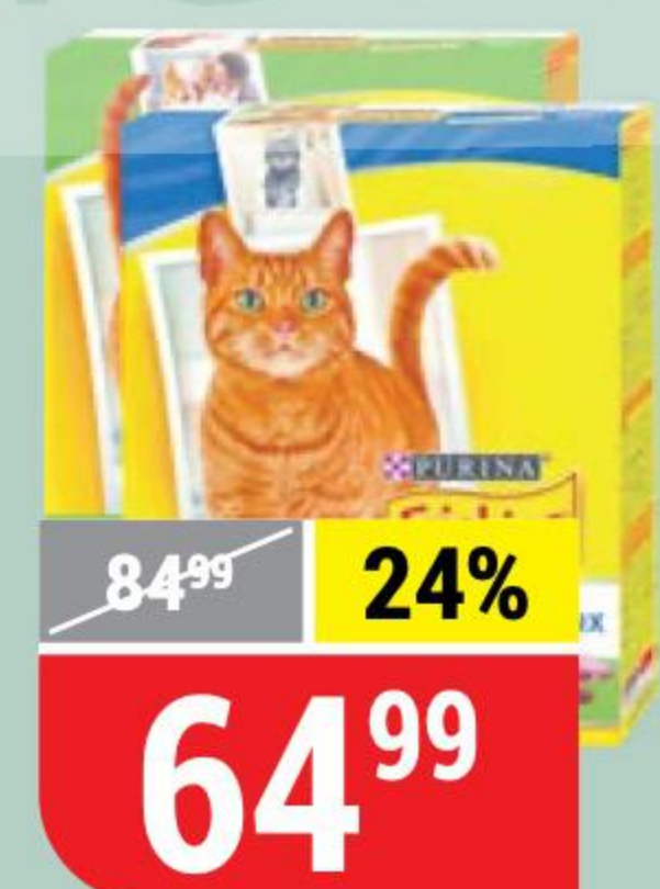
КОРМ ДЛЯ КОШЕК FRISKIES курица с садовой травой; для стерилизованных кошек, кролик с овощами, 300 г