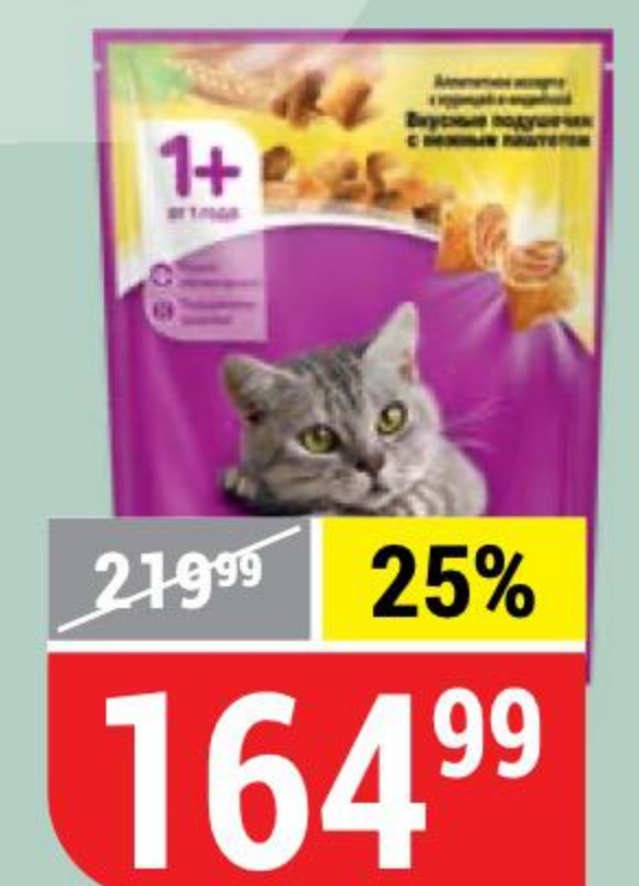
КОРМ ДЛЯ КОШЕК WHISKAS паштет, курица-индейка, 800 г