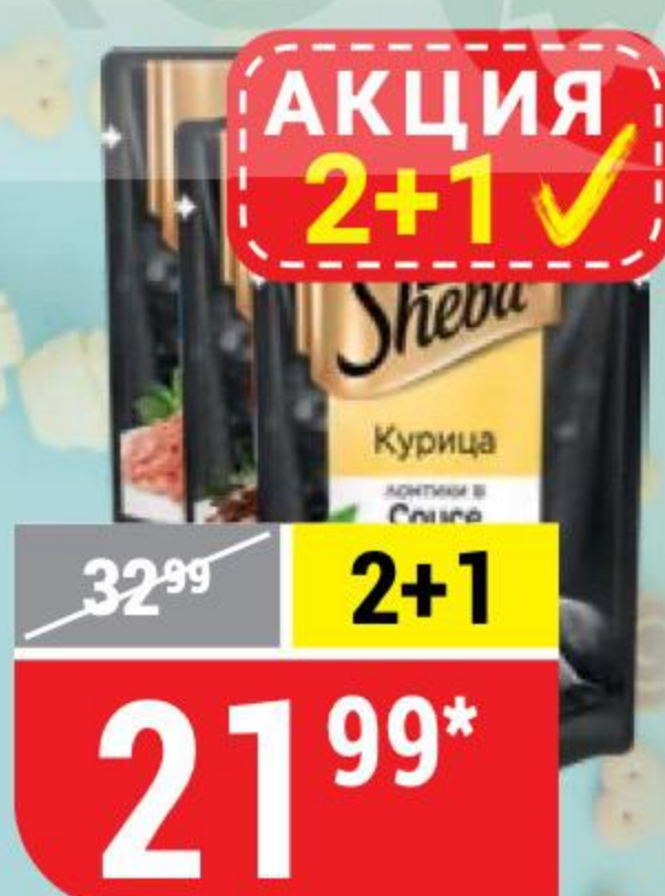
КОРМ ДЛЯ КОШЕК SHEBA PLEASURE в ассортименте, 85 г * Цена указана за 1 шт. при покупке 3 шт. одновременно