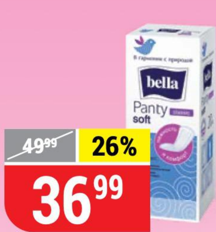
ПРОКЛАДКИ ЕЖЕДНЕВНЫЕ BELLA panty soft, 20 шт.