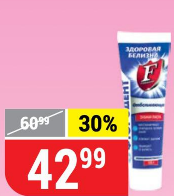
ЗУБНАЯ ПАСТА ФТОРОДЕНТ отбеливающая, 125 г