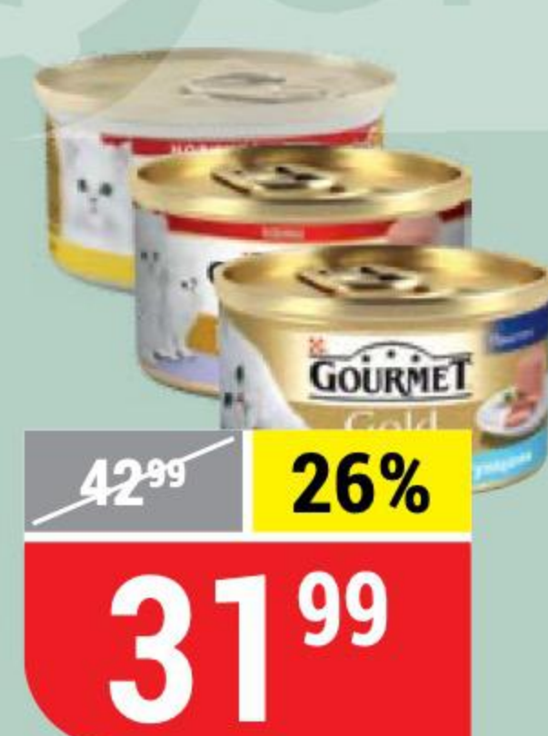
КОРМ ДЛЯ КОШЕК GOURMET GOLD в ассортименте, 85 г