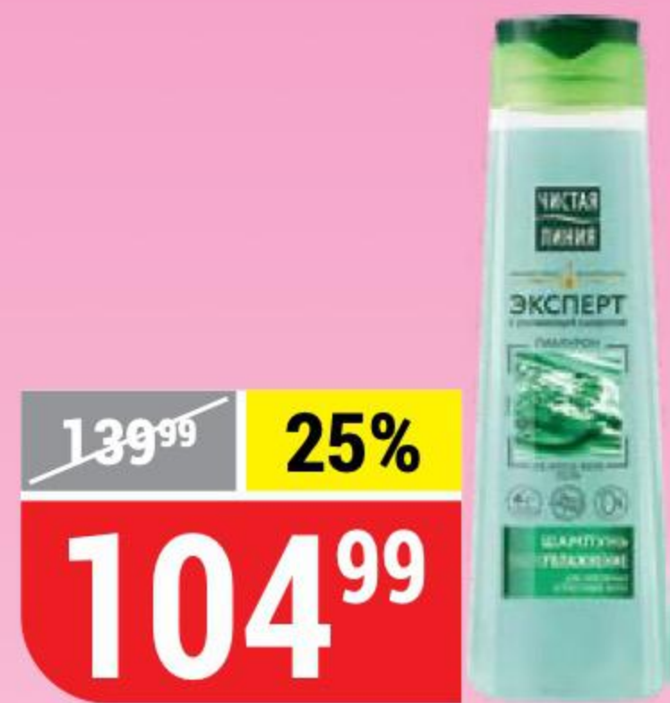
ШАМПУНЬ УЛЬТРАУВЛАЖНЕНИЕ Чистая Линия, 400 л