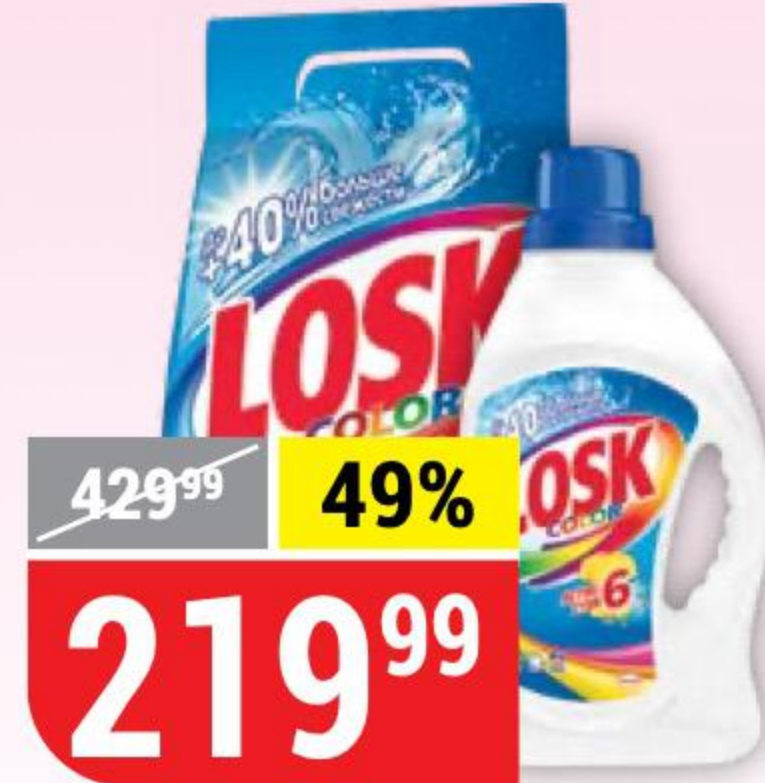
СРЕДСТВО ДЛЯ СТИРКИ LOSK color, порошок, автомат, 2,7 кг; гель, 1,3 л