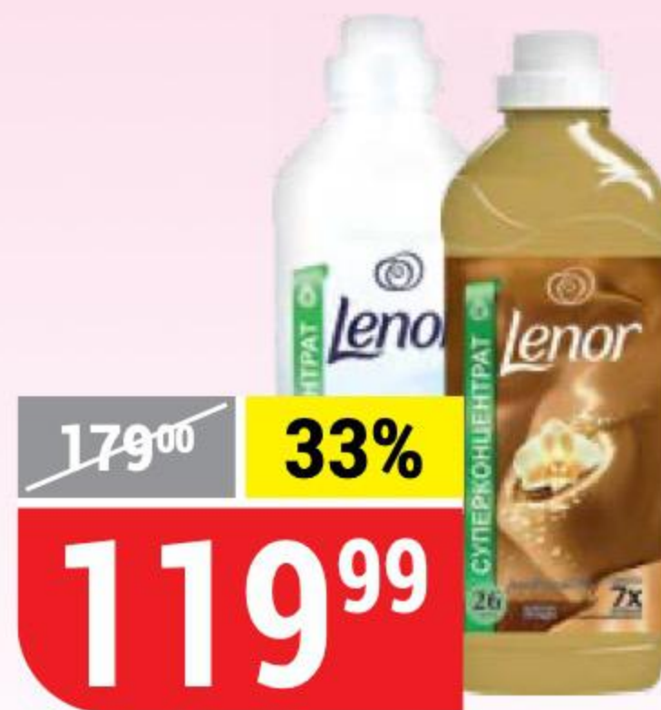
КОНДИЦИОНЕР ДЛЯ БЕЛЬЯ LENOR золотая орхидея; для чувствительной детской кожи, 0,93-1 л