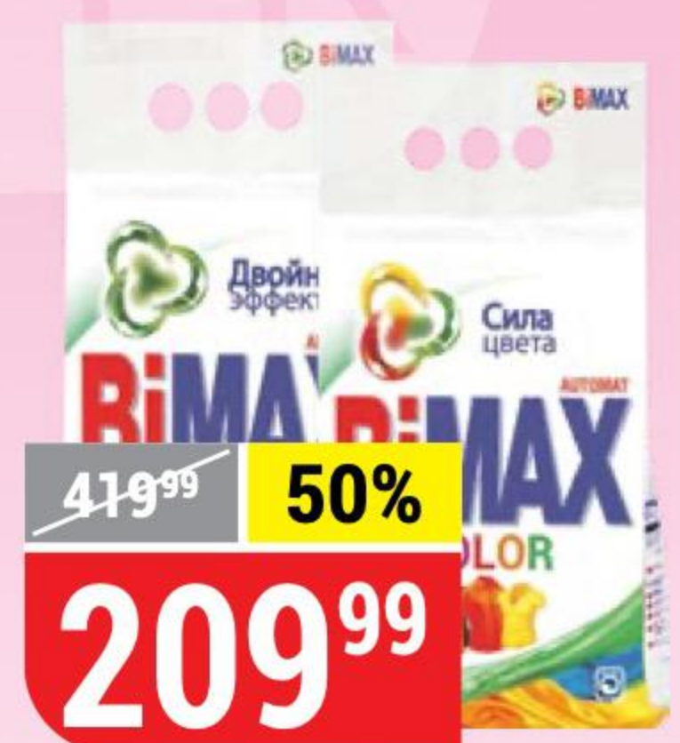
СТИРАЛЬНЫЙ ПОРОШОК VIMAX 100 пятен; color, автомат, 3 кг