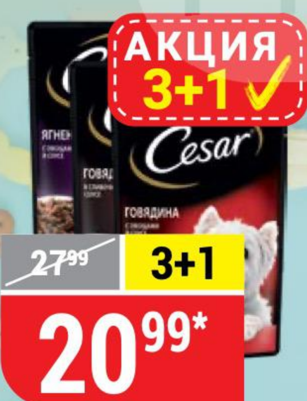
КОРМ ДЛЯ СОБАК CESAR в ассортименте, 85 г * Цена указана за 1 шт. при покупке 4 шт. одновременно