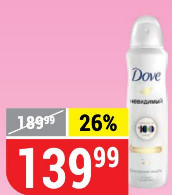
ДЕЗОДОРАНТ- АНТИПЕРСПИРАНТ DOVE женский, невидимый, 150 мл