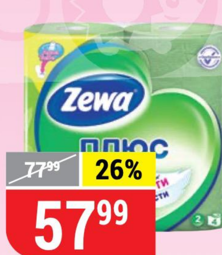
ТУАЛЕТНАЯ БУМАГА ZEWA ПЛЮС яблоко, 2 слоя, 4 рул.