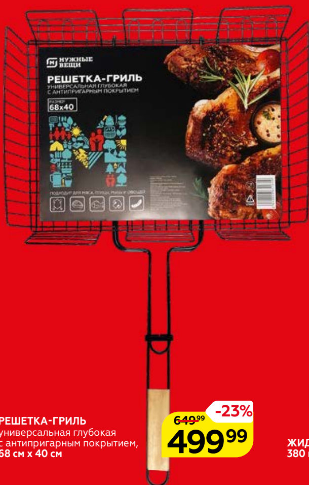
РЕШЕТКА-ГРИЛЬ универсальная глубокая с антипригарным покрытием, 68 см x 40 см