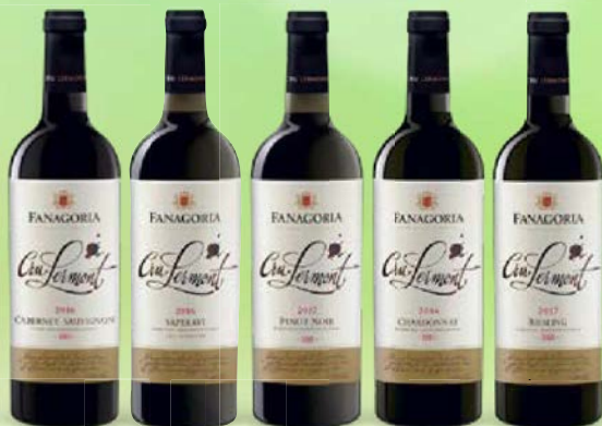
Вино ФАНАГОРИЯ, Крю Лермонт, выдержанное, сухое, в ассортименте*, 0,75 л