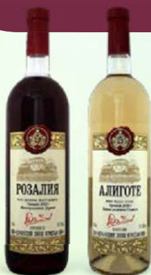
Вино РОЗАЛИЯ, Розовое полусладкое/ АЛИГОТЕ, Белое сухое, 0,75 л