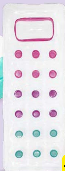
Матрац ФЕШН ЛАУНДЖ в ассортименте*, 188x71 см