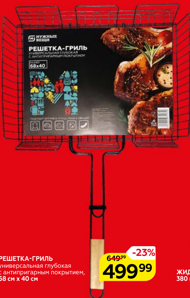
РЕШЕТКА-ГРИЛЬ универсальная глубокая с антипригарным покрытием, 68 см x 40 см