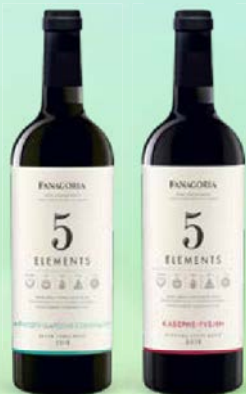
Вино ФАНАГОРИЯ, 5 Элемент, сухое: Каберне-Рубин, красное/ Алиготе-Шардоне-Сови- ньон, белое, 0,75 л