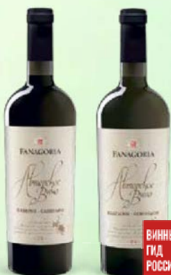
Вино ФАНАГОРИЯ, Авторское, сухое: Шардоне-Совиньон, белое/ Каберне-Сапе- рави, красное, 0,75 л