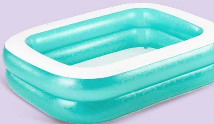
БАСЕЙН прямоугольный, 201x150x51 см