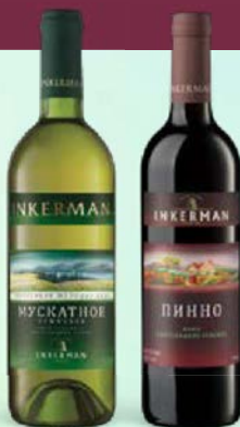
Вино ИНКЕРМАН, Мускатное, белое полусладкое/ Пинно, красное полусладкое, 0,7 л