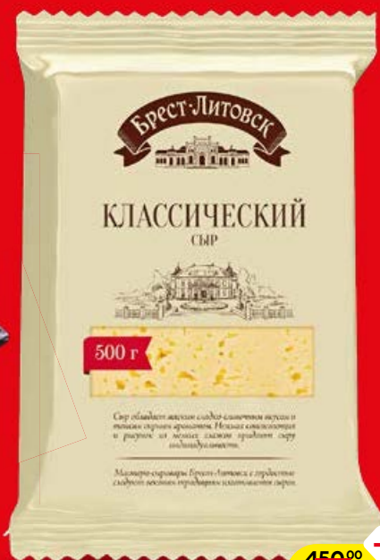
Сыр БРЕСТ-ЛИТОВСК, Классический, 45%, 500 г