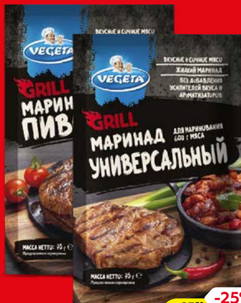
Маринад ВЕГЕТА, Гриль: Универсальный/ С пивом, 75 г