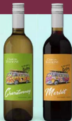
Вино ШАТО ТАМАНЬ, Вайн Серфинг: Мерло, красное полусладкое/ Шардоне, белое полусладкое, 0,75 л