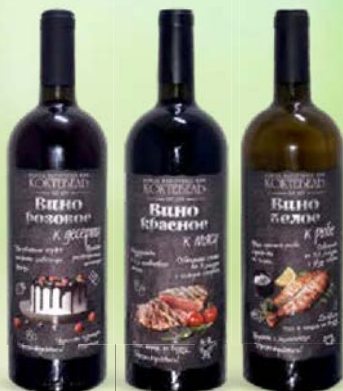
Вино КОКТЕБЕЛЬ, К мясу, красное сухое/ К десерту, розовое полусухое/ К рыбе, белое сухое, 0,75 л