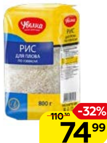
Рис УВЕЛКА , для плова по-узбекски, 800 г