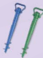
ПОДСТАВКА ПОД ЗОНТ, 10x44 см