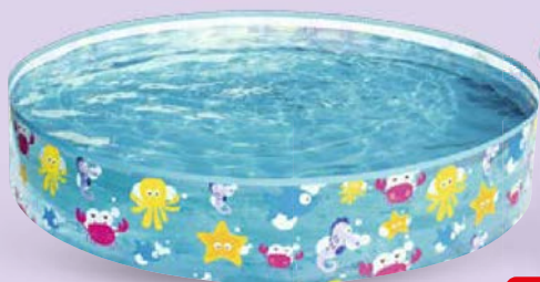
БАСЕЙН Бэствэй с жестким бортом 183x38 см