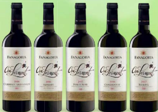
Вино ФАНАГОРИЯ, Крю Лермонт, выдержанное, сухое, в ассортименте*, 0,75 л