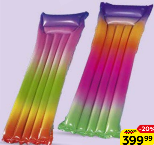
Матрац БЕСТВЕЙ , для плавания Градиент