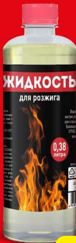
ЖИДКОСТЬ для РОЗЖИГА, 380 мл