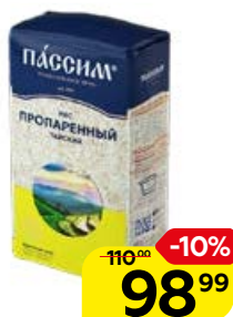
Рис ПАССИМ Тайский, пропаренный, 800 г