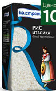
Рис МИСТРАЛЬ Италика белый круглозерный, 1 кг