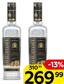
Водка ШУСТОФФ Премиум Голд, особая, 40%, 0,5 л