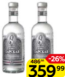
Водка ЦАРСКАЯ, Оригинальная, 40%, 0,5 л