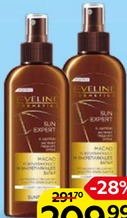
Масло ЭВЕЛИН, Для закрепле- ния загара, 150 мл