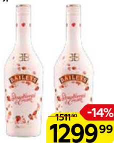
Ликер BAILEYS®, с ароматом клубники и сливок, 17%, 0,7 л