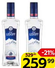
Водка ГРАФ ЛЕДОФФ, гуала 40%, 0,5 л