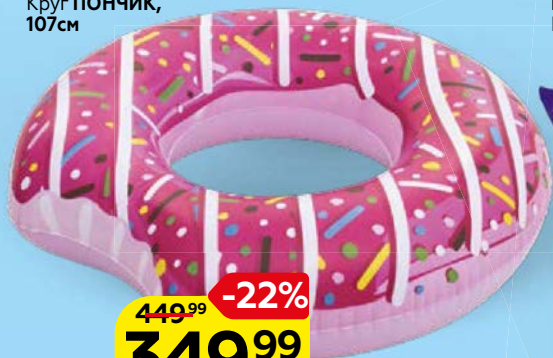
Круг ПОНЧИК, 107см