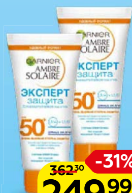
Крем солнцезащитный GARNIER®, Амбр Солер, SPF50+, 50 мл