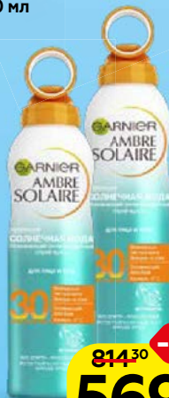
Вода солнцезащитная GARNIER®, Амбр Солер, SPF30, 200 мл