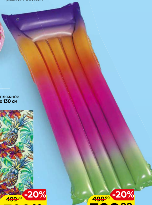
МАТРАС ДЛЯ ПЛАВАНИЯ Градиент Бествэй