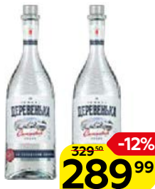
Водка ЗИМНЯЯ ДЕРЕВЕНЬКА, солодовая, 40%, 0,5 л