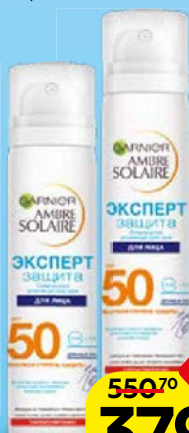
Спрей GARNIER®, Амбр Солер, солнцезащитный, для лица, SPF50+, 75 мл