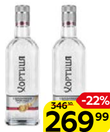
Водка ХОРТИЦА, Серебряная прохлада, 40%, 0,5 л