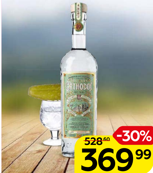
Водка ОРТОДОКС, 40%, 0,5 л