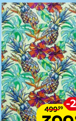
ПОЛОТЕНЦЕ пляжное махровое, 70 x 130 см