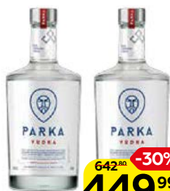
Водка ПАРКА 40%, 0,7 л