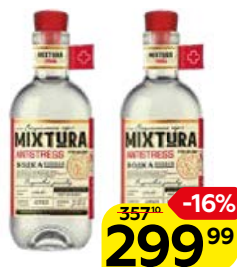
Водка МИКСТУРА особая Антистресс 40%, 0,5 л