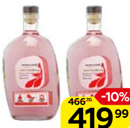
Водка плодовая СТРАНА КАМНЕЙ, Кизил, 40%, 0,5 л