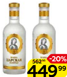
Водка ЦАРСКАЯ, Золотая, 40%, 0,5 л