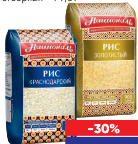
РИС НАЦИОНАЛЬ, 900 г - золотистый - 74,89 - краснодарский, отборный - 79,89