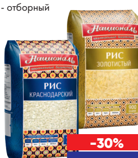
РИС НАЦИОНАЛЬ, 900 г - красnodарский - золотистый - отборный