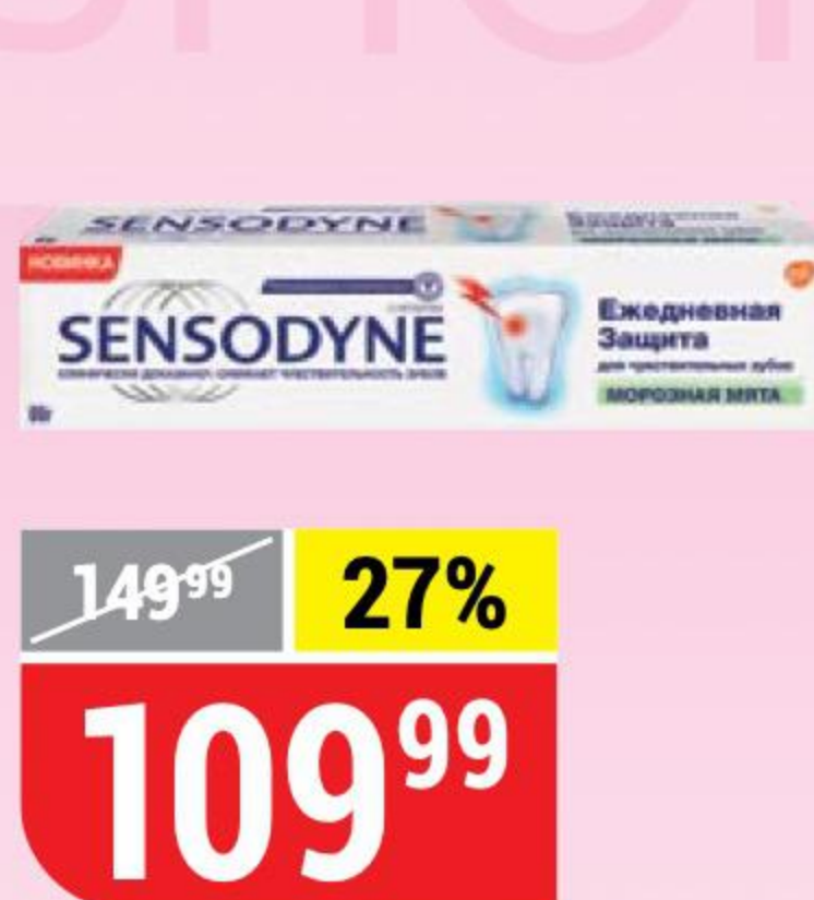
ЗУБНАЯ ПАСТА SENSODYNE морозная мята, для чувствительных зубов, 65 г 145355