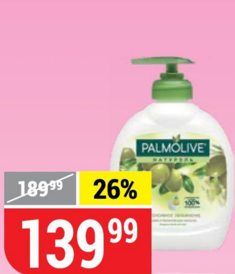
МЫЛО PALMOLIVE НАТУРЭЛЬ оливковое молочко, жидкое, 300 мл 101825