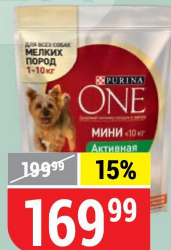
КОРМ ДЛЯ СОБАК PURINA ONE для мелких пород, курица-рис, 600 г 116720