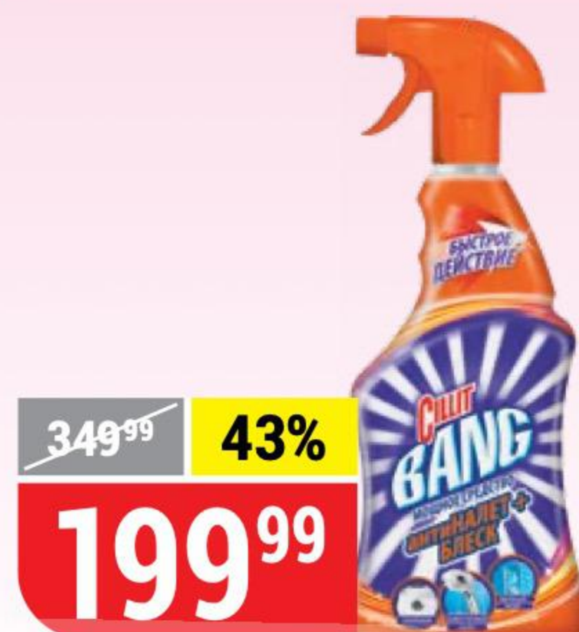
ЧИСТЯЩЕЕ СРЕДСТВО CILLIT BANG антиналет+блеск, 750 мл 120679