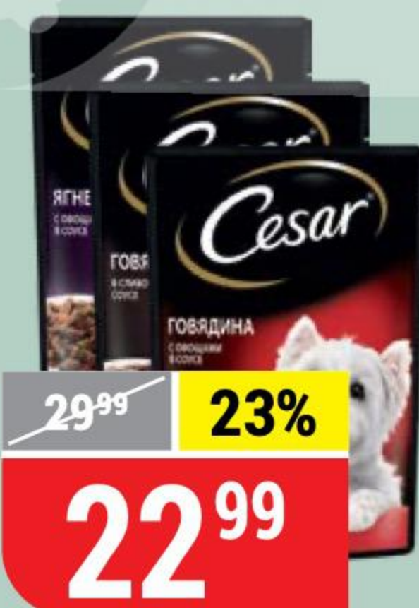
КОРМ ДЛЯ СОБАК CESAR в ассортименте, 85 г 146066/146067/146068/146564