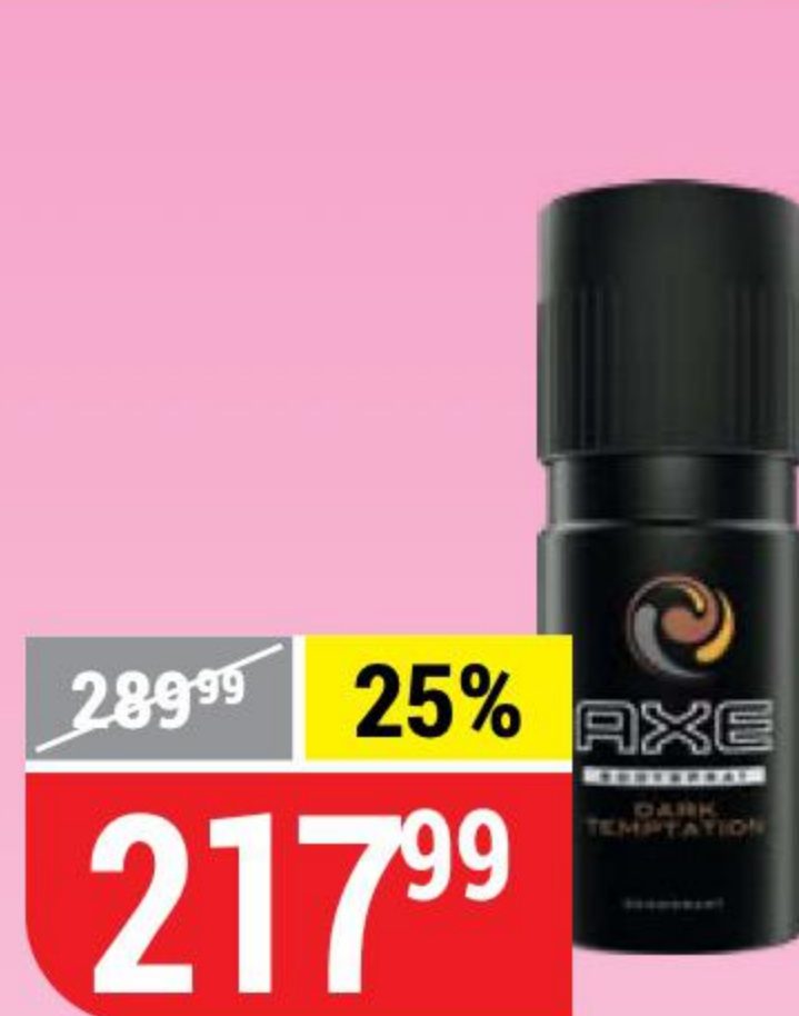
ДЕЗОДОРАНТ AXE мужской, dark temptation, 150 мл 139372