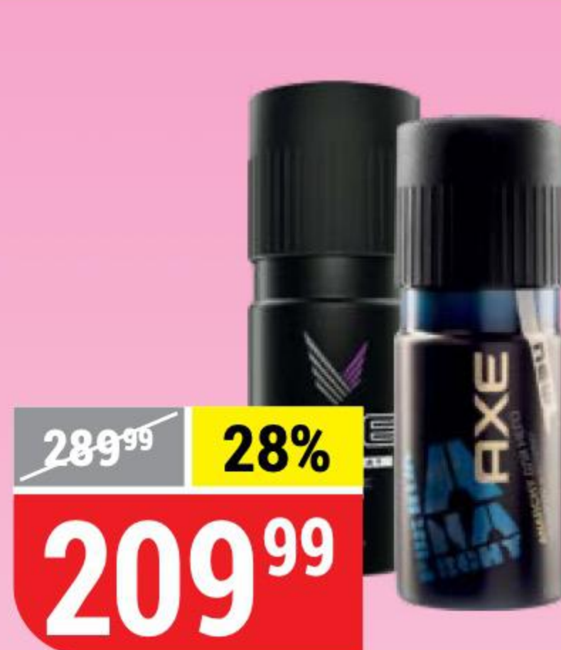
ДЕЗОДОРАНТ AXE мужской, excite; anarchy, 150 мл 139374/140637