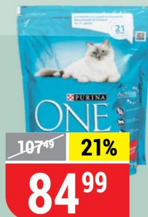
КОРМ ДЛЯ КОШЕК PURINA ONE для стерилизованных кошек, лосось-пшеница, 200 г 102222