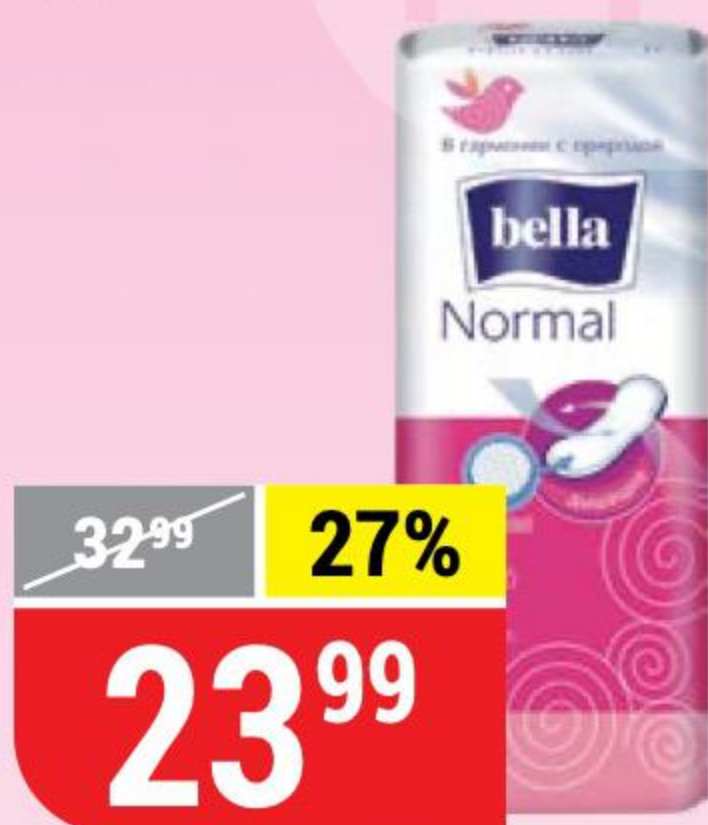
ПРОКЛАДКИ BELLA normal , 10 шт. 123273