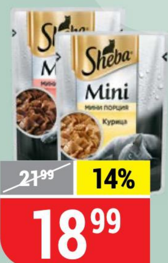
КОРМ ДЛЯ КОШЕК SHEBA в ассортименте, 50 г 128454/128455