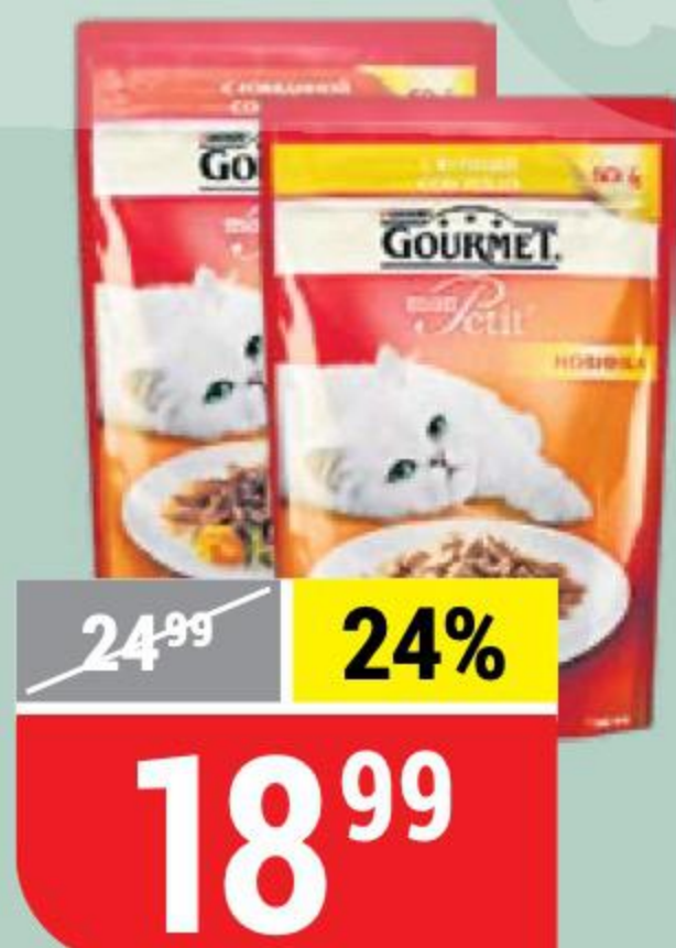
КОРМ ДЛЯ КОШЕК GOURMET в ассортименте, 50 г 121170/121171