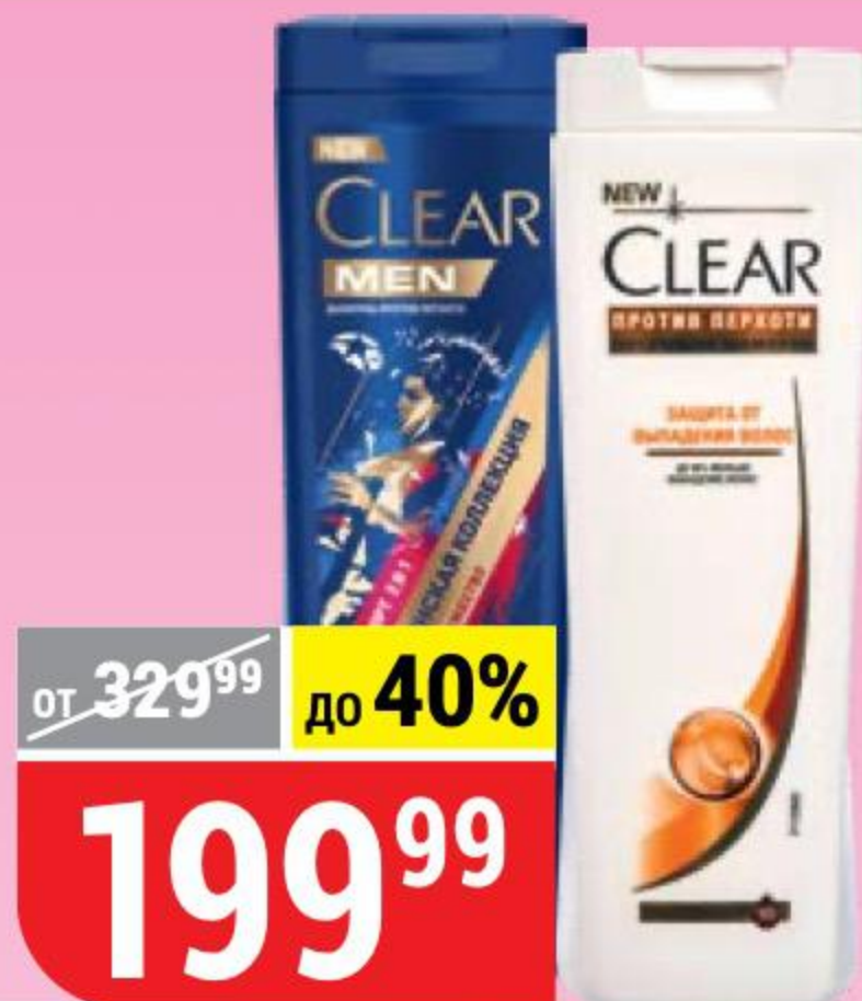
ШАМПУНЬ CLEAR VITA ABE в ассортименте, 400 мл 143617/143766