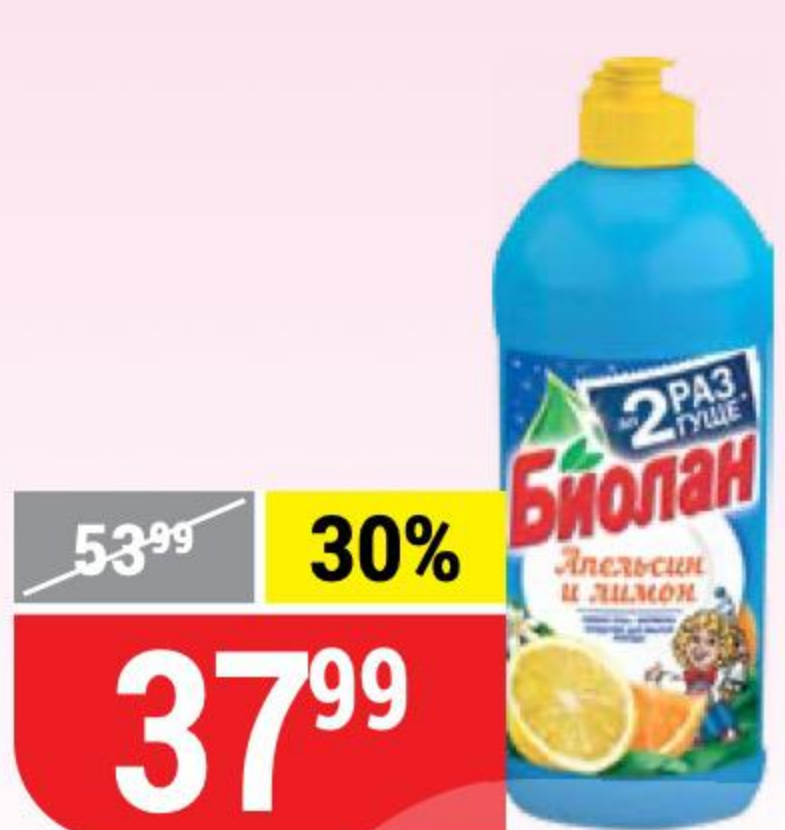
СРЕДСТВО ДЛЯ МЫТЬЯ ПОСУДЫ БИОЛАН апельсин и лимон, 450 г 132416