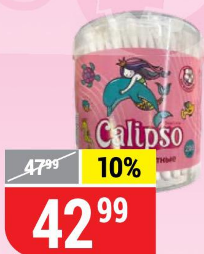
ВАТНЫЕ ПАЛОЧКИ CALIPSO стакан, 200 шт. 140612