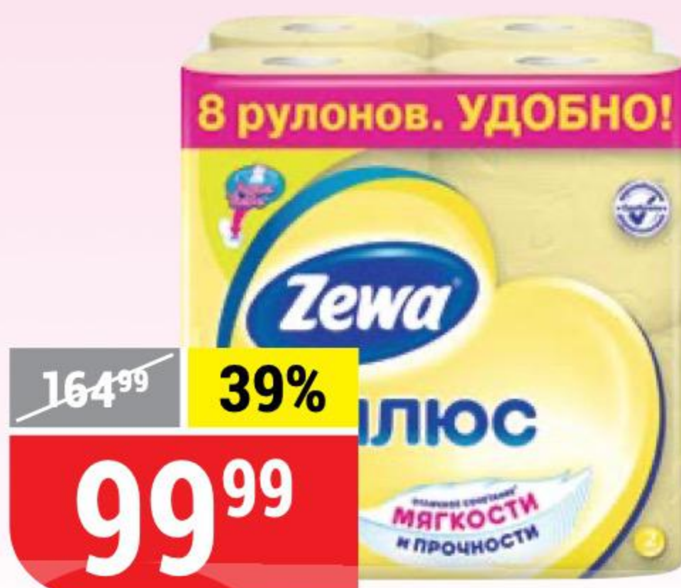
ТУАЛЕТНАЯ БУМАГА ZEWA ПЛЮС ромашка, 2 слоя, 8 рул. 106990