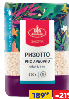
РИС АГРО-АЛЬЯНС ЭКСТРА РИЗOTTO, 1 сорт, 500 г