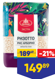
РИС АГРО-АЛЬЯНС ЭКСТРА РИЗOTTO, 1 сорт, 500 г