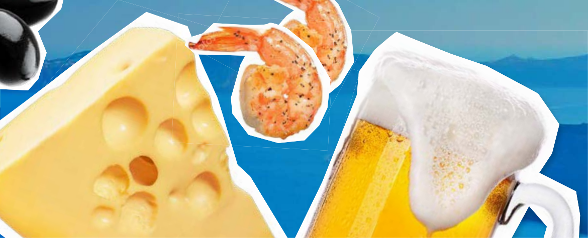
Пиво ПИЛСНЕР УРКЕЛЬ, Светлое, 4,4%, 0,33 л