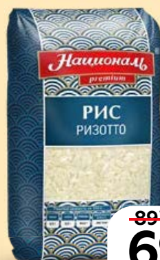
Рис НАЦИОНАЛЬ , Ризотто, 500 г