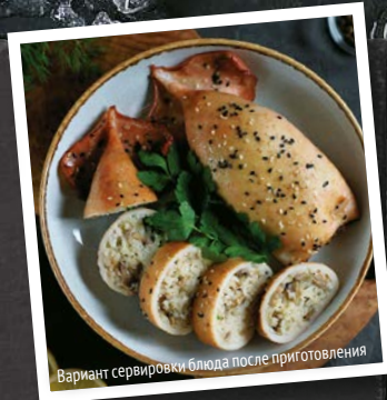
Вариант сервировки блюда после приготовления

Для начинки мелко порезать лук и грибы. Сыр натереть на крупной терке. На сковороде разогреть растительное масло, выложить лук и жарить 5–10 минут до легкой золотистости. Добавить грибы, жарить 15–20 минут, пока не выпарится вся выделяющаяся жидкость. Посолить, поперчить. В емкость сложить рис, жаренные грибы, сыр. Добавить 1–2 ст. л. сметаны (или майонеза), перемешать. Начинка готова.