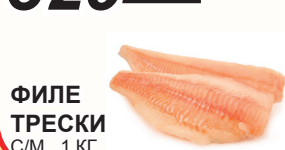
ФИЛЕ ТРЕСКИ С/М, 1 КГ