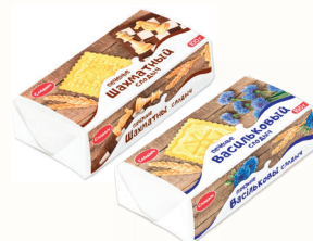
ПЕЧЕНЬЕ САХАРНОЕ "СЛОДЫЧ" В АССОРТИМЕНТЕ, 100 ГР