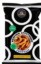
СУШКИ КОЛЕЧКИ "КАРАВАЙ" СОЛЕННЫЕ, 80 ГР