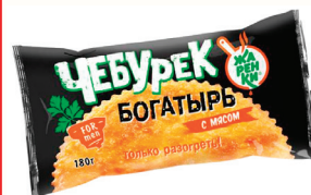
ЧЕБУРЕК "БОГАТЫРЬ" С МЯСОМ, 180 ГР