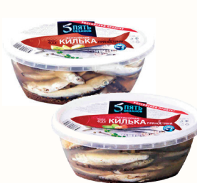
КИЛЬКА "5 ОКЕАНОВ", В АССОРТИМЕНТЕ, 400 ГР