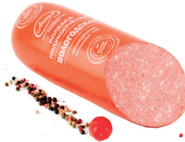
КОЛБАСА "ВОЛОГОДСКАЯ" П/К "АНКОМ", 1 КГ