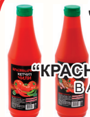
КЕТЧУП "КРАСНОДАРОЧКА" В АССОРТИМЕНТЕ, 900 ГР