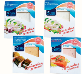
КРЕМ РЫБНЫЙ "5 ОКЕАНОВ" В АССОРТИМЕНТЕ, 140 ГР