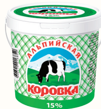
ПРОДУКТ СМЕТАННЫЙ "АЛЬПИЙСКАЯ КОРОВКА", 15%, 900 ГР Продажа только на Косыгина, 21