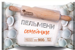
ПЕЛЬМЕНИ "СЕМЕЙНЫЕ" "КУЛИНАРНЫЕ РЕШЕНИЯ" 900 ГР