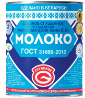
МОЛОКО СГУЩЕННОЕ "ГЛУБОКОЕ" ЦЕЛЬНОЕ С САХАРОМ 8,5%, 380 ГР