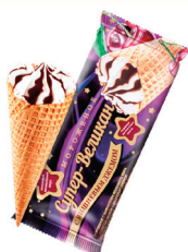
МОРОЖЕНОЕ "СУПЕР-ВЕЛИКАН" ВАНИЛЬНОЕ С ВИШНЕВЫМ ДЖЕМОМ В САХАРНОМ РОЖКЕ, 100 ГР