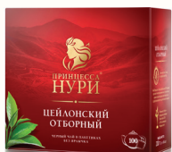
ЧАЙ "ПРИНЦЕССА НУРИ" ОТБОРНЫЙ ЦЕЙЛОНСКИЙ ЧЕРНЫЙ БАЙХОВЫЙ, 100 ПАК. Б/Я