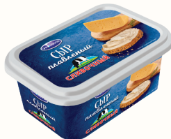
СЫР ПЛАВЛЕННЫЙ "ЭКОМИЛК" СЛИВОЧНЫЙ 55%, 400 ГР