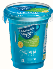
СМЕТАНА ЛЕГКАЯ "БОЛЬШАЯ КРУЖКА" 10%, 315 ГР