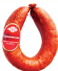
КОЛБАСА "КРАКОВСКАЯ" В/К "СОВАД", 300 ГР