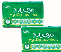
СПРЕД "ХАЛЯЛЬ ТРАДИЦИОННОЕ" 82%, 180 ГР