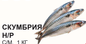
СКУМБРИЯ Н/Р С/М, 1 КГ