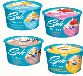
ЙОГУРТ "ЭКОМИЛК СОЛО" В АССОРТИМЕНТЕ 4,2%, 130 ГР