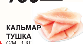
КАЛЬМАР ТУШКА С/М, 1 КГ