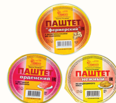
ПАШТЕТ В АССОРТИМЕНТЕ, ВНМД, 90 ГР