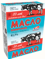
БЗМЖ МАСЛО СЛАДКО-СЛИВОЧНОЕ НЕСОЛЕННОЕ 82,5%, 180 ГР