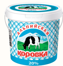
ПРОДУКТ СМЕТАННЫЙ "АЛЬПИЙСКАЯ КОРОВКА", 20%, 900 ГР