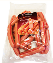
СОСИСКИ "ОСОБЕННЫЕ С ГОВЯДИНОЙ" ВАР. ФК ЛАДОГА, 1 КГ