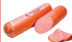
КОЛБАСА "ЛЮБИТЕЛЬСКАЯ" НОВИНКА ВАР. ВНМД, 1 КГ Продажа только на Косыгина, 21