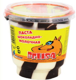
ПАСТА "БЕЛИСА" ШОКОЛАДНО-МОЛОЧНАЯ, 400 ГР