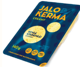
СЫР "ЯЛО КРЕМА" СЛИВОЧНЫЙ 50%, 140 ГР