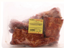
РЕБРА К/В "ИНЕЙ", 1 КГ