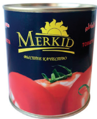
ТОМАТНАЯ ПАСТА "МЕРКИД", 790 ГР