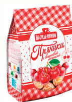
ПРЯНИКИ "ПОСИДЕЛКИНО" КЛАССИЧЕСКИЕ МИНИ С ВИШНЕВОЙ НАЧИНКОЙ, 300 ГР