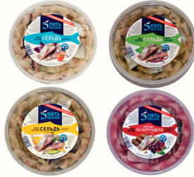
СЕЛЬДЬ ФИЛЕ КУСОЧКИ В МАСЛЕ "5 ОКЕАНОВ" В АССОРТИМЕНТЕ, 500 ГР