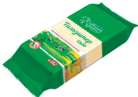
БЗМЖ СЫР "ТИЛЬЗИТЕР" "СЛИВОЧНАЯ ИСТОРИЯ" 45%, 200 ГР