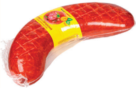
СЕРВЕЛАТ "ЛИТОВСКИЙ" В/К Н/О БАРАНЬЯ СИНЮГА "ИНЕЙ", 1 КГ Продажа только на Косыгина, 21