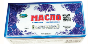
МАСЛО СЛИВОЧНОЕ ТРАДИЦИОННОЕ "БЛАГОРУССКОЕ" 82,5%, 500 ГР