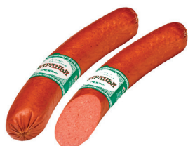
КОЛБАСА "БАРАНЬЯ" П/К "ЛАДОГА", 300 ГР