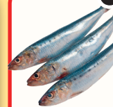
САРДИНА Н/Р С/М, 1 КГ