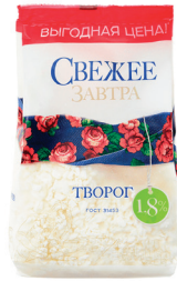
ТВОРОГ "СВЕЖЕЕ ЗАВТРА", ОБЕЗЖИРЕННЫЙ 1,8%, 400 ГР