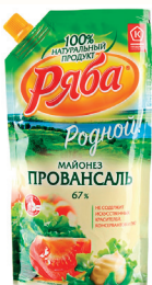
МАЙОНЕЗ "РЯБА" РОДНОЙ ПРОВАНСАЛЬ 67%, 400 ГР