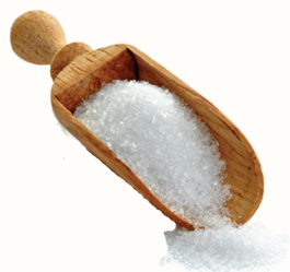
САХАРНЫЙ ПЕСОК, 1 КГ

ИНТЕРНЕТ-МАГАЗИН НАРОДНЫЙ №1 ЗАКАЖИ ТОВАРЫ НЕ ВЫХОДЯ ИЗ ДОМА!