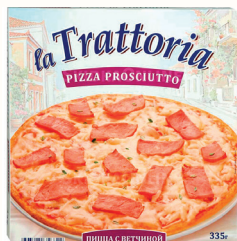
ПИЦЦА "ЛА ТРАТТОРИЯ" С ВЕТЧИНОЙ, 335 ГР