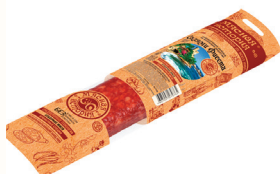
САЛЯМИ "ФИЕСТА" С/К "ИНЕЙ", 200 ГР