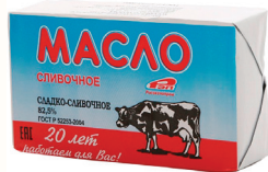
БЗМЖ МАСЛО СЛАДКО-СЛИВОЧНОЕ "РЭП" 82,5%, 450 ГР