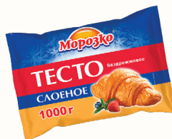
ТЕСТО "МОРОЗКО" СЛОЕНОЕ БЕЗДРОЖЖЕВОЕ, 1 КГ