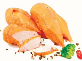
ФИЛЕ ГРУДКИ КУРИНОЕ В/К АНКОМ, 1 КГ