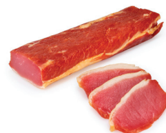
БАЛЫК СВИНОЙ "ТРАДИЦИОННЫЙ" С/К ФК "ЛАДОГА", 1 КГ