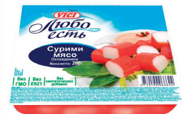
МЯСО СУРИМИ "ВИЧИ" "ЛЮБО ЕСТЬ" ОХЛ., 200 ГР