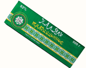
СПРЕД "ХАЛЯЛЬ ТРАДИЦИОННОЕ" РАСТИТЕЛЬНО-ЖИРОВОЙ 82%, 500 ГР