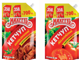
КЕТЧУП "МАХЕЕВЪ" ШАШЛИЧНЫЙ, ТОМАТНЫЙ 700 ГР