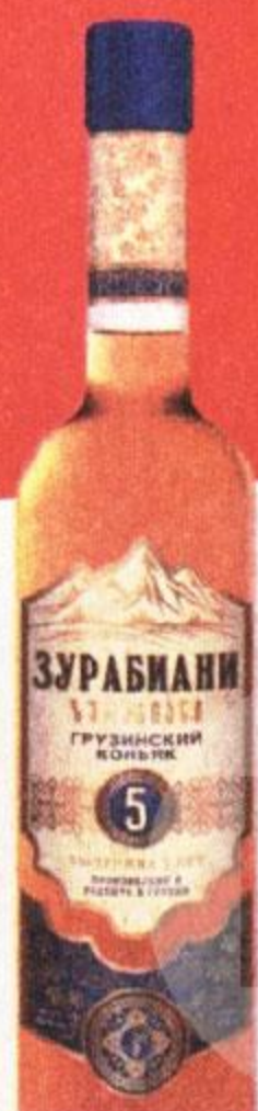
КОНЬЯК ЗУРАБИАНИ, ПЯТИЛЕТНИЙ, 0,5 Л