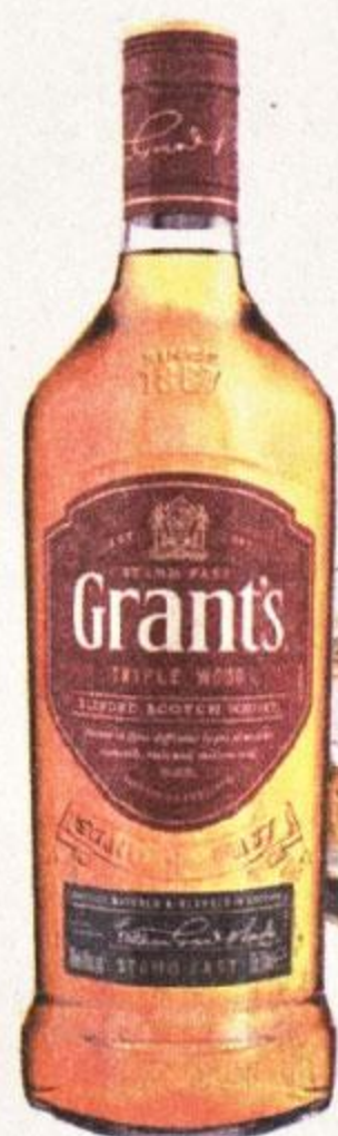
ВИСКИ ГРАНТС ТРИПЛ ВУД, КУПАЖИРОВАННЫЙ, ТРЕХЛЕТНИЙ, 0,5 Л