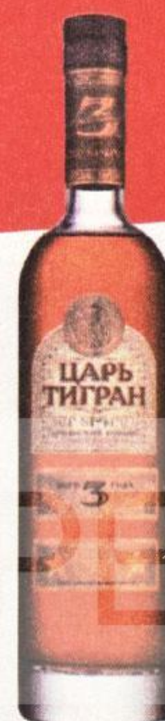
КОНЬЯК ЦАРЬ ТИГРАН, ТРЕХЛЕТНИЙ, 0,5 Л