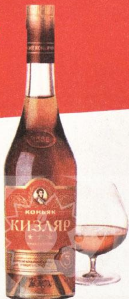
КОНЬЯК КИЗЛЯР, ТРЕХЛЕТНИЙ, 0,5 Л