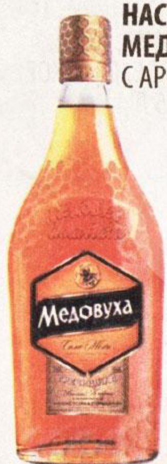
НАСТОЙКА ГОРЬКАЯ МЕДОВУХА ГРЕЧИШНАЯ, С АРОМАТОМ МЁДА, 0,5 Л