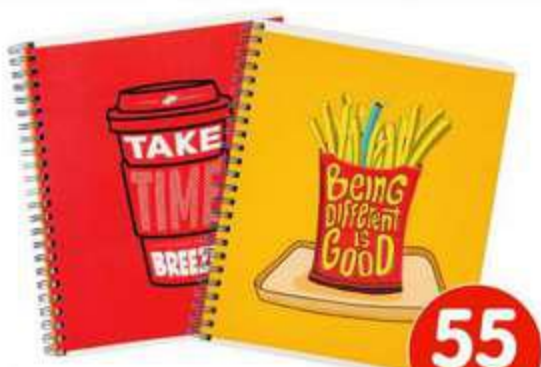
ТЕТРАДЬ В КЛЕТКУ НА СПИРАЛИ, А5, 96 ЛИСТОВ