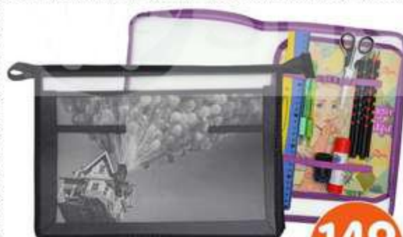
ПАПКА ДЛЯ ТРУДА, А4