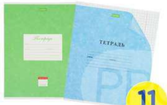
ТЕТРАДЬ, А5, 18 ЛИСТОВ