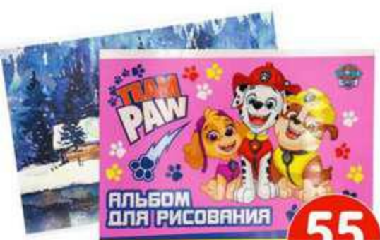
Альбом для рисования, А4, 40 ЛИСТОВ