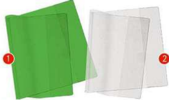
1. ОБЛОЖКА ДЛЯ УЧЕБНИКОВ, 5 ШТ., 50 РУБ. 2. ОБЛОЖКА ДЛЯ ТЕТРАДЕЙ И ДНЕВНИКОВ, 20 ШТ., 50 РУБ.