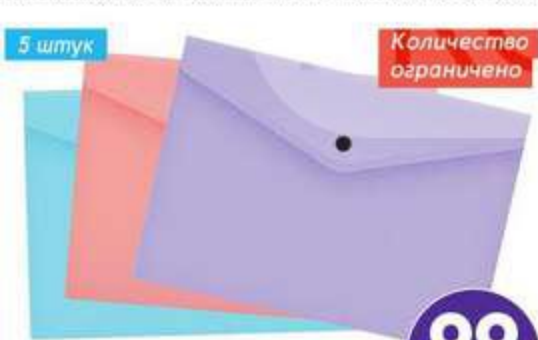
ПАПКА-КОНВЕРТ НА КНОПКЕ BERLINGO, А4