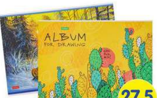
Альбом для рисования, А4, 24 ЛИСТА