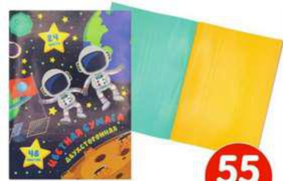
ЦВЕТНАЯ МЕЛОВАННАЯ БУМАГА, А4, 48 ЛИСТОВ, 24 ЦВЕТА