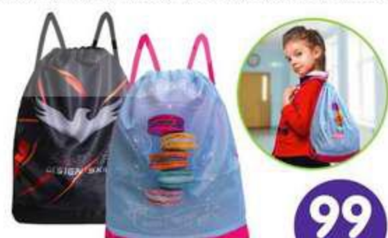
СУМКА ДЛЯ СМЕННОЙ ОБУВИ ЦВЕТНАЯ С РИСУНКОМ, 42x34 СМ