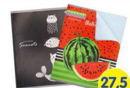
ТЕТРАДЬ В КЛЕТКУ, А5, 80 ЛИСТОВ