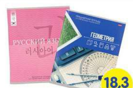
ТЕТРАДЬ ПРЕДМЕТНАЯ, А5, 48 ЛИСТОВ