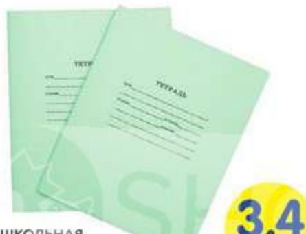
ТЕТРАДЬ ШКОЛЬНАЯ ЗЕЛЕНАЯ, А5, 12 ЛИСТОВ