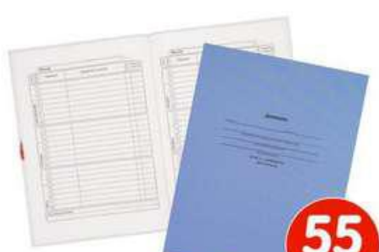
ДНЕВНИК ШКОЛЬНЫЙ, 40 ЛИСТОВ