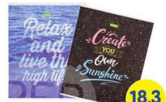
ТЕТРАДЬ В КЛЕТКУ, А5, 48 ЛИСТОВ