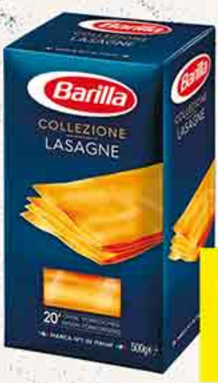
МАКАРОНЫ LASAGNE BARILLA 500 Г