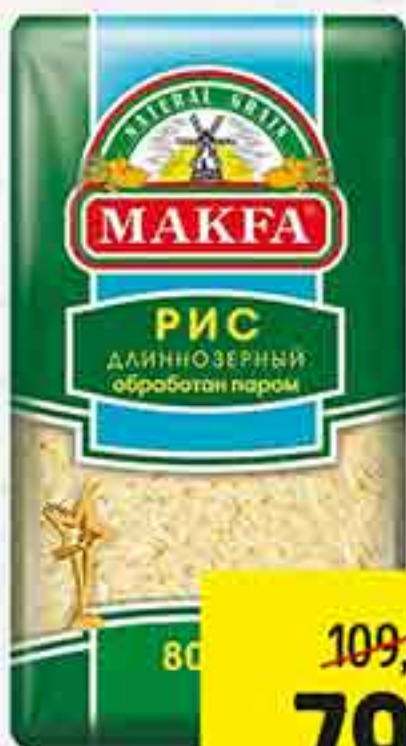
РИС ДЛИННОЗЁРНЫЙ ПРОПАРЕННЫЙ МАКФА 800 Г