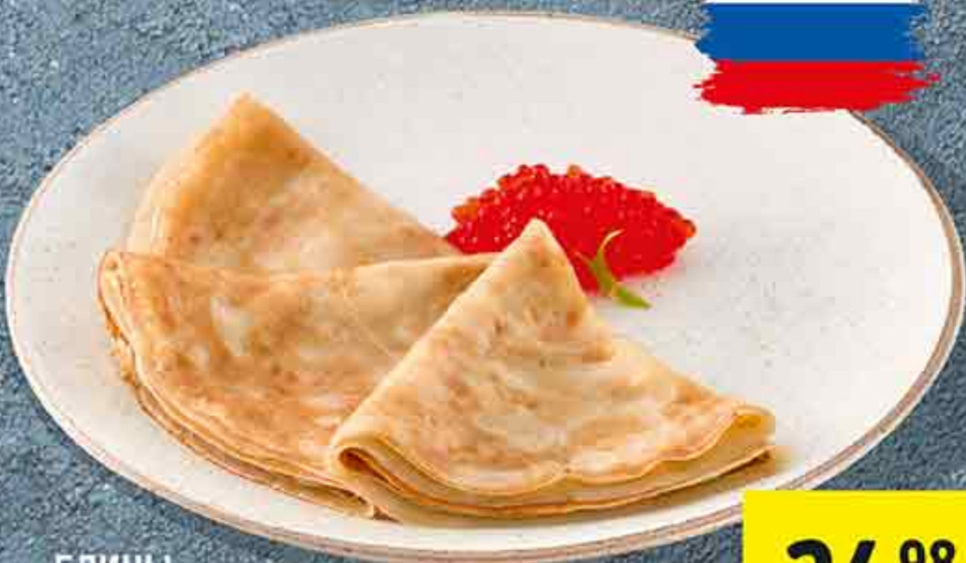
БЛИНЫ ДОМАШНИЕ 100 Г