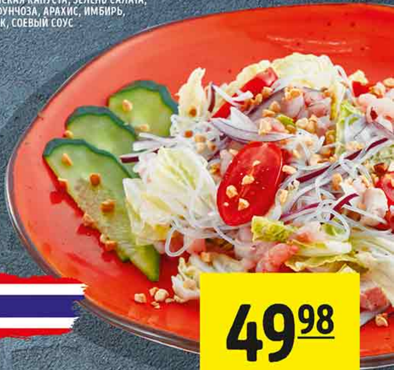
САЛАТ ТАЙСКИЙ КРЕВЕТКИ, КУРИЦА, ПОМИДОРЫ ЧЕРРИ, ПЕКИНСКАЯ КАПУСТА, ЗЕЛЕНЬ САЛАТА, ЛУК, ФУНЧОЗА, АРАХИС, ИМБИРЬ, ЧЕСНОК, СОЕВЫЙ СОУС 100 Г