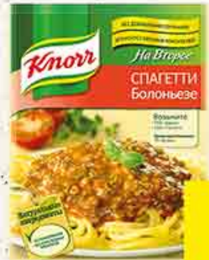
СМЕСЬ НА ВТОРОЕ ДЛЯ СПАГЕТТИ БОЛОНЬЕЗЕ KNORR 25 Г