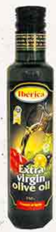
МАСЛО ОЛИВКОВОЕ EXTRA VIRGIN IBERICA 0,25 Л