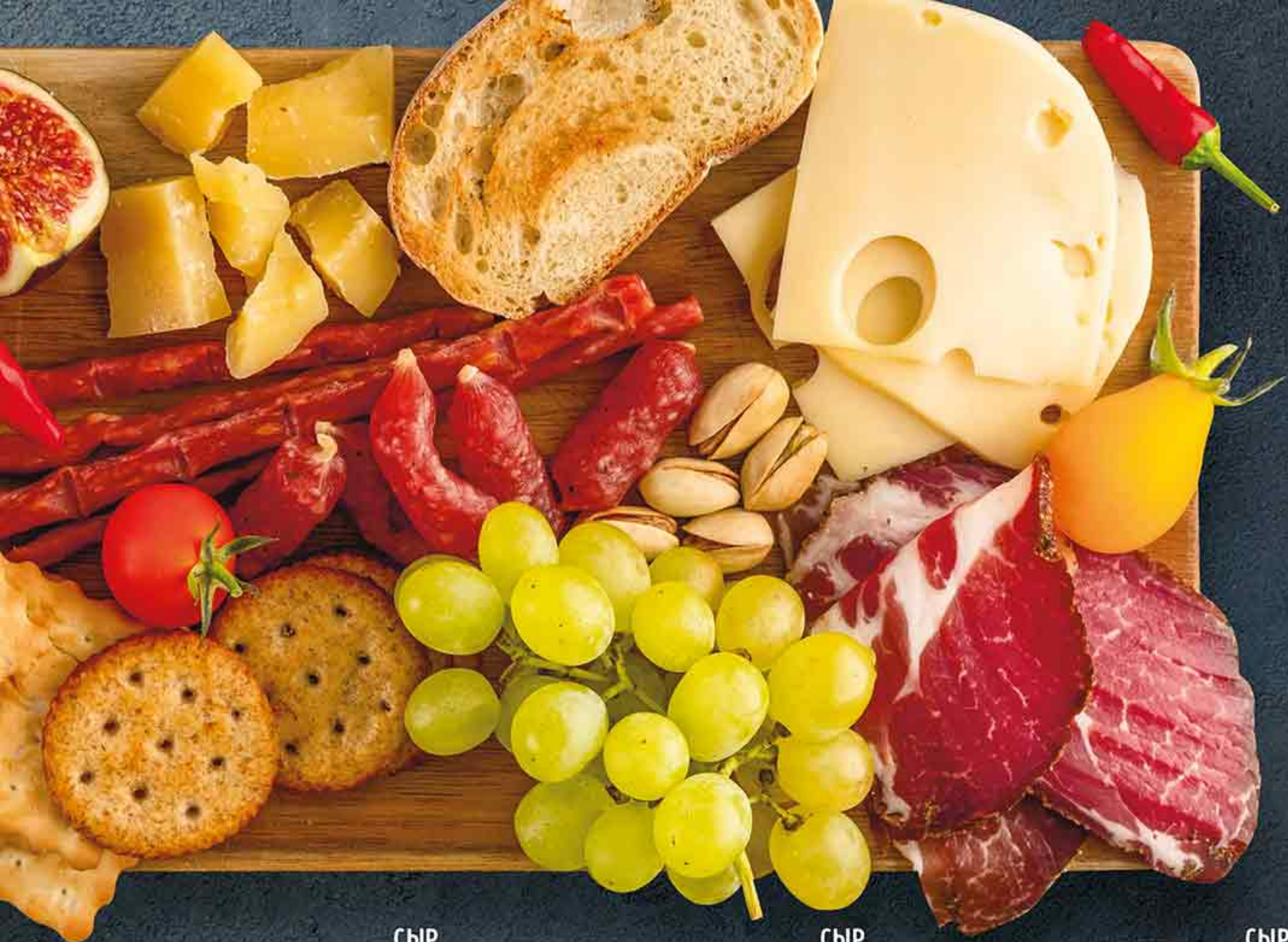
СЫР ПАРМЕЗАН DZIUGAS 100 Г