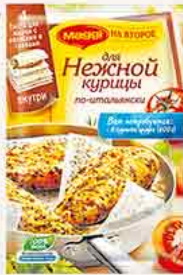
СМЕСЬ НА ВТОРОЕ ДЛЯ КУРИНОЙ ГРУДКИ ПО-ИТАЛЬЯНСКИ MAGGI 30,6 Г