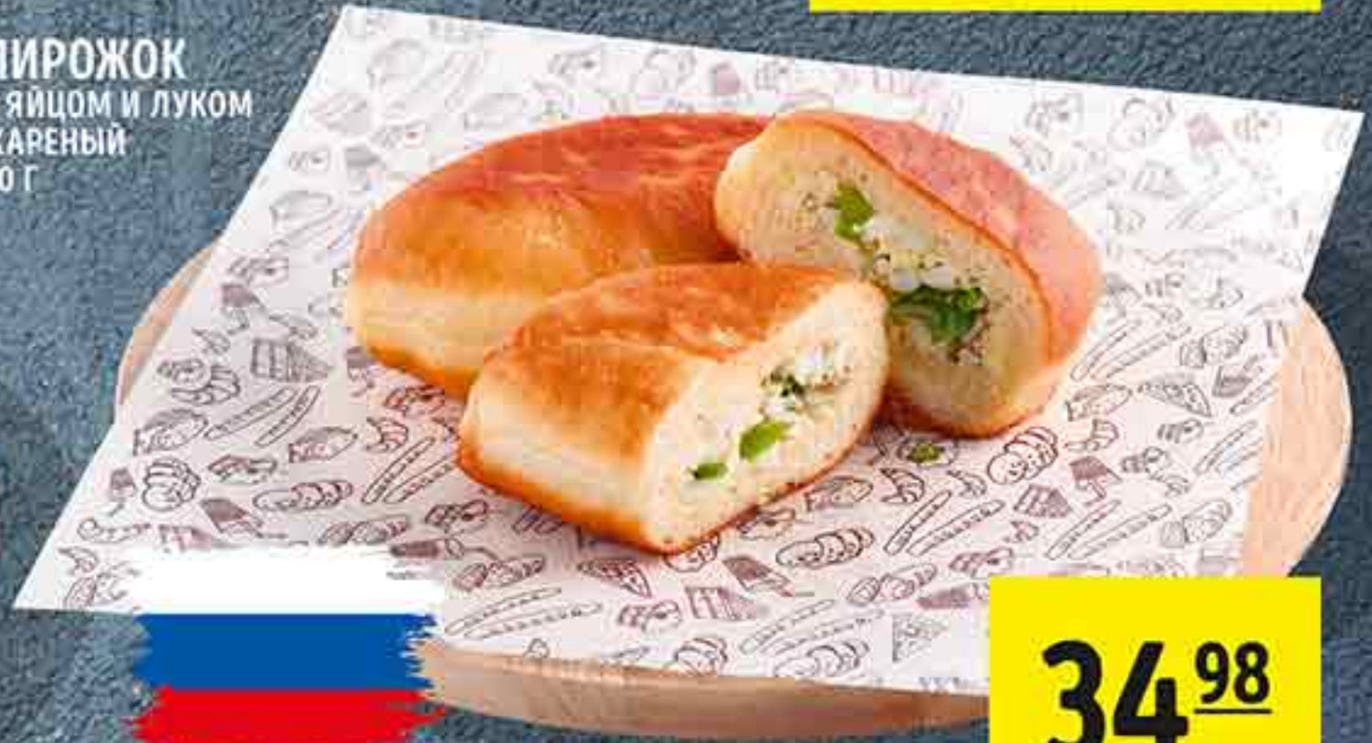
ПИРОЖОК С ЯЙЦОМ И ЛУКОМ ЖАРЕНЫЙ 90 Г