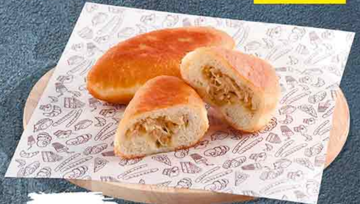
ПИРОЖОК С КАРТОФЕЛЕМ ЖАРЕНЫЙ 90 Г