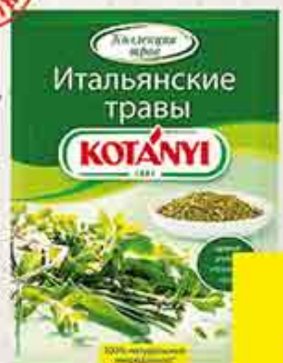
ПРИПРАВА ИТАЛЬЯНСКИЕ ТРАВЫ KOTANYI 14 Г