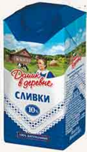
СЛИВКИ 10 % ДОМИК В ДЕРЕВНЕ 0,48 Л