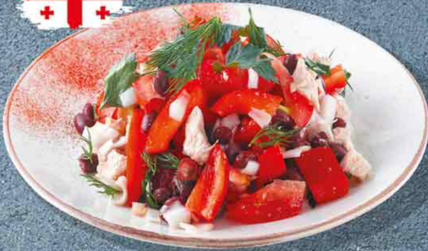
САЛАТ ГРУЗИНСКИЙ КУРИНОЕ ФИЛЕ, ПОМИДОРЫ, ФАСОЛЬ, БОЛГАРСКИЙ ПЕРЕЦ В СПЕЦИАЛЬНОЙ ЗАПРАВКЕ 100 Г