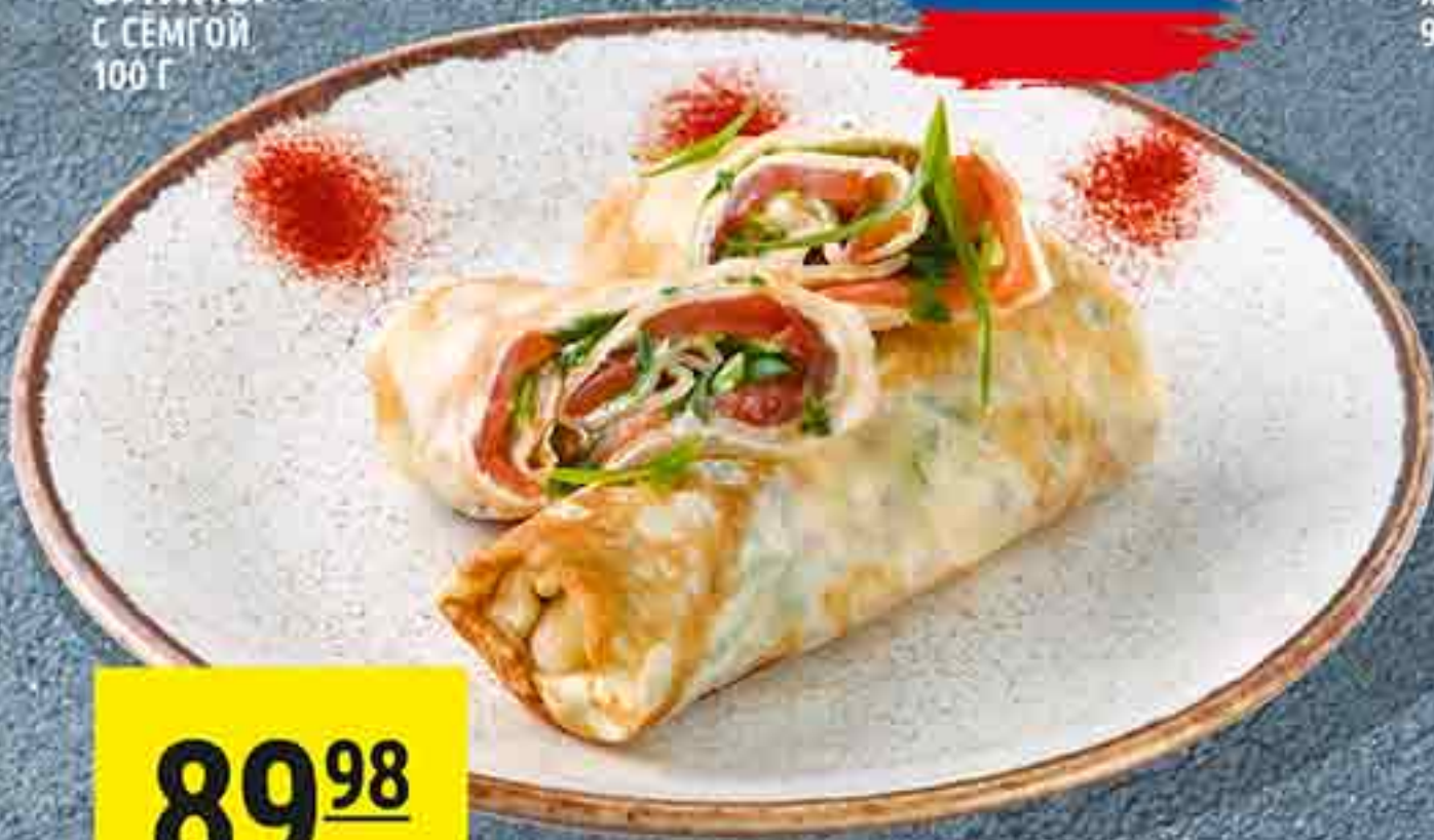
БЛИНЫ С СЕМГОЙ 100 Г