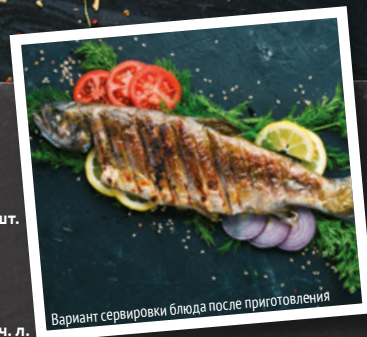
Вариант сервировки блюда после приготовления

Рыбу очистить от чешуи, удалить жабры или отрезать голову, обрезать плавники, хвост и выпотрошить тушку. Затем тщательно промыть под проточной холодной водой и обсушить бумажными полотенцами. В небольшой емкости смешать соль и черный молотый перец, натереть рыбу внутри и снаружи.