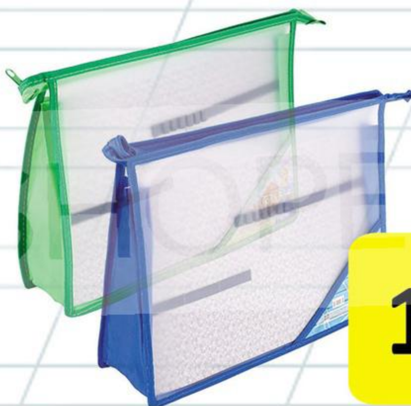
ПАПКА ДЛЯ ТРУДА НА МОЛНИИ СВЕРХУ, С ДВУМЯ ОТДЕЛЕНИЯМИ, ПЛАСТИК 304X223 ММ