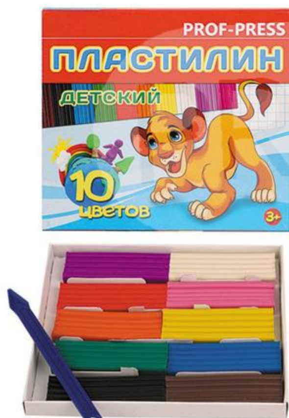
ПЛАСТИЛИН 10 ЦВЕТОВ, 150 Г