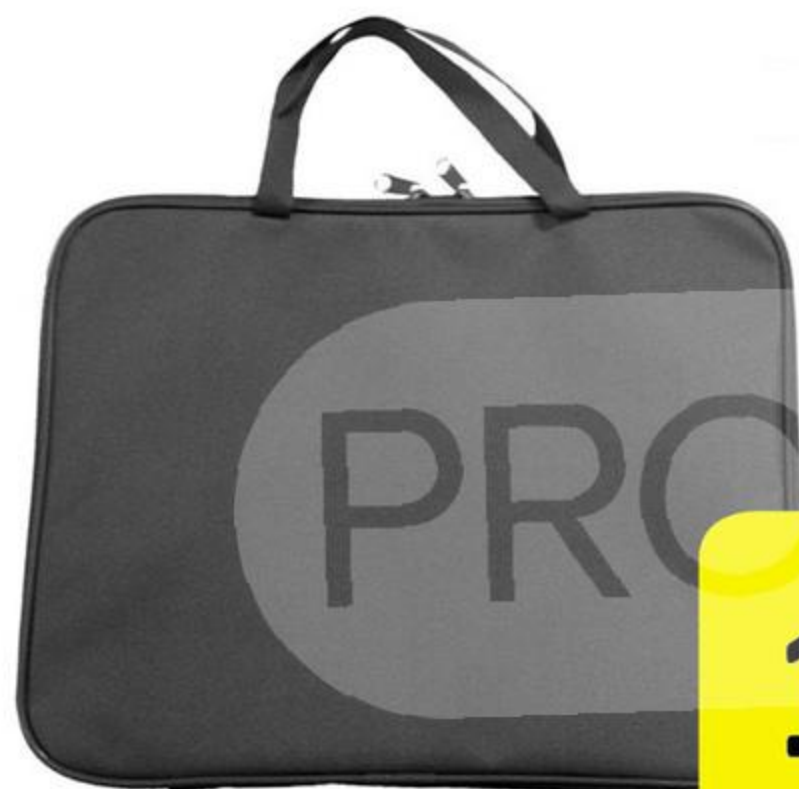
ПАПКА МЕНЕДЖЕРА, 360X270 ММ