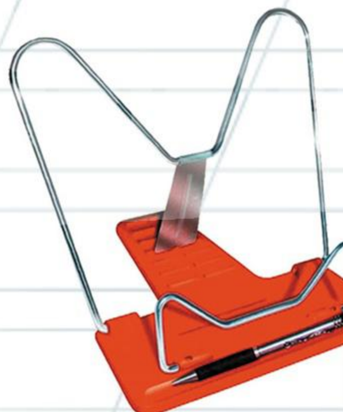
ПОДСТАВКА ДЛЯ КНИГ