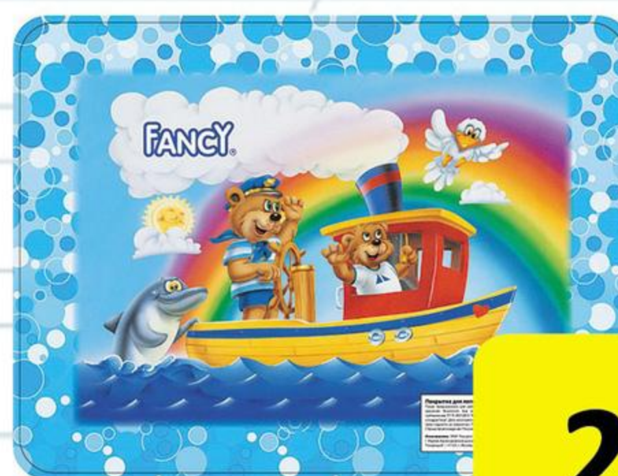
НАСТОЛЬНОЕ ПОКРЫТИЕ ДЛЯ ЛЕПКИ А3, пластик