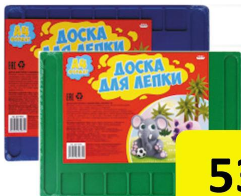
ДОСКА ДЛЯ ЛЕПКИ С ВЫЕМКАМИ А4, ассорти