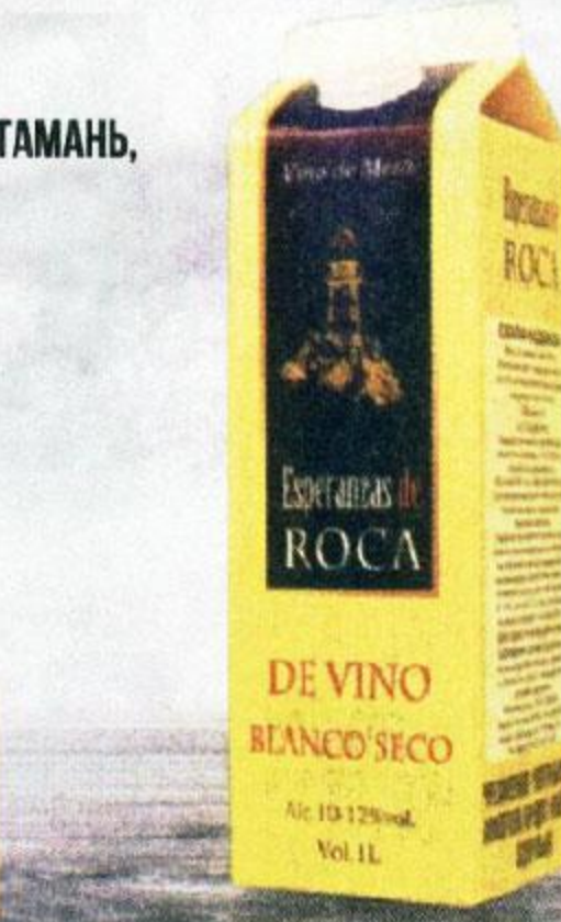
ВИНО СКАЛА НАДЕЖДЫ, БЕЛОЕ, СУХОЕ, 1 Л