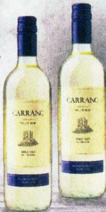
ВИНО КАРРАНК, БЕЛОЕ, КРАСНОЕ, ПОЛУСЛАДКОЕ, 0,75 Л