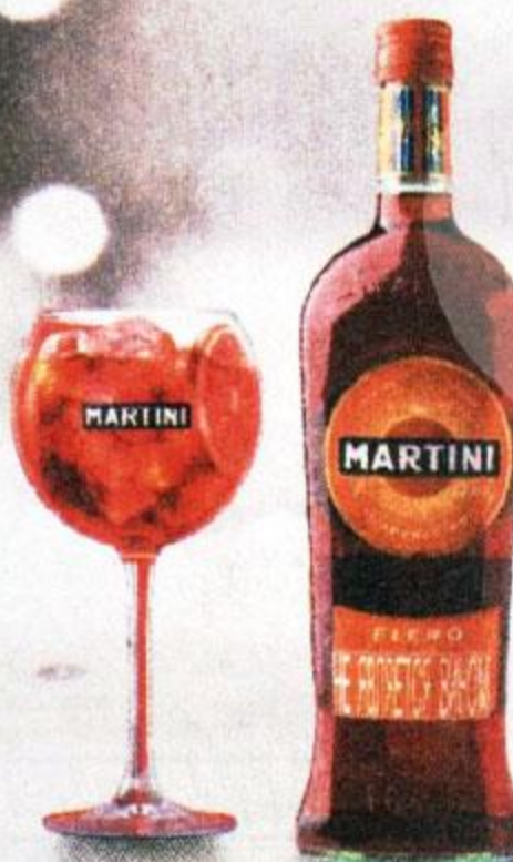
ВИННЫЙ НАПИТОК МАРТИНИ, ФИЕРО, СЛАДКИЙ, 1 Л