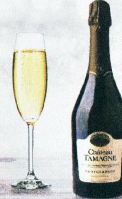
ВИНО ИГРИСТОЕ ШАТО ТАМАНЬ, БЕЛОЕ, ПОЛУСЛАДКОЕ, 0,75 Л