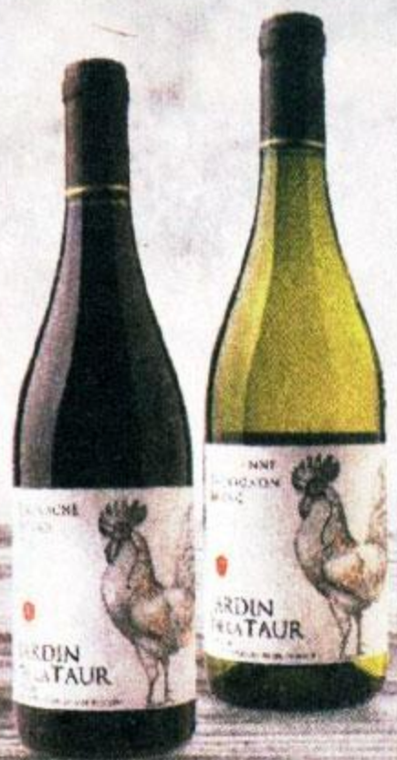
ВИНО ЖАРДЕН ДЕ ЛА ТОР, ГРЕНАШ СИРА, КРАСНОЕ, ПОЛУСУХОЕ; МАРСАН СОВИньОН БЛАН, БЕЛОЕ, СУХОЕ, 0,75 Л