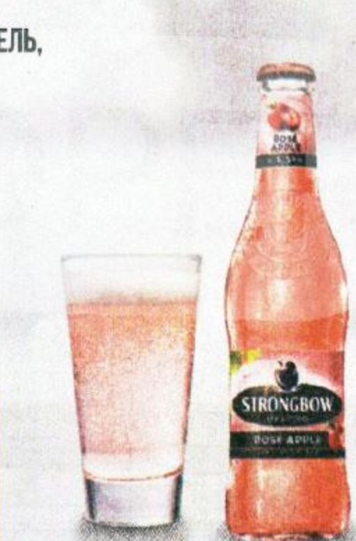
СИДР СТРОНГБОУ, РОЗЕ, ЯБЛОЧНЫЙ, 0,4 Л