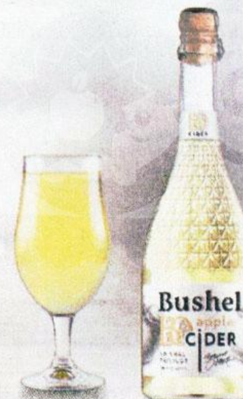
СИДР ЯБЛОЧНЫЙ БУШЕЛЬ, СЛАДКИЙ, 0,75 Л