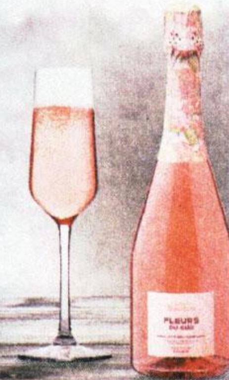
ВИНО ИГРИСТОЕ ФЛЁРС ДЮ СЮД, РОЗОВОЕ, ПОЛУСУХОЕ, 0,75 Л