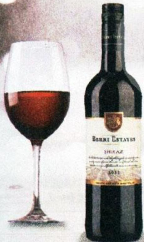
ВИНО БЭРРИ ЭСТЕЙТС, ШИРАЗ, КРАСНОЕ, ПОЛУСУХОЕ, 0,75 Л