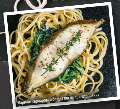
Вариант сервировки блюда после приготовления