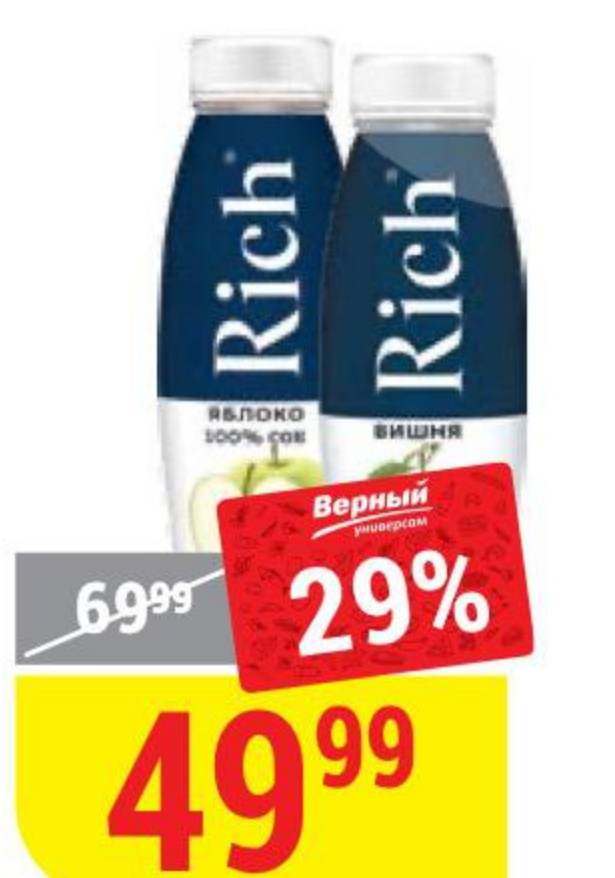
СОК И НЕКТАР RICH в ассортименте, 0,3 л 154494/154498