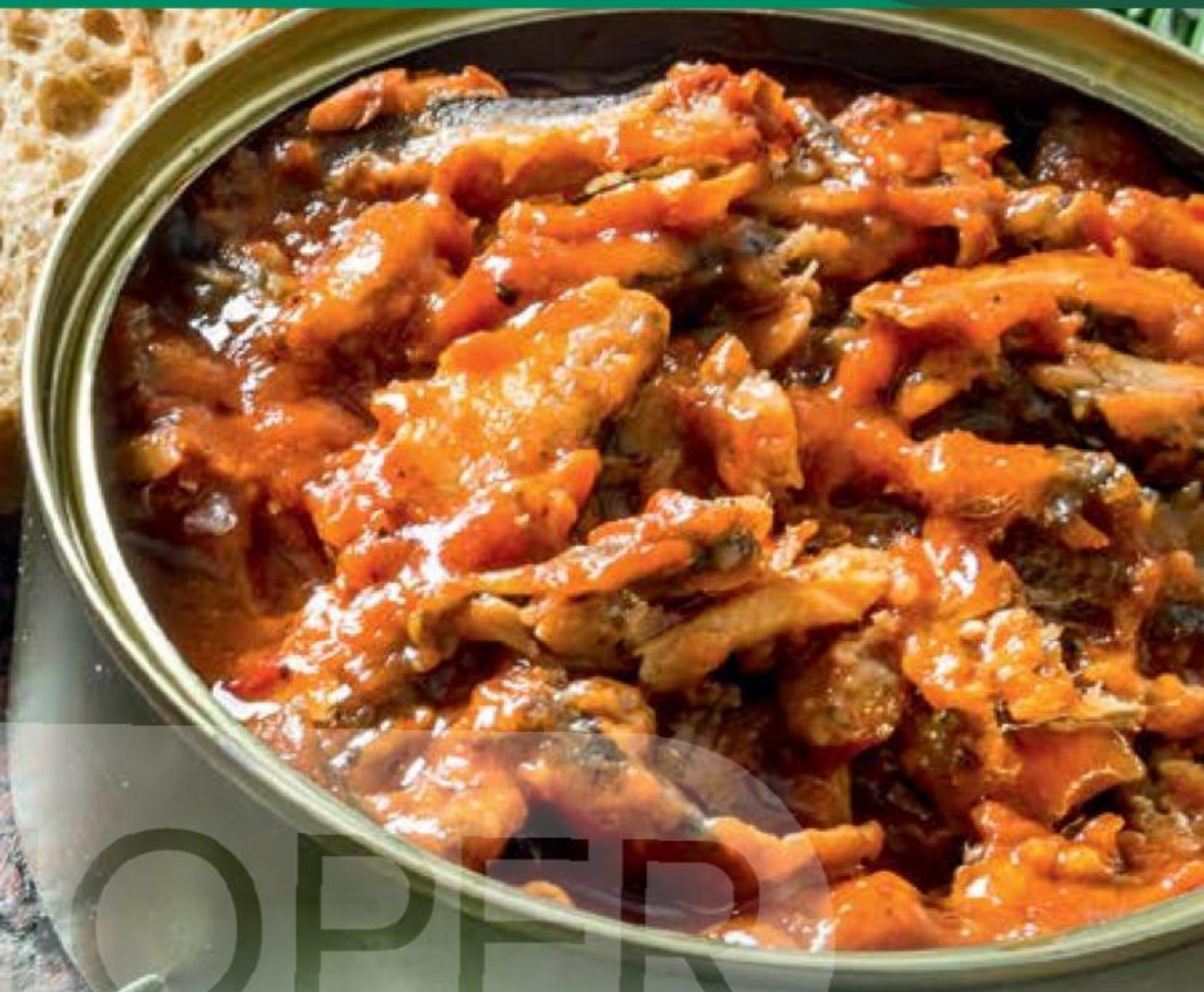
КИЛЬКА ЧЕРНОМОРСКАЯ в томатном соусе, Вкусные Консервы, 240 г 146917