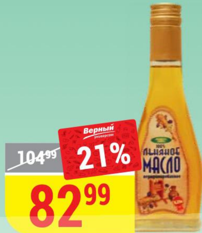
МАСЛО ЛЬНЯНОЕ нерафинированное, Ароматы Жизни, 0,25 л 139070