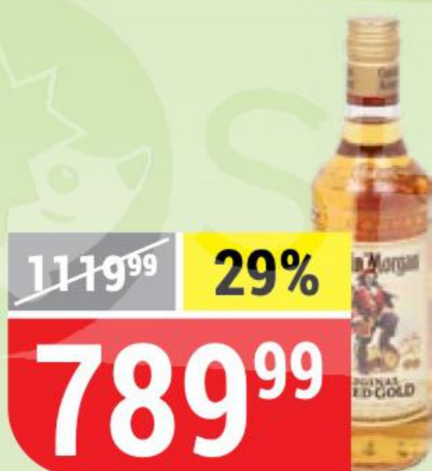
НАПИТОК РОМОВЫЙ CAPTAIN MORGAN spiced gold, 35%, 0,5 л 136071