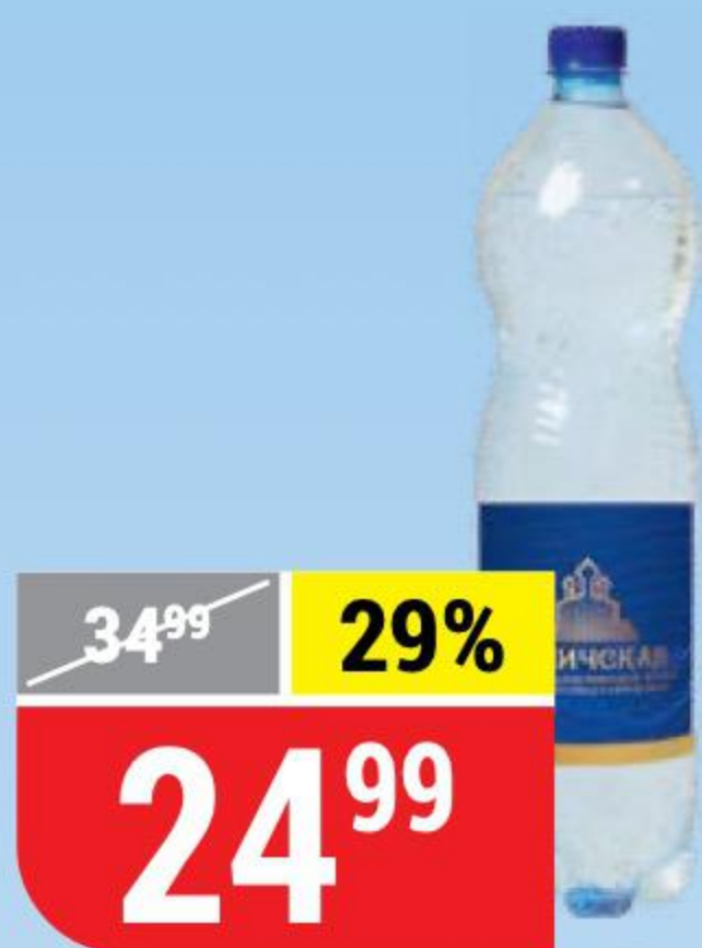
ВОДА УГЛИЧСКАЯ минеральная, газированная, 1,5 л 155592