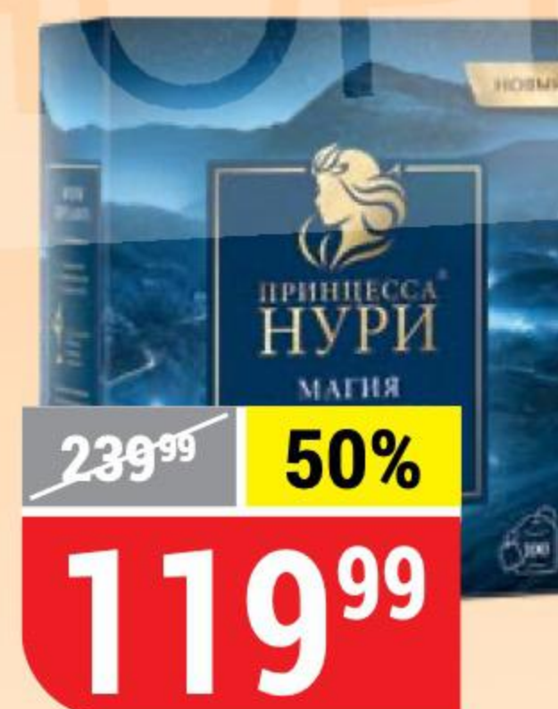
ЧАЙ ПРИНЦЕССА НУРИ магия бергамота, 100 пак. x 2 г 138220