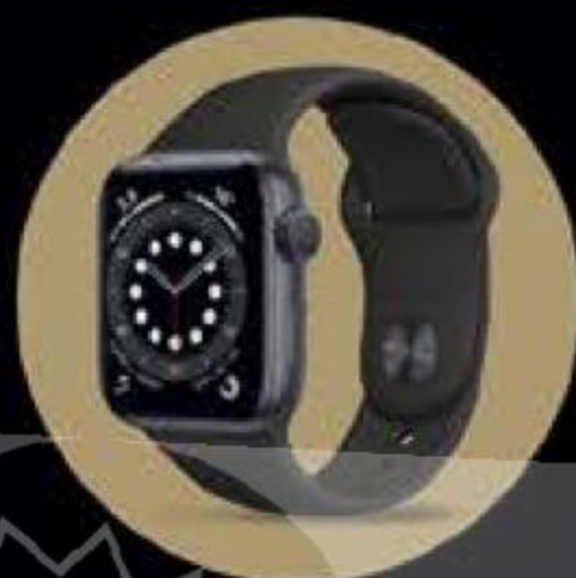
Apple Watch 6