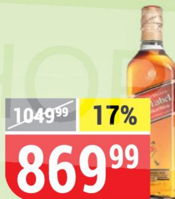
ВИСКИ JOHNNIE WALKER RED LABEL 40%, 0,5 л 152892