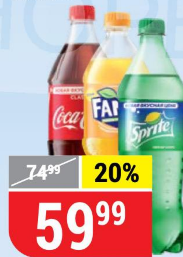
НАПИТОК SPRITE; COCA-COLA; FANTA в ассортименте, 0,9 л 133565/133567/133569/133571/141603