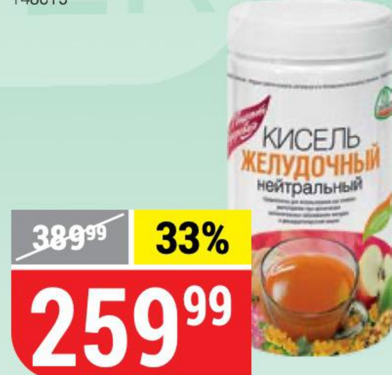
КИСЕЛЬ ЖЕЛУДОЧНЫЙ нейтральный, Леовит, 400 г 155829