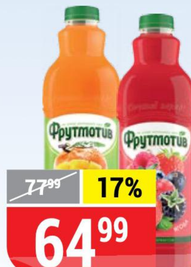
НАПИТОК ФРУКТМОТИВ в ассортименте, 1,5 л 119559/119560