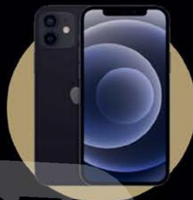
iPhone 12 X4 ГЛАВНЫЙ ПРИЗ