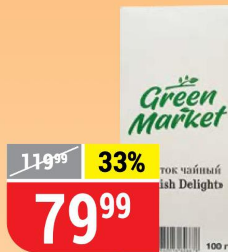
НАПИТОК ЧАЙНЫЙ TURKISH DELIGHT фруктовый, Green Market, 100 г 151209