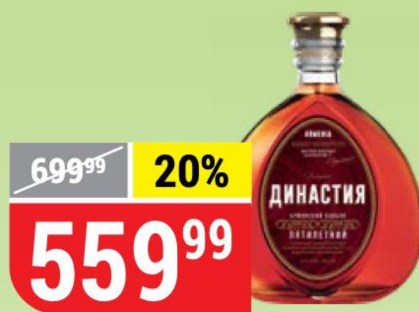
КОНЬЯК ВЕЛИКАЯ ДИНАСТИЯ армянский, 5 лет, 40%, 0,5 л 155873