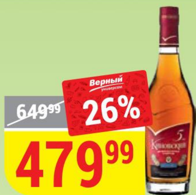
КОНЬЯК КИНОВСКИЙ 5 лет, 40%, 0,5 л 131143