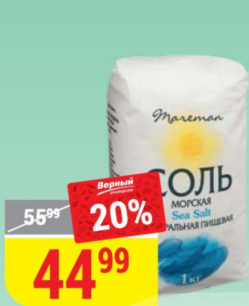
СОЛЬ МОРСКАЯ пищевая, помол №1, Mareman, 1 кг 151277