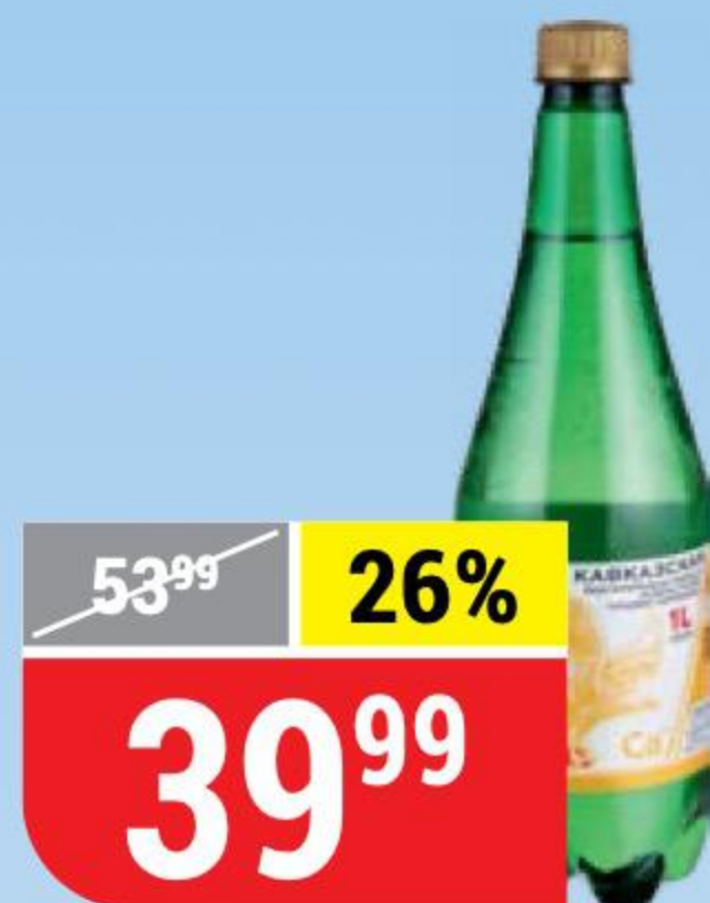
ВОДА АРДЖИ минеральная, лечебно-столовая, 1 л 153761