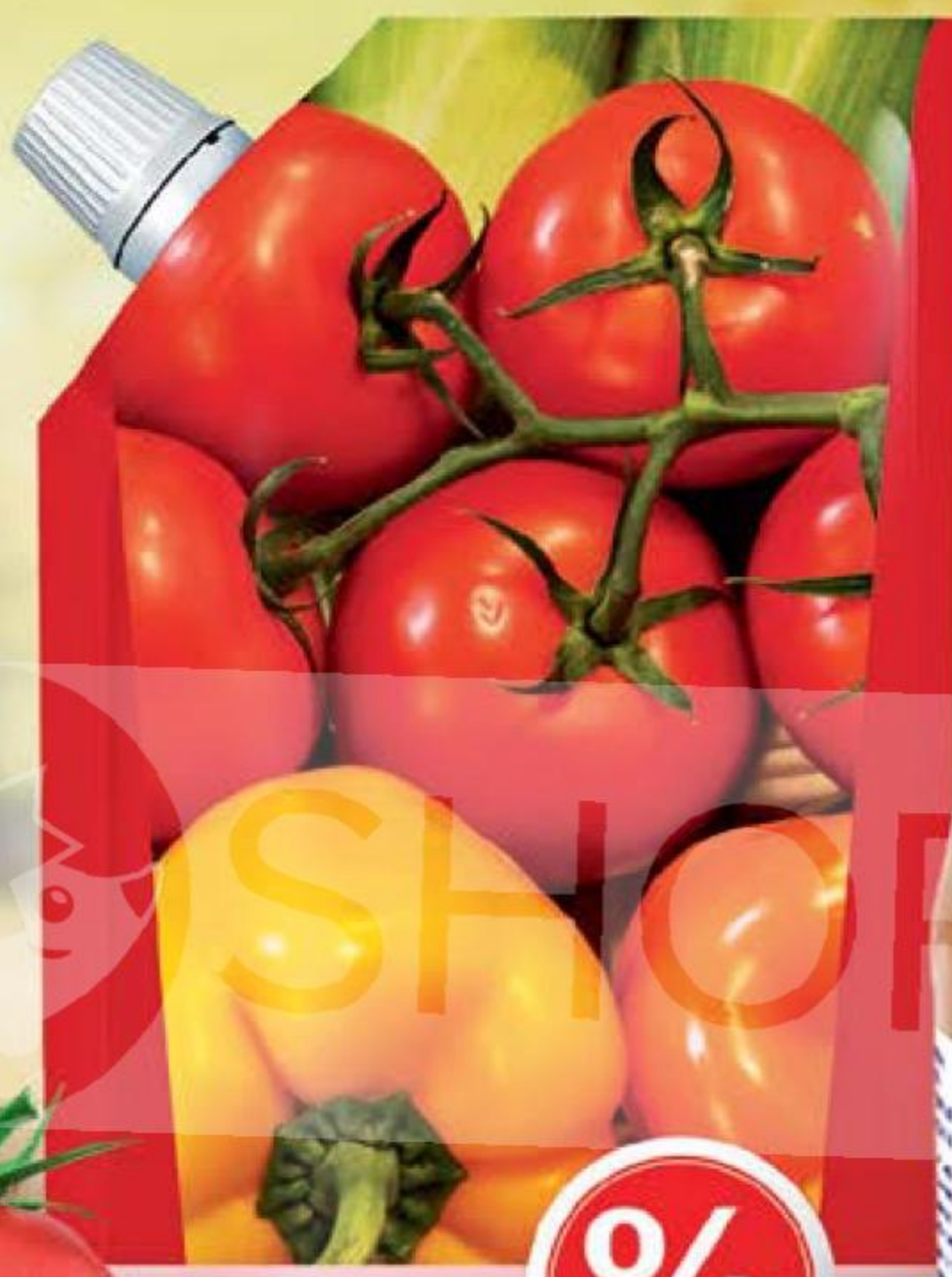
КЕТЧУП % болгарский, 270 г 131615