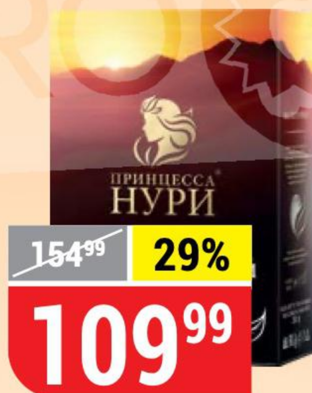
ЧАЙ ПРИНЦЕССА НУРИ высокогорный, черный, листовой, 250 г 141256