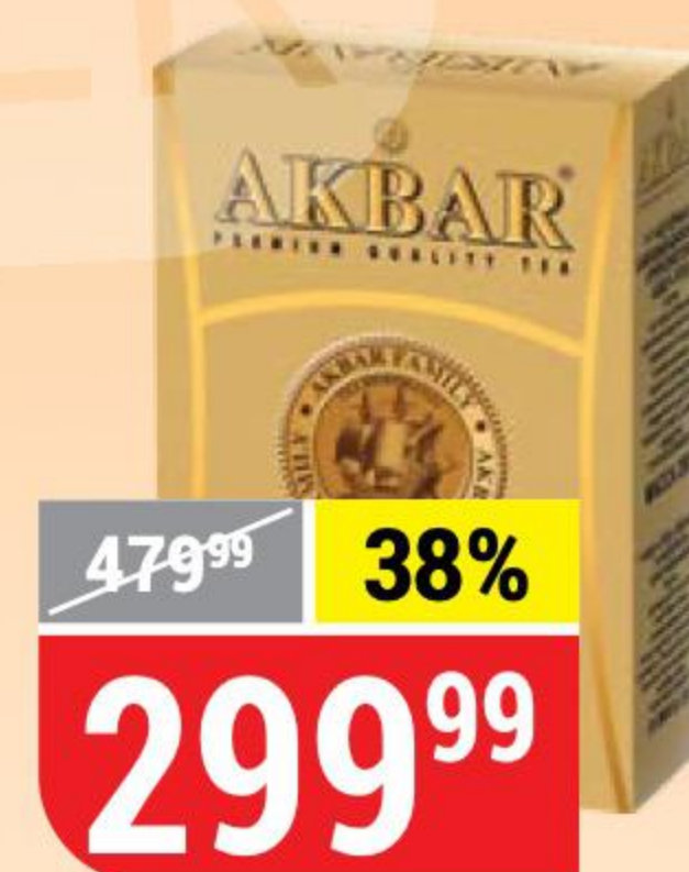
ЧАЙ АКВАР gold , черный, крупнолистовой, 250 г 133451