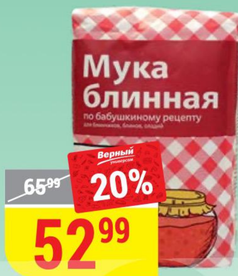
МУКА БЛИННАЯ по бабушкиному рецепту, 1 кг 143329