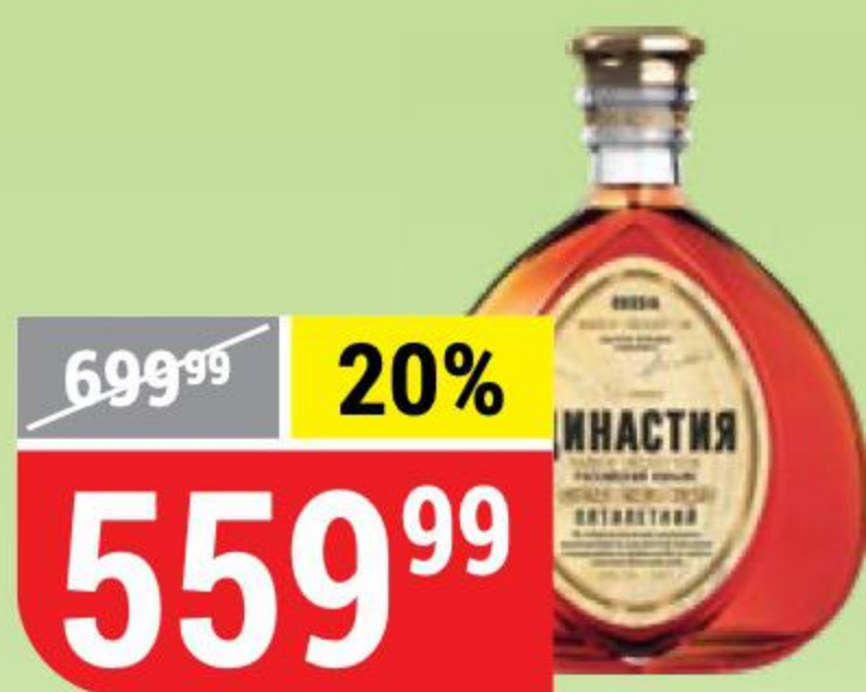
КОНЬЯК ВЕЛИКАЯ ДИНАСТИЯ выбор экспертов, 5 лет, 40%, 0,5 л 155819