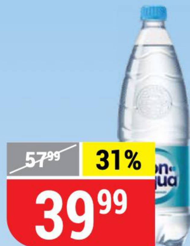
ВОДА VON AQUA питьевая, негазированная, 1 л 127021