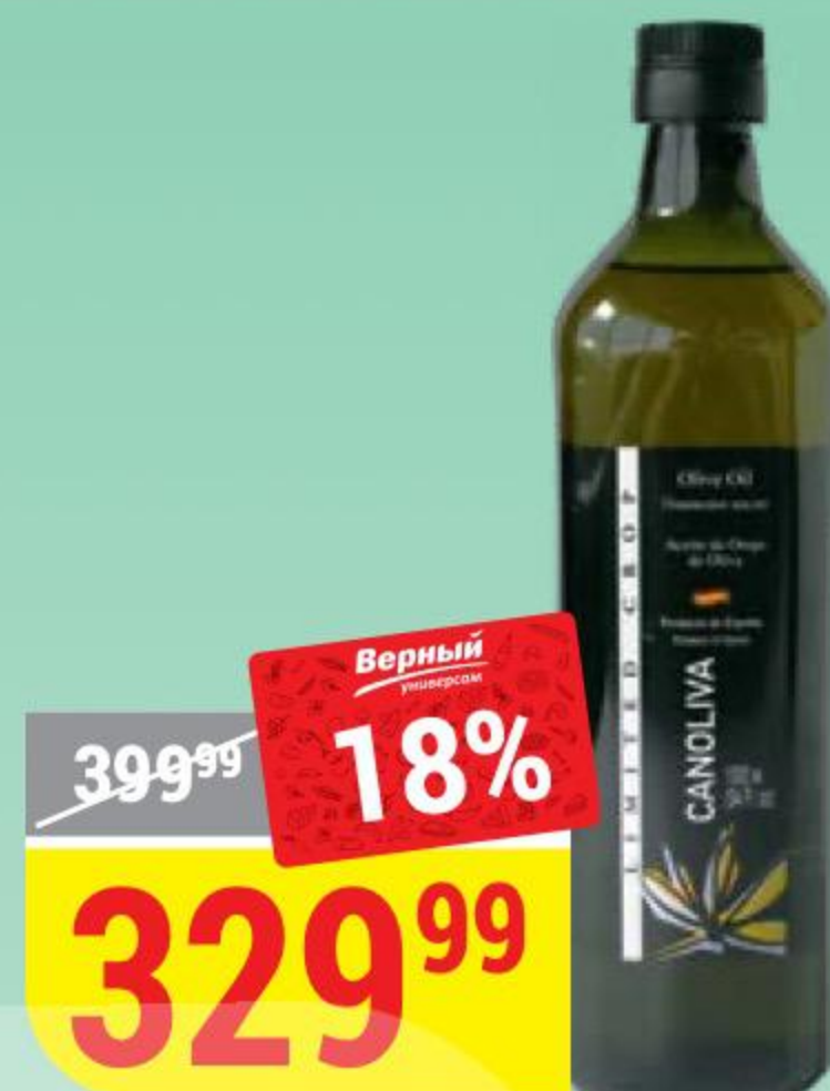
МАСЛО ОЛИВКОВОЕ CANOLIVA 1 л 148615