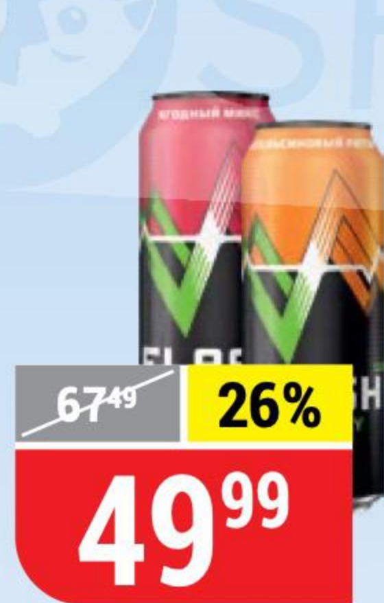
НАПИТОК FLASH энергетический, в ассортименте, 0,45 л 148349/148351