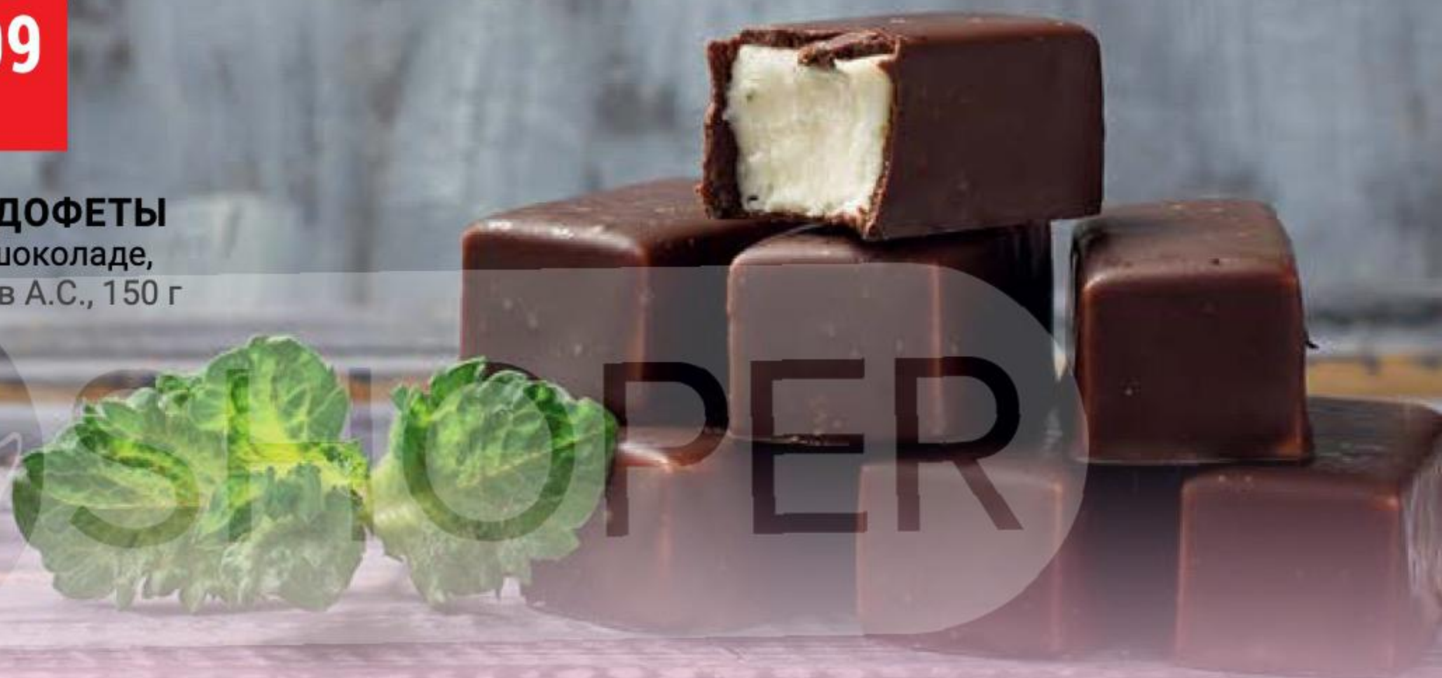
КОНФЕТЫ МЕДОФЕТЫ нежное суфле в шоколаде, ассорти, Берестов А.С., 150 г 154652