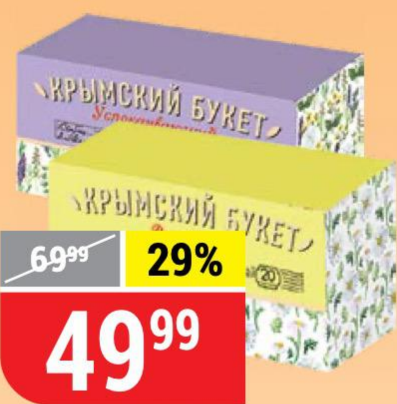
ЧАЙНЫЙ НАПИТОК КРЫМСКИЙ БУКЕТ в ассортименте, 20 пак. x 1,5 г 147624/147625/147622