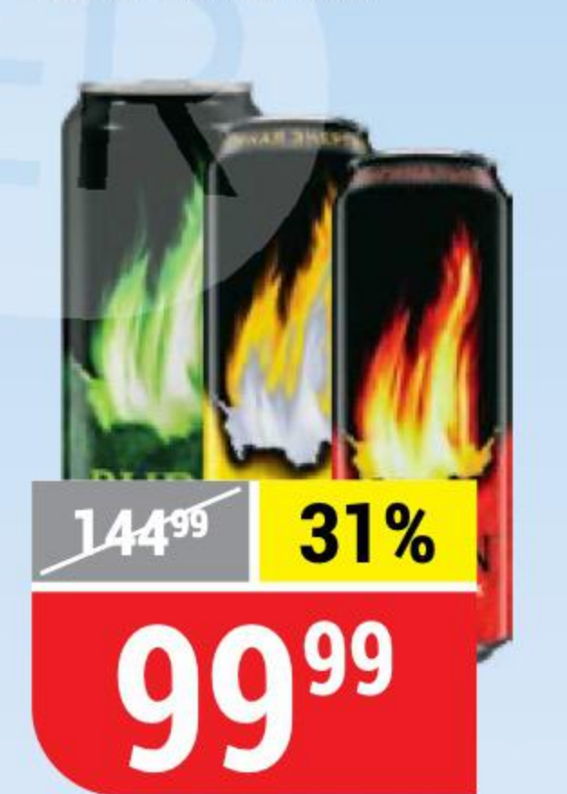
НАПИТОК BURN энергетический, в ассортименте, 0,449 л 144213/144675/144754