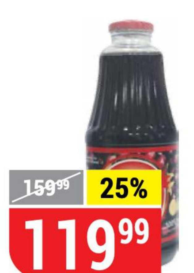
СОК NAR гранатовый, 1 л 153439