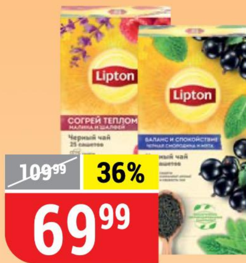
ЧАЙ LIPTON в ассортименте, 25 пак. x 1,5 г 145185/145184