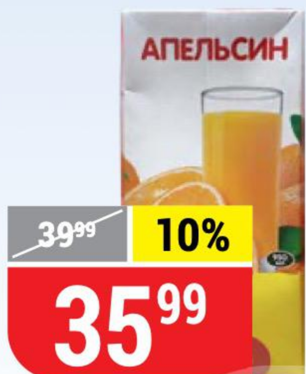
НЕКТАР АПЕЛЬСИНОВЫЙ Верная Цена, 0,95 л 121108