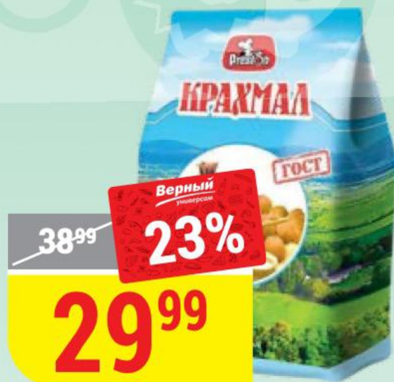
КРАХМАЛ Preston, 200 г 148747

* Цена указана за 1 шт. при покупке 3 шт. одновременно