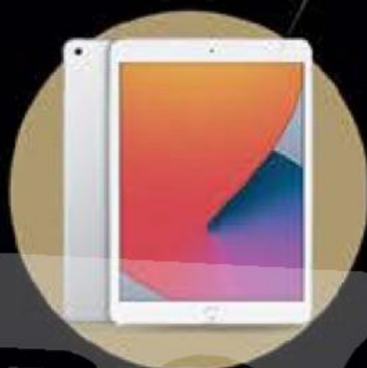
Apple iPad 10