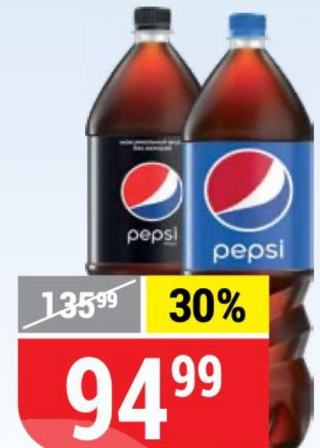
НАПИТОК PEPSI; PEPSI MAX 2 л 101288/138224