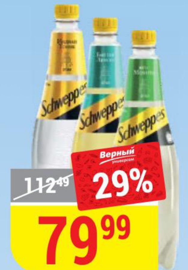
НАПИТОК SCHWEPPE в ассортименте, 0,9 л 142903/142904/142905