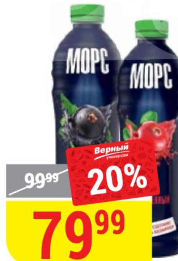
J-МОРС в ассортименте, 1 л 153887/153889