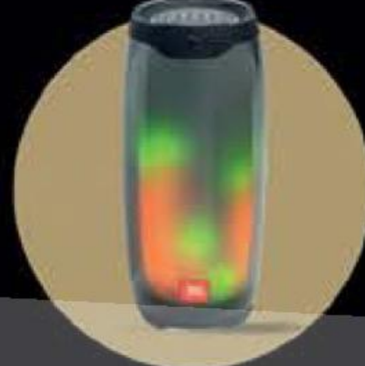
JBL Pulse 4