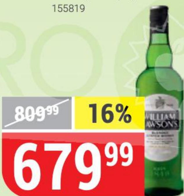
ВИСКИ WILLIAM LAWSON'S 40%, 0,5 л 124609