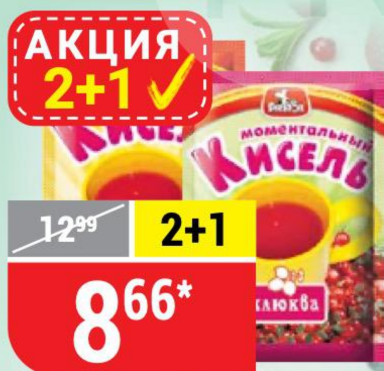
КИСЕЛЬ в ассортименте, Preston, 30 г 119653/119655

* Цена указана за 1 шт. при покупке 3 шт. одновременно