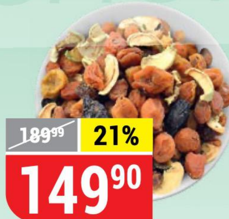
СМЕСЬ КОМПОТНАЯ Nikbionut, 700 г 150235