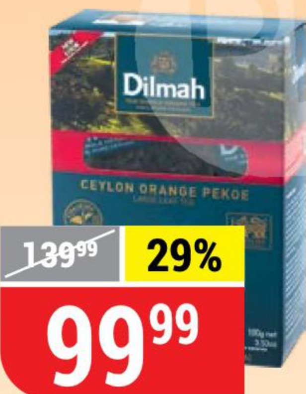
ЧАЙ DILMAN крупнолистовой, 100 г 126996