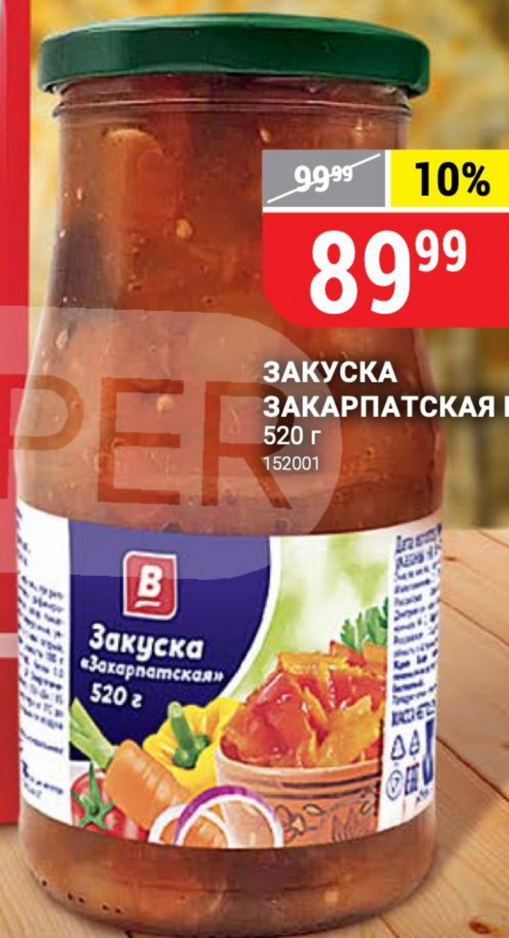
ЗАКУСКА ЗАКАРПАТСКАЯ В 520 г 152001

ОСТАВЬТЕ СВОЙ ОТЗЫВ О КАЧЕСТВЕ ТОВАРА! mnenie@ivoiin.ru