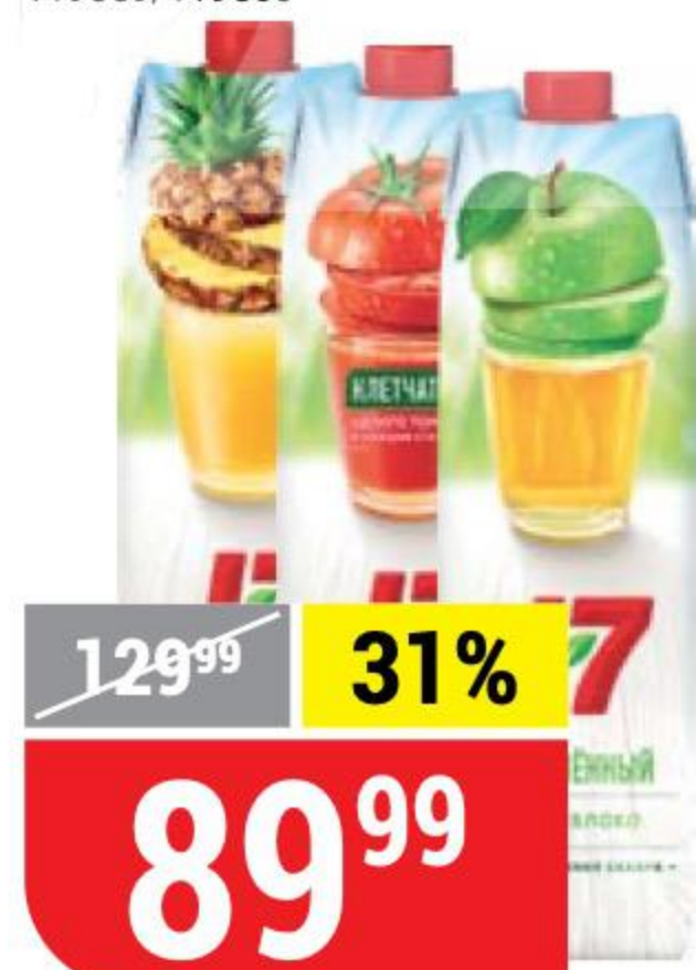
СОК И НЕКТАР J7 в ассортименте, 0,97 л 102668/102676/118351/118352/ 122013