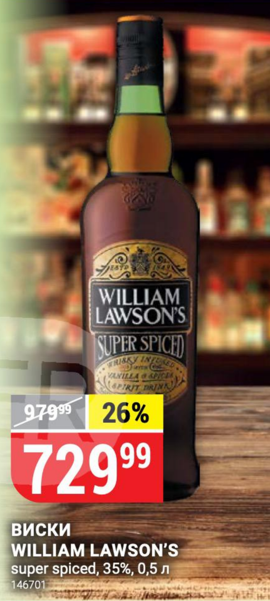
ВИСКИ WILLIAM LAWSON'S super spiced, 35%, 0,5 л 146701

ЧРЕЗМЕРНОЕ УПОТРЕБЛЕНИЕ АЛКОГОЛЯ ВРЕДИТ ВАШЕМУ ЗДОРОВЬЮ