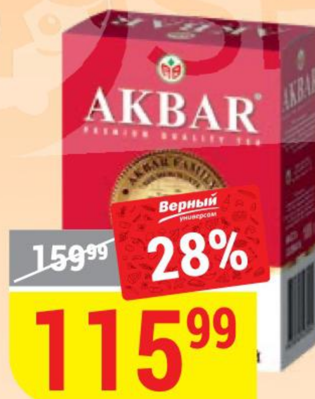
ЧАЙ АКВАР цейлонский, черный, крупнолистовой, 100 г 133448