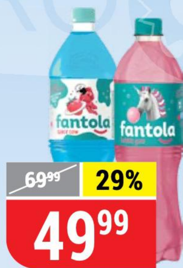
НАПИТОК FANTOLA в ассортименте, 1 л 146771/155575