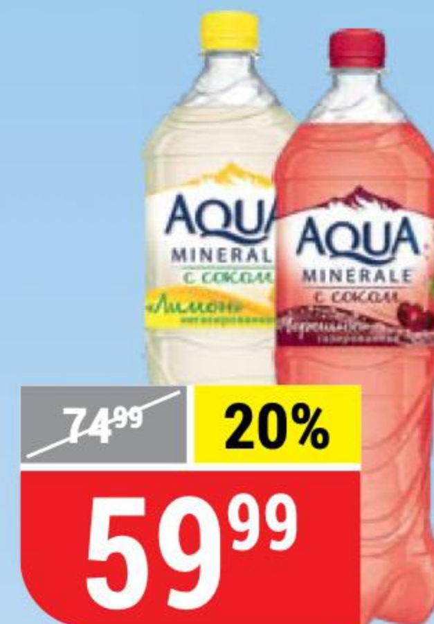
ВОДА AQUA MINERALE в ассортименте, 1,5 л 127037/133017