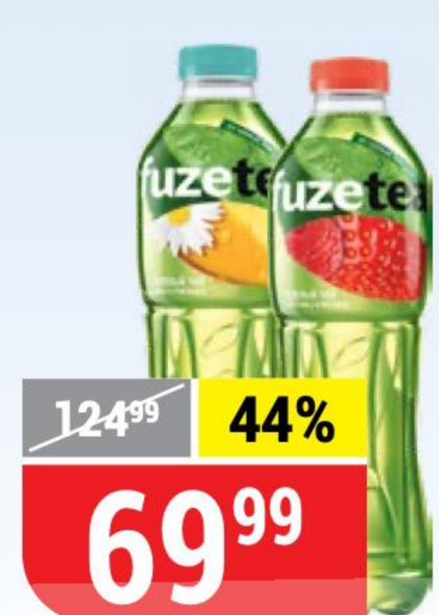
ХОЛОДНЫЙ ЧАЙ FUZETEА в ассортименте, 1 л 143959/143960