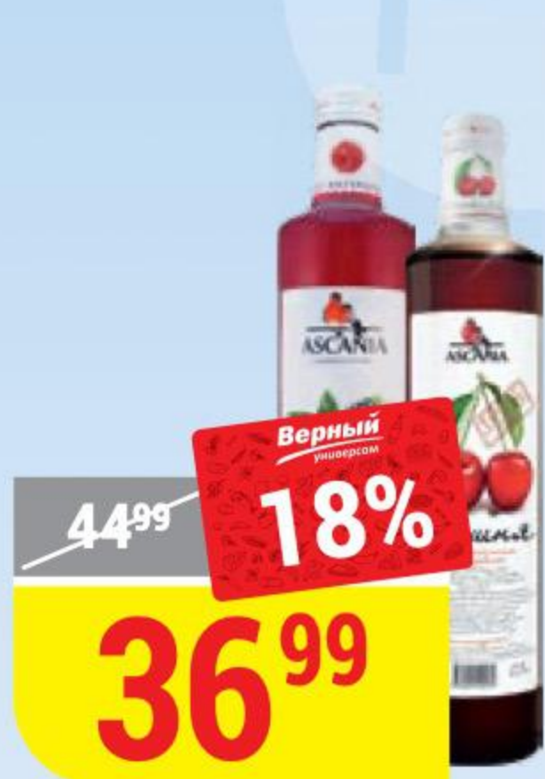
НАПИТОК ASCANIA в ассортименте, 0,5 л 125028/142348