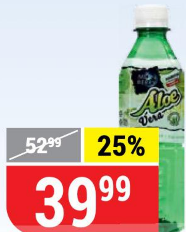
НАПИТОК MOONBERRY с кусочками алоэ, 0,5 л 135121