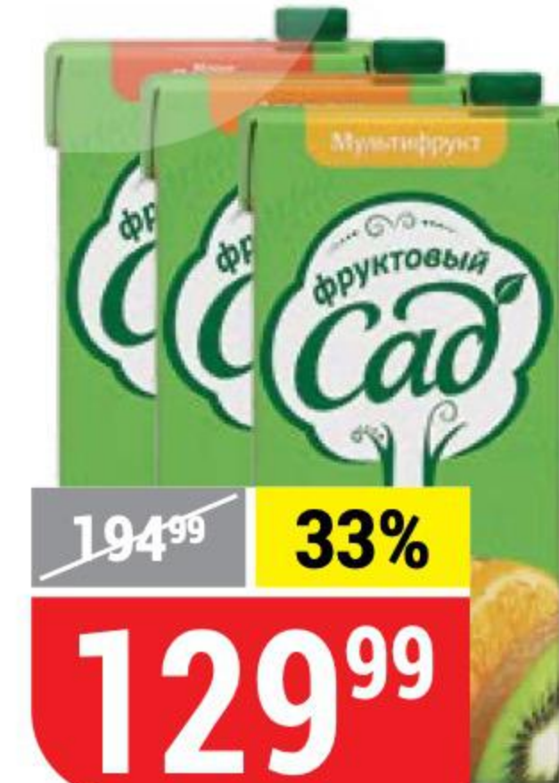
НЕКТАР ФРУКТОВЫЙ САД в ассортименте, 1,93 л 101294/116953/117244/117245