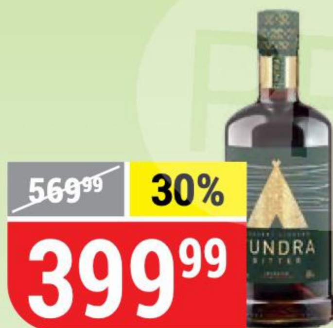
ЛИКЕР TUNDRA BITTER 35%, 0,5 л 133745