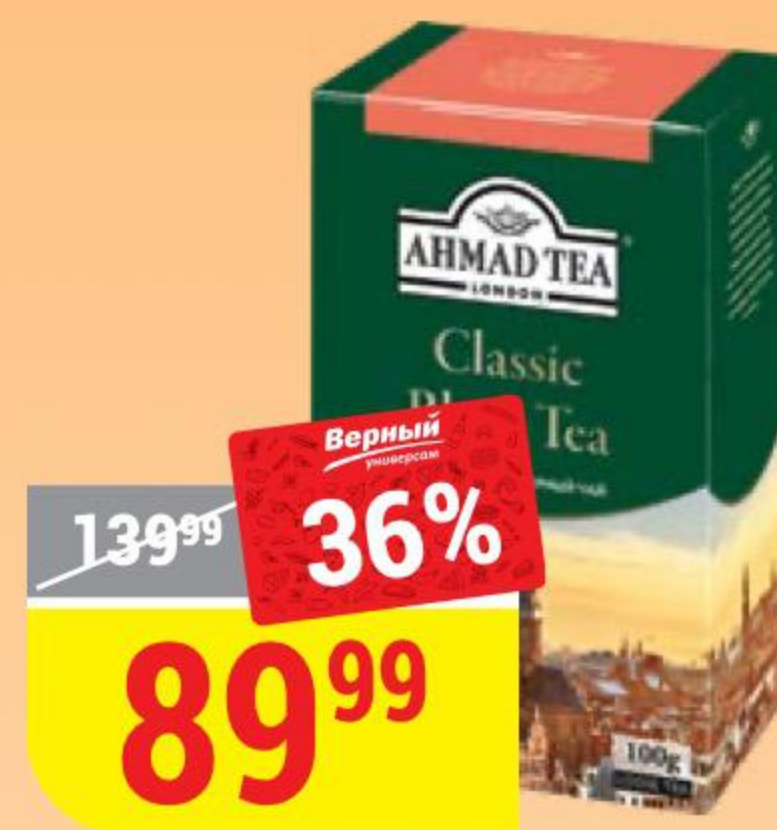
ЧАЙ AHMAD TEA классический, листовый, 100 г 131562