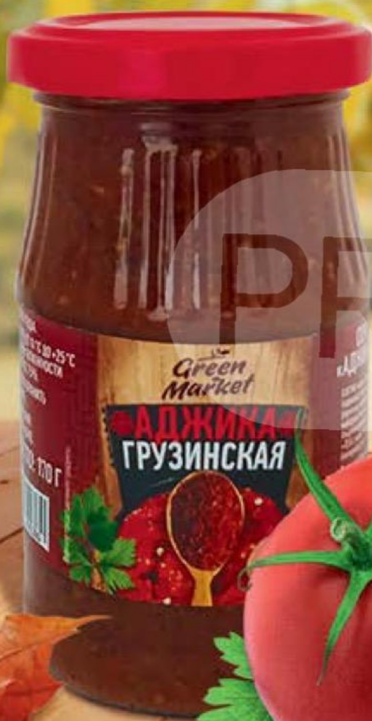
АДЖИКА ГРУЗИНСКАЯ томатная, Green Market, 170 г 153158