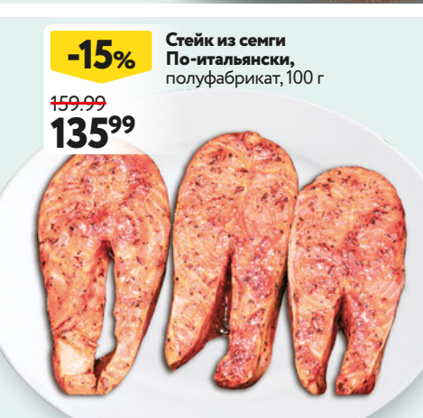
Стейк из семги По-итальянски, полуфабрикат, 100 г