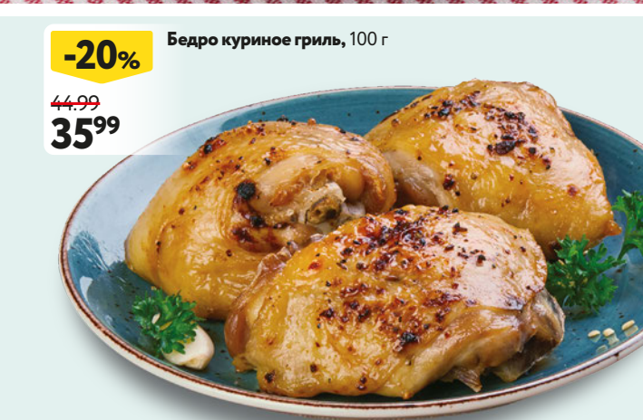
Бедро куриное гриль, 100 г