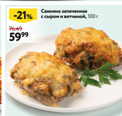
Свинина запеченная с сыром и ветчиной, 100 г