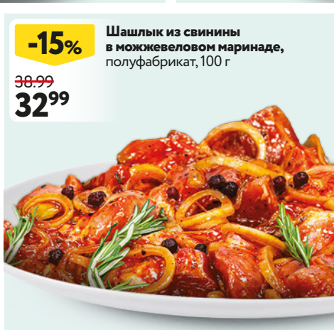
Шашлык из свинины в можжевеловом маринаде, полуфабрикат, 100 г