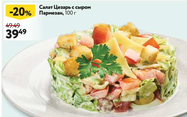
Салат Цезарь с сыром Пармезан, 100 г