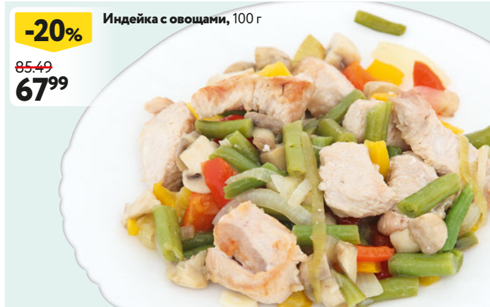
Индейка с овощами, 100 г