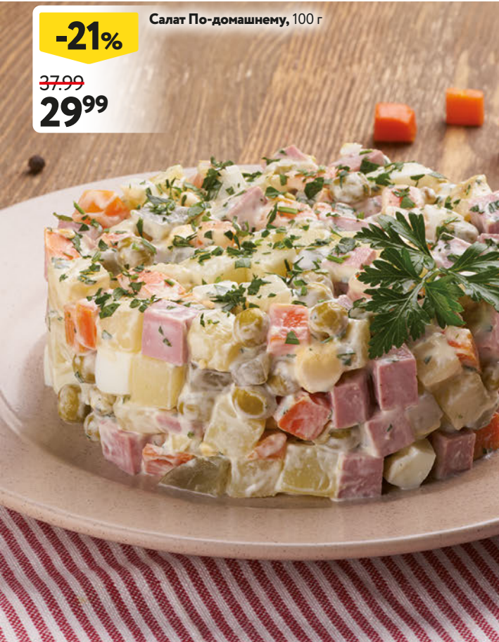
Салат По-домашнему, 100 г