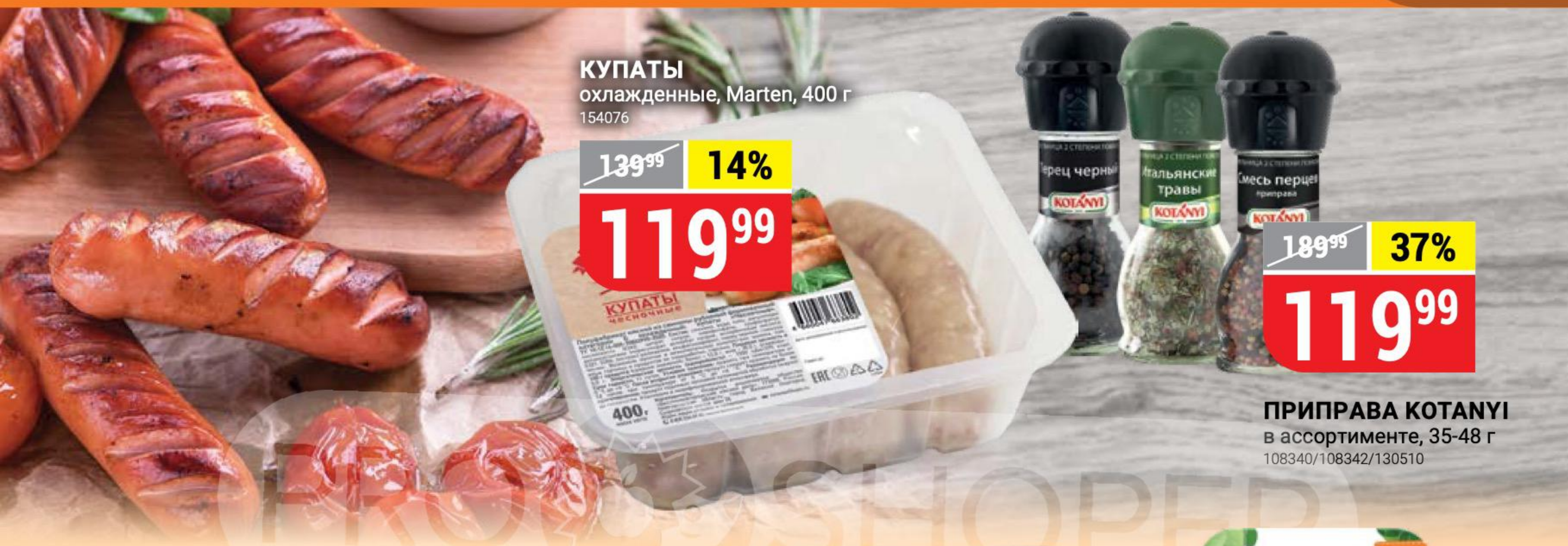
КУПАТЫ охлажденные, Marten, 400 г 154076