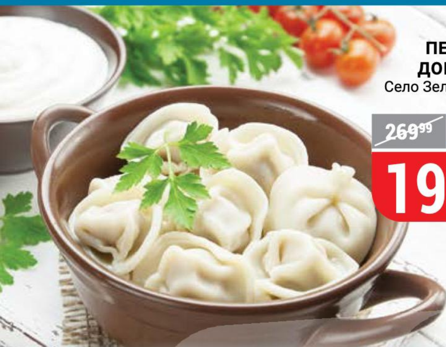
ПЕЛЬМЕНИ ДОМАШНИЕ Село Зелёное, 800 г 141249