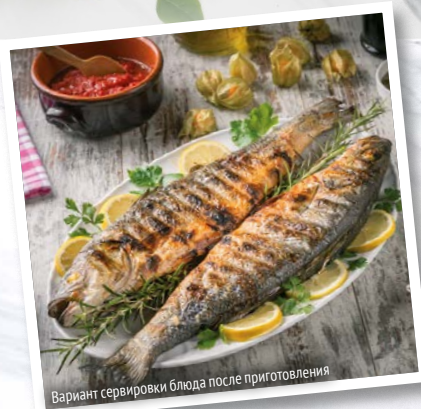
Вариант сервировки блюда после приготовления

Рыбу почистить от чешуи, удалить внутренности, жабры, помыть, обсушить бумажными полотенцами.