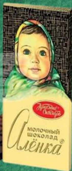
ШОКОЛАД АЛЕНКА 200 ГР

ЦЕНА ПО КАРТЕ 119 99 157 99 ЦЕНА БЕЗ КАРТЫ