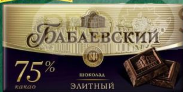
ШОКОЛАД БАБАЕВСКИЙ ЭЛИТНЫЙ 75% 200ГР

ЦЕНА ПО КАРТЕ 119 99 207 89 ЦЕНА БЕЗ КАРТЫ