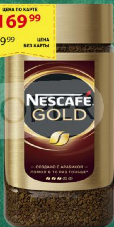
КОФЕ NESCAFE GOLD 95 ГР

ЦЕНА ПО КАРТЕ 169 99 249 99 ЦЕНА БЕЗ КАРТЫ