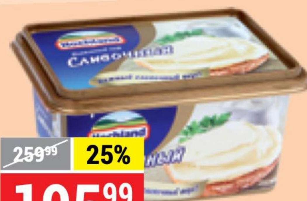
СЫР ПЛАВЛЕННЫЙ сливочный, 55%, Hochland, 400 г 126066