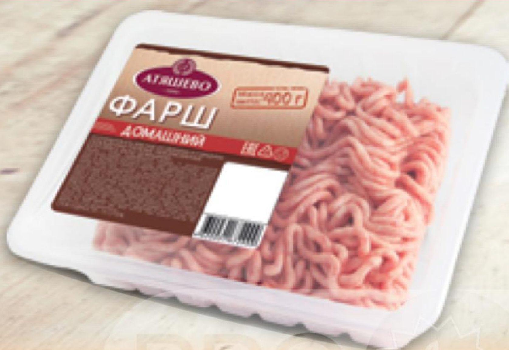
ФАРШ ДОМАШНИЙ охлажденный, Атяшево, 400 г 140480