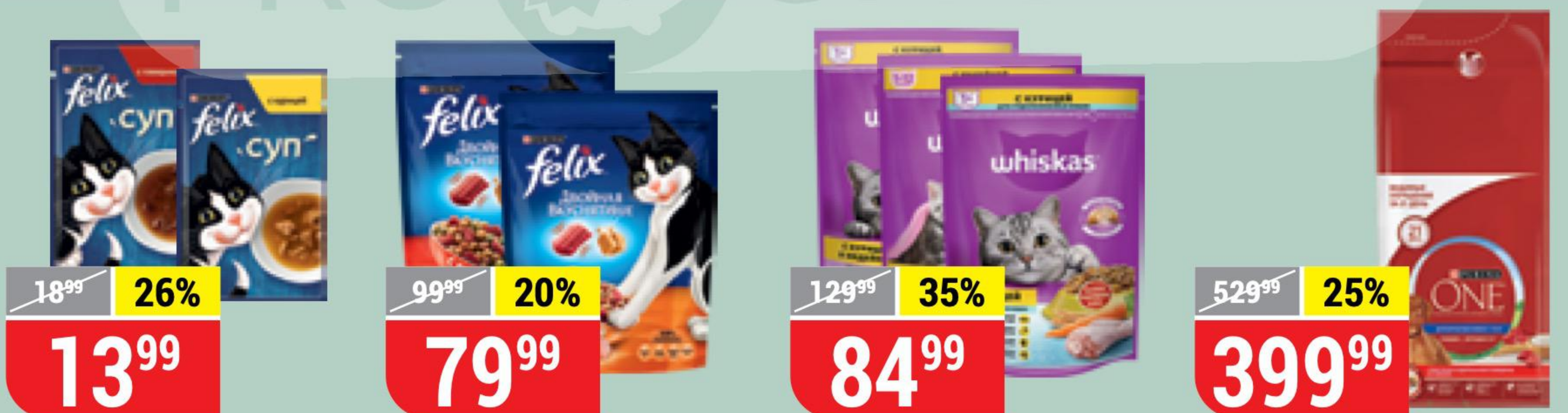
КОРМ ДЛЯ КОШЕК FELIX суп, с говядиной; с курицей, 48 г 139647/139648