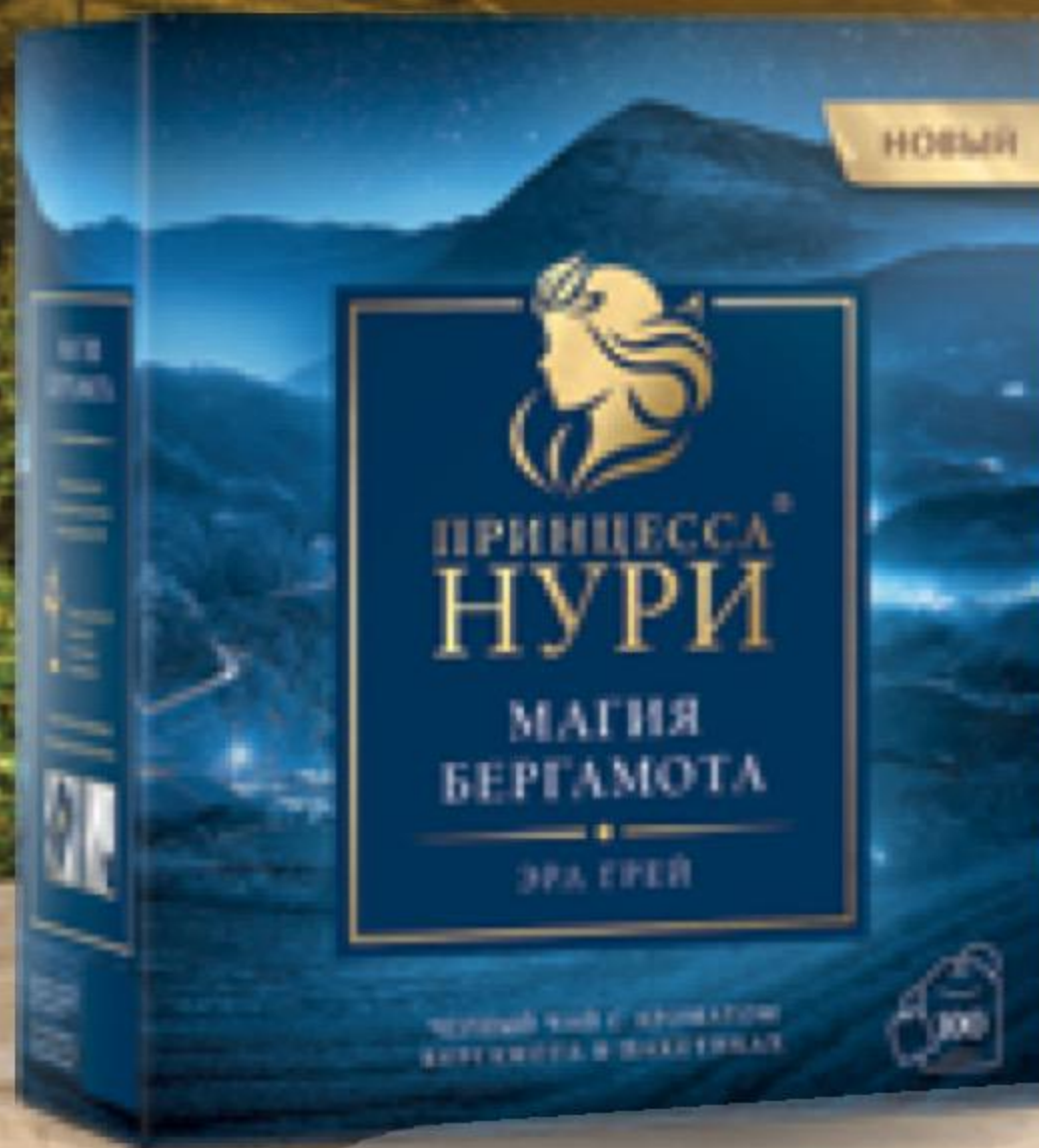
ЧАЙ ПРИНЦЕССА НУРИ магия бергамота, 100 пак. x 2 г 138220