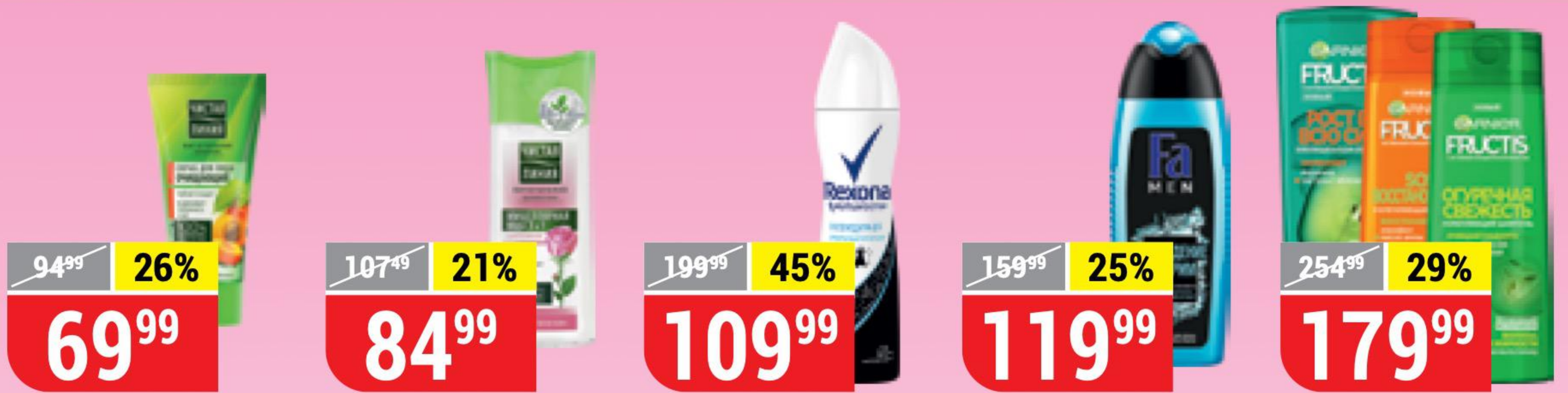
СКРАБ ОЧИЩАЮЩИЙ Чистая Линия, 50 мл 143816