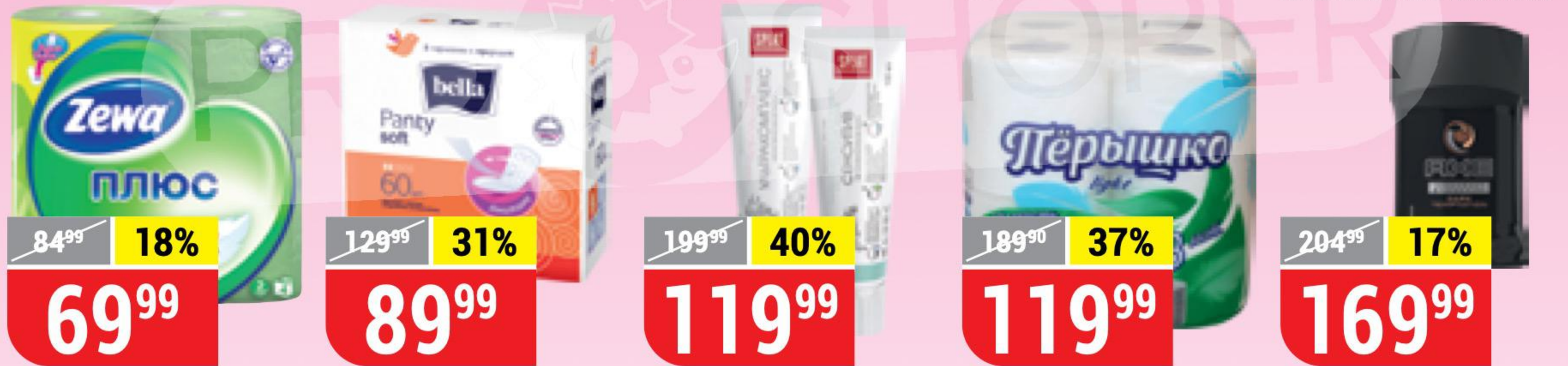
ТУАЛЕТНАЯ БУМАГА ZEWA ПЛЮС яблоко, 2 слоя, 4 рул. 108603