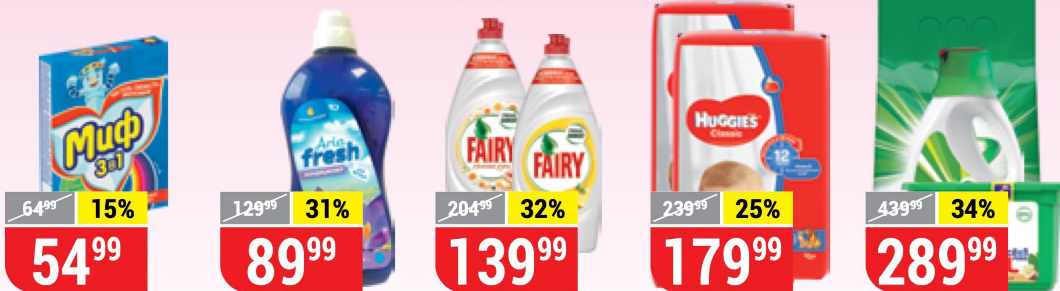
СТИРАЛЬНЫЙ ПОРОШОК МИФ свежий цвет, 3 в 1, автомат, 400 г 120705