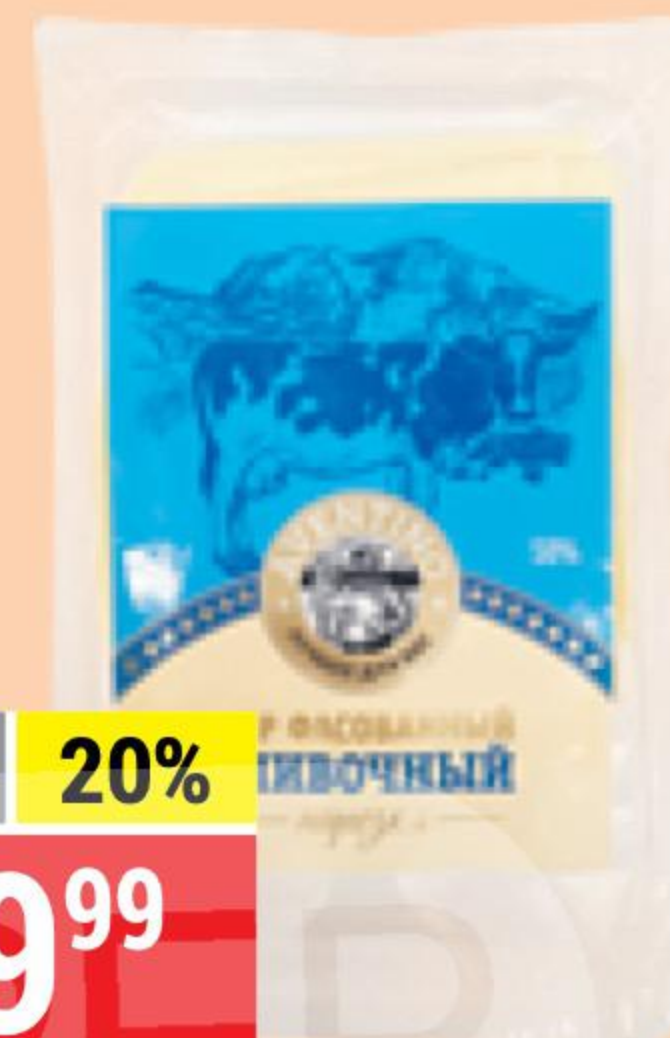
СЫР СЛИВОЧНЫЙ нарезка, 50%, Aventino, 120 г 148431