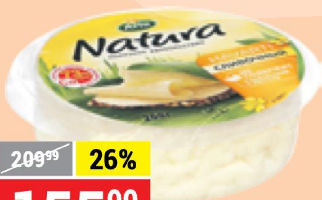
СЫР NATURA сливочный, 45%, Arla, 200 г 124404