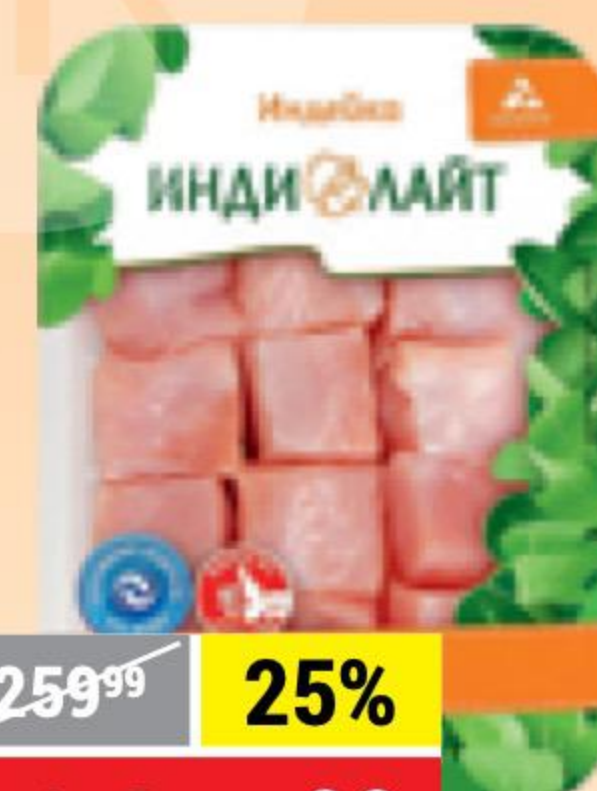
АЗУ ИЗ ИНДЕЙКИ охлажденное, ИндиЛайт, 500 г 137873