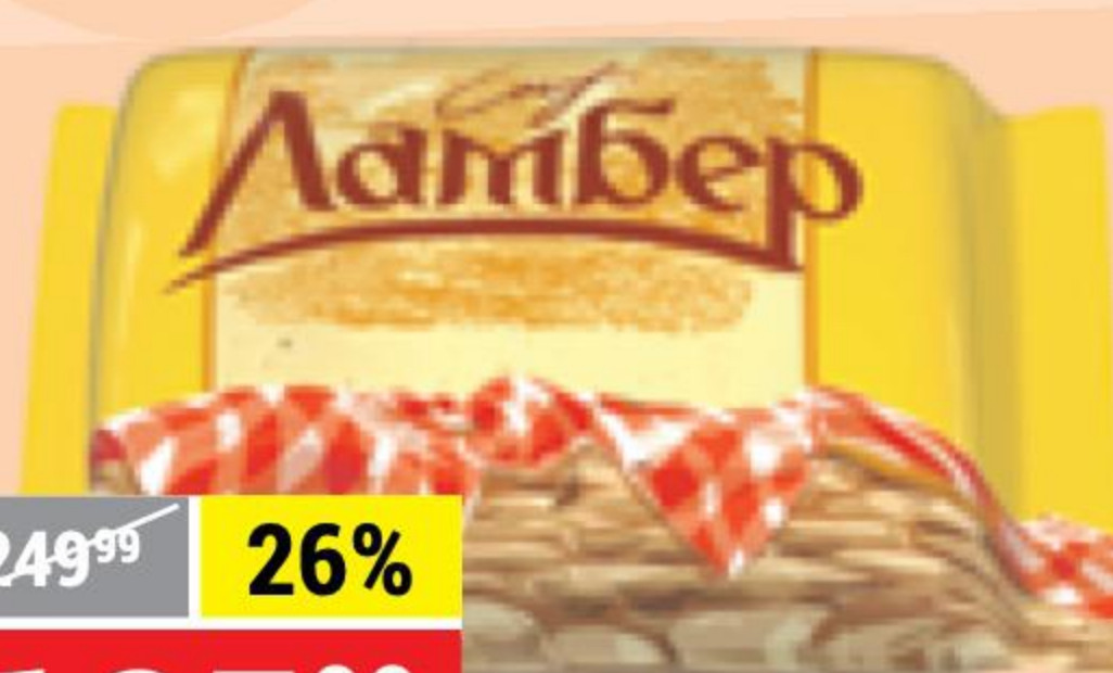
СЫР ЛАМБЕР 50%, 230 г 120891