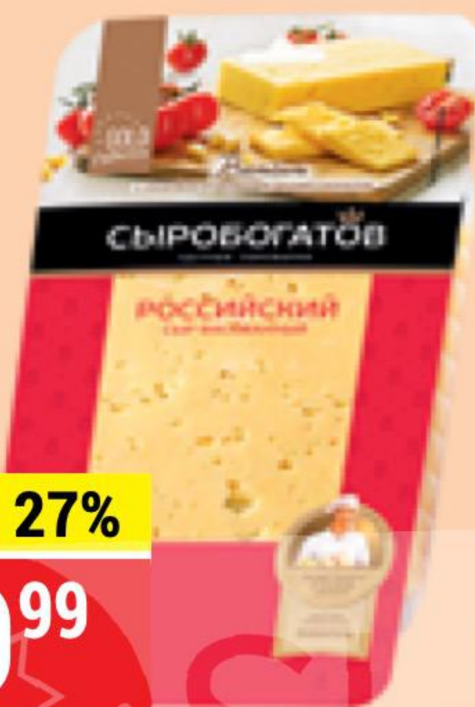
СЫР РОССИЙСКИЙ нарезка, 50%, Сыробогаатов, 125 г 143597