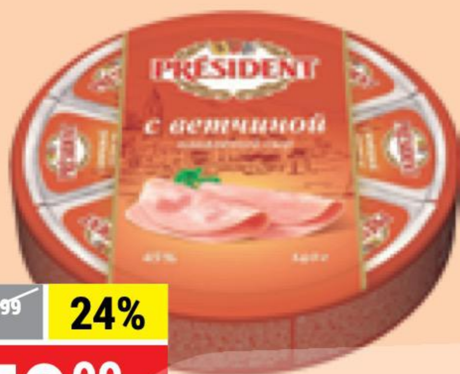
СЫР ПЛАВЛЕННЫЙ с ветчиной, 45%, President, 140 г 145877