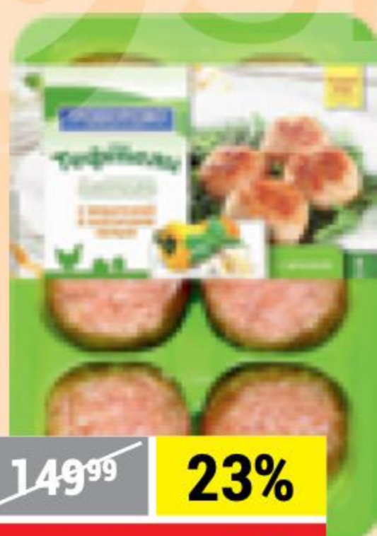
ТЕФТЕЛИ моцарелла-болгарский перец, охлажденные, Троекурово, 350 г 140018