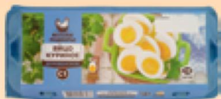
ЯЙЦО КУРИНОЕ С1, Веселое Подворье, 1 дес. 148840