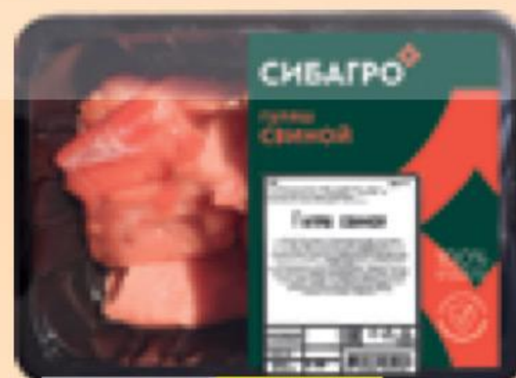
ГУЛЯШ СВИНОЙ охлажденный, Сибagro, 500 г 147119