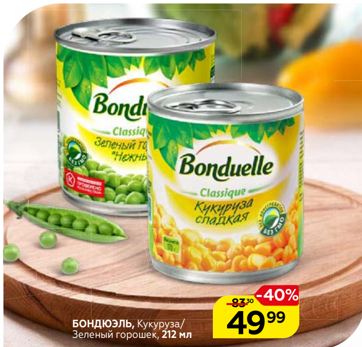
БОНДЮЭЛЬ, Кукуруза/ Зеленый горошек, 212 мл