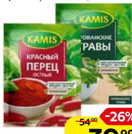
Приправа КАМИС , Перец красный Острый, 20г/ Травы прованские, 10г