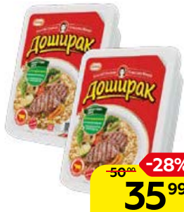
Лапша ДОШИРАК , Говядина, 90 г