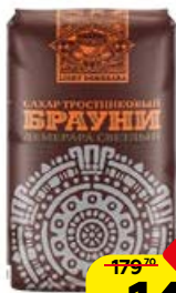
Сахарный песок БРАУНИ , тростниковый, 900 г