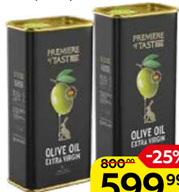
Масло оливковое PREMIERE OF TASTE® Экстра Верджин, 1л