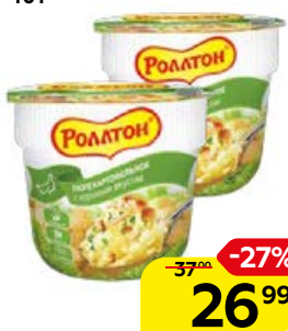
Пюре РОЛЛТОН , картофельное, с куриным вкусом, 40 г