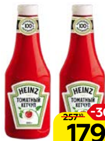
Кетчуп ХАЙНЦ , Томатный, 1000 г