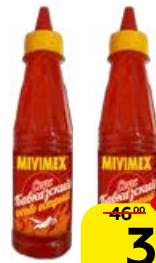
Соус МИВИМЕКС , Кавказский, острый, 200 г