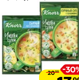
Суп КНОРР , Чашка супа с сухариками: Сырный, 15,6г/ Куриный, 16 г