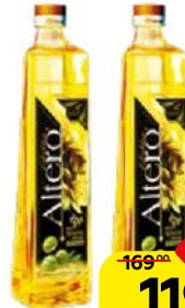
Масло АЛЬТЕРО , Gold, подсолнечное с оливковым, 810 мл