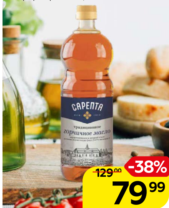
Масло горчичное САРЕПТА , нерафинированное, 1л