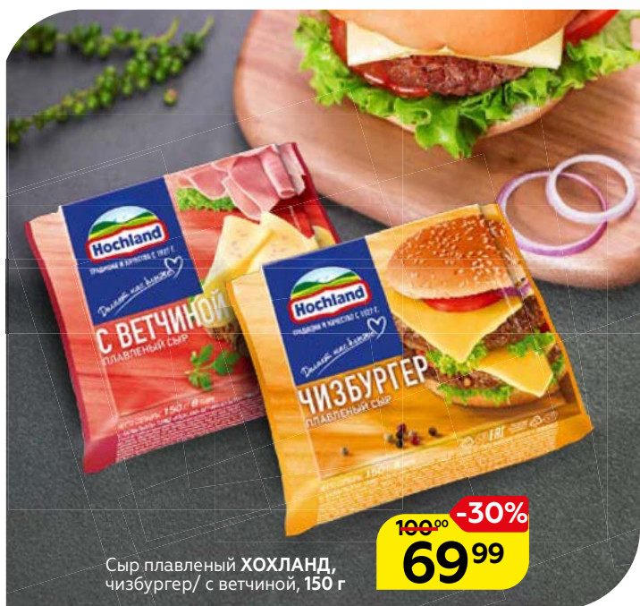
Сыр плавленый ХОХЛАНД, чизбургер/ с ветчиной, 150 г

*Ассортимент товаров, участвующих в акции, выделен на полке акционным ценником, размещенном в каждом торговом объекте.