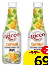
Соус МИСТЕР РИККО , сырный, 310 г