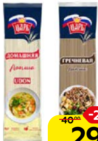
Лапша ЦАРЬ Домашняя, 450г/ Гречневая, 400г