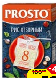
Рис ПРОСТО , Отборный, 8 пакетиков x 62,5 г